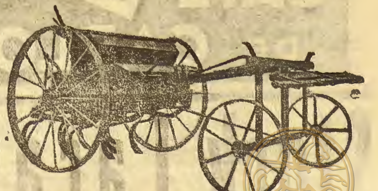
Sembradora-abonadora con avanzón, marca LABAD