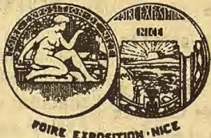
POIRE EXPOSITION NICE

Desde el año 1927 hasta la fecha se han curado más de 10.000 de todas edades