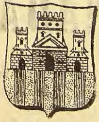
Escudo de Castejón de Monegros

A trece kilómetros de la importante villa citada, existió antiguamente un pueblecito llamado Jubierre (antes Chubierre), situado en la margen derecha del río Alcanadre, que desapareció totalmente en el siglo XVI, a consecuencia, según fidedignas narraciones, de haber sido azotado por una epidemia virulenta que diezmo su ya escaso vecindario, disminuyendo éste de tal forma, que los pocos moradores hubieron de refugiarse en Castejón de Monegros.