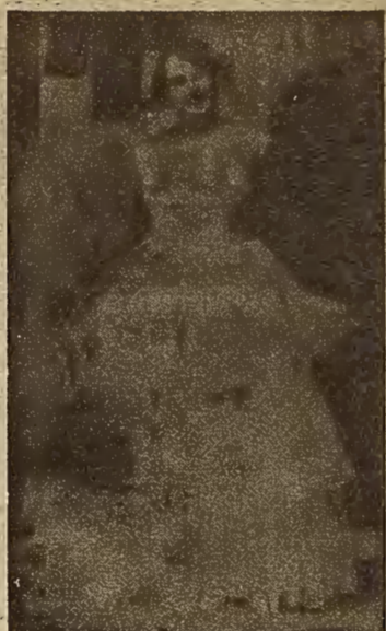
CARMEN BURGUETE La afamada canzonetista y genial artista que anoche debutó en el ODEÓN

Pérdida de cien pesetas y una cuenta de modista. Informes en esta Administración.