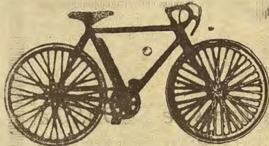
Talleres de reparaciones

Artigua casa de confianza la más importante de Aragón