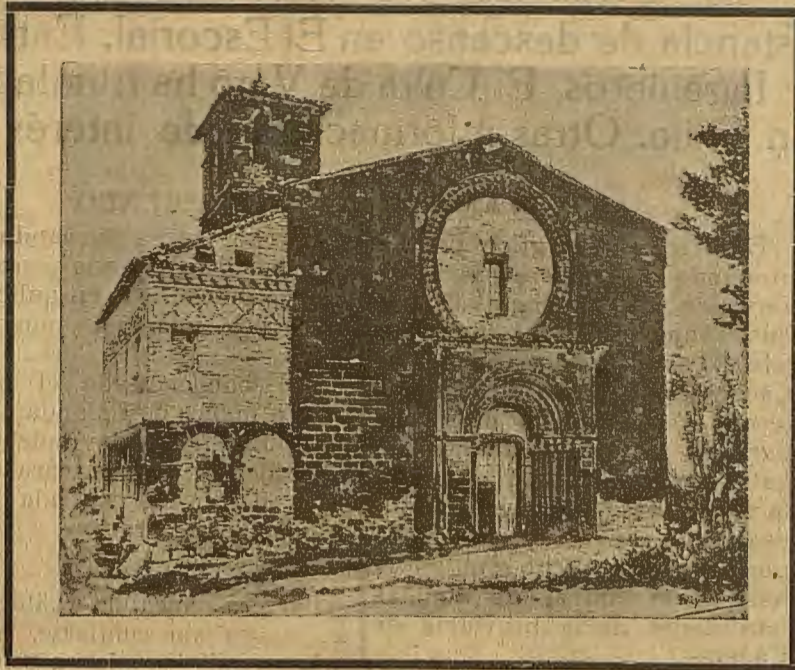
Histórica ermita de Nuestra Señora de Salas