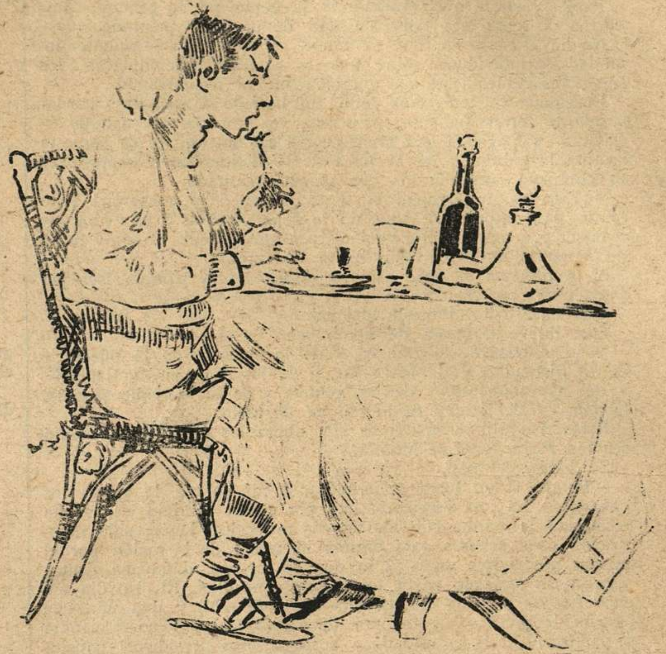
La una de la tarde.