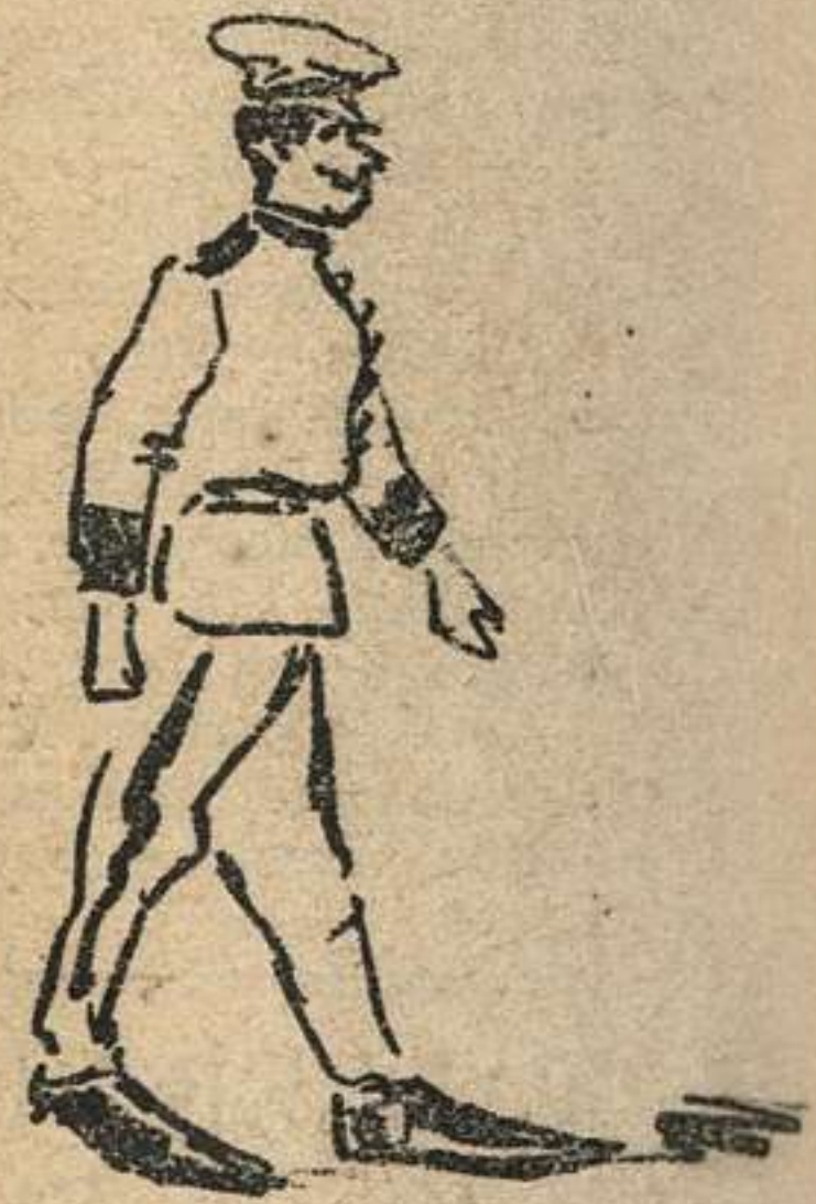
A CÓRDOBA le compró la gorra este militar y cuando la fué á estrenar, en el momento ascendió.