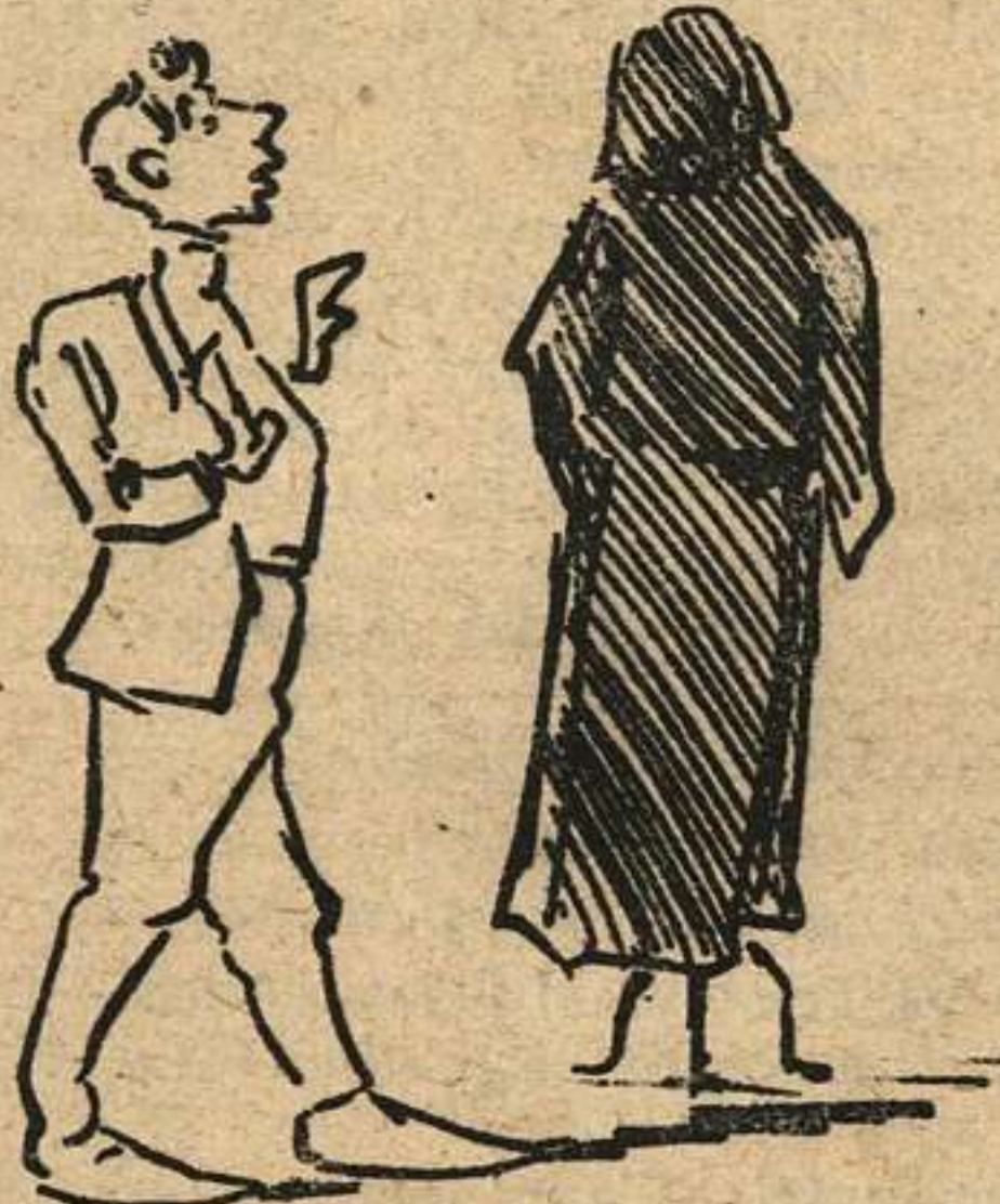
¡Oh que prenda más notable! que completa maravilla! Le he comprado á TORRECILLA un precioso impermeable.