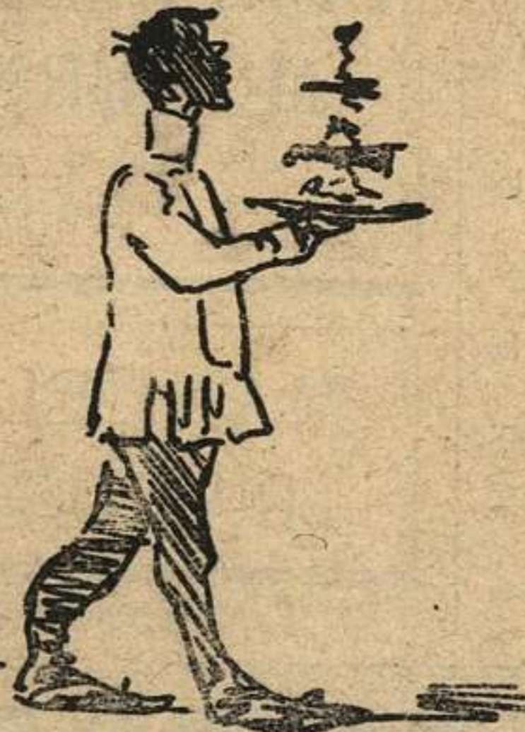
Ante la forma tan sola de este gran plato montado, se ve que lo ha fabricado la CONFITERIA ESPAÑOLA.