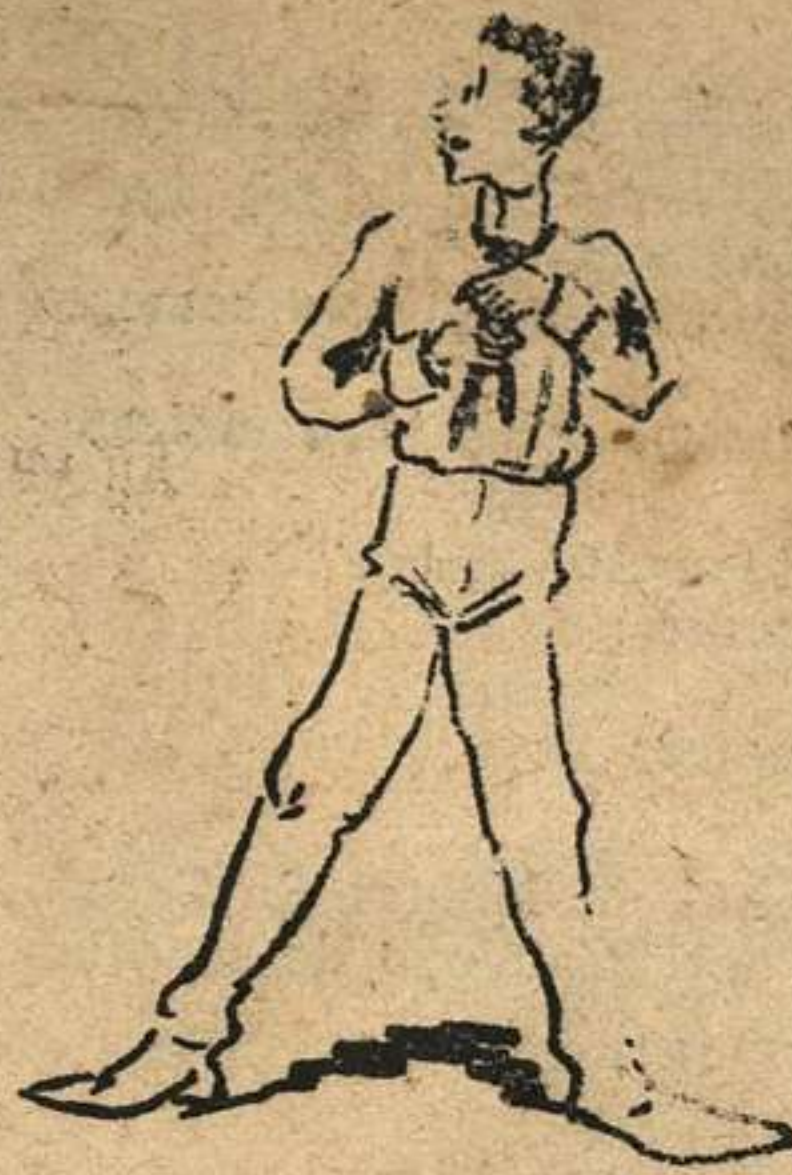
Para calmar sus afanes, el hombre, afanoso trata de ponerse una corbata comprada en LOS CATALANES.