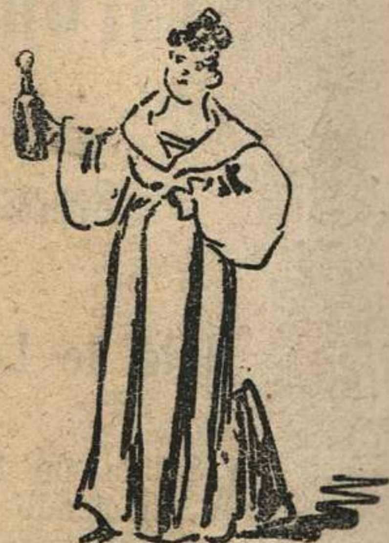
¡BISQUIT DUBOUCHE! Que marca de cognac tan superior! Nadie lo encuentra mejor en esta oriental comarca!