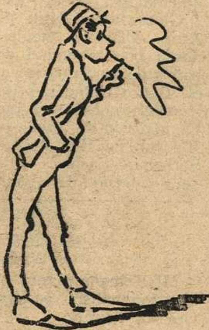
Quien en fumar bien se afana, compra con predilección cigarrillos de LA COMPETIDORA GADITANA.