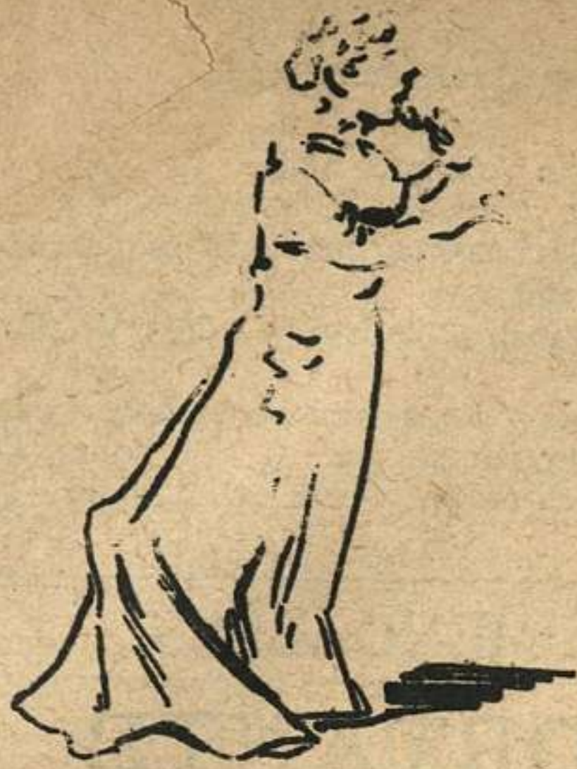
Una mujer que se empeña, mejor que en ponerse rizos, en comer ricos chorizos comprados en LA EXTREMEÑA.