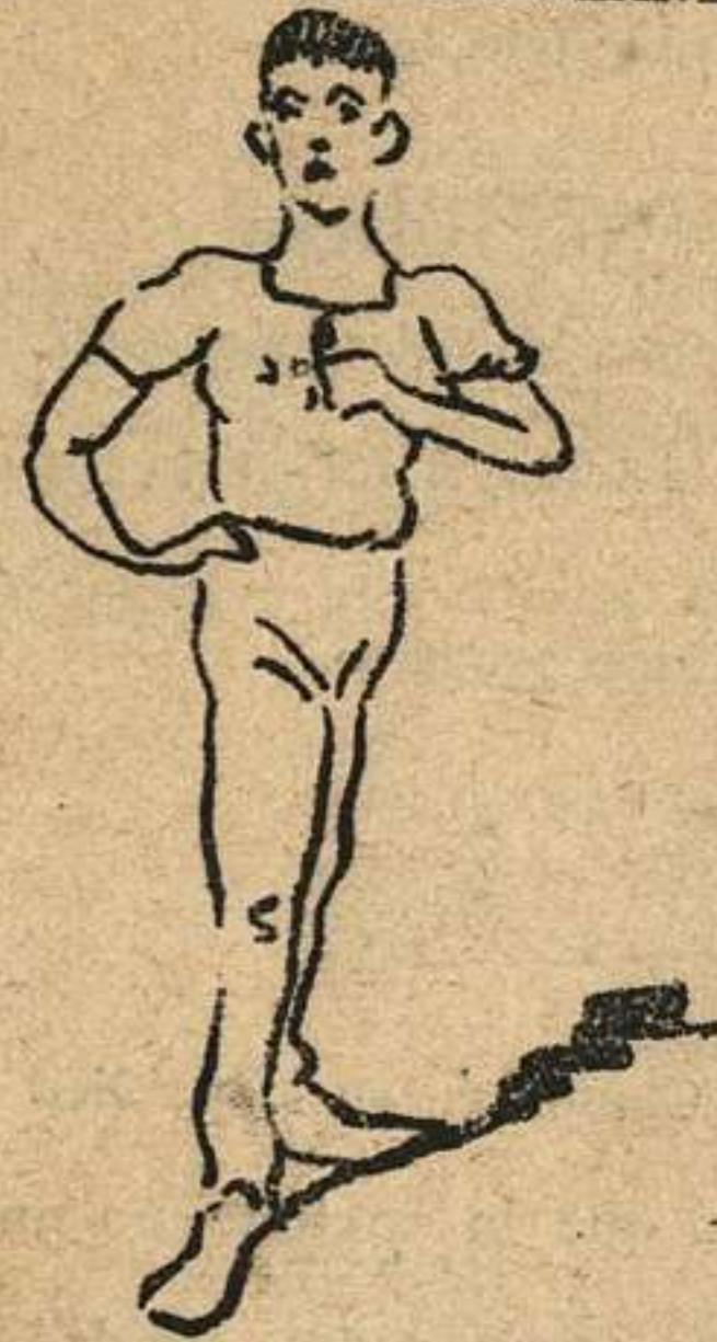
¿Quereis notabilidades y gastaros las pesetas en soberbias camisetas? Pues id á LAS NOVEDADES.