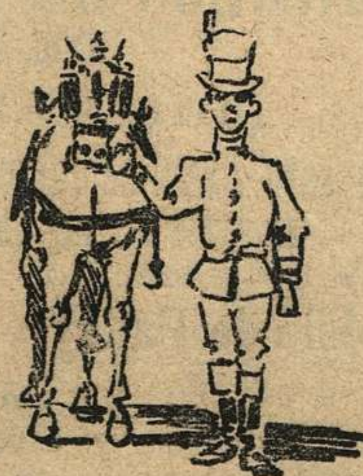
Este caballo que ves, todos sus defectos feos los ocultan los arcos comprados en EL ARNÉS.