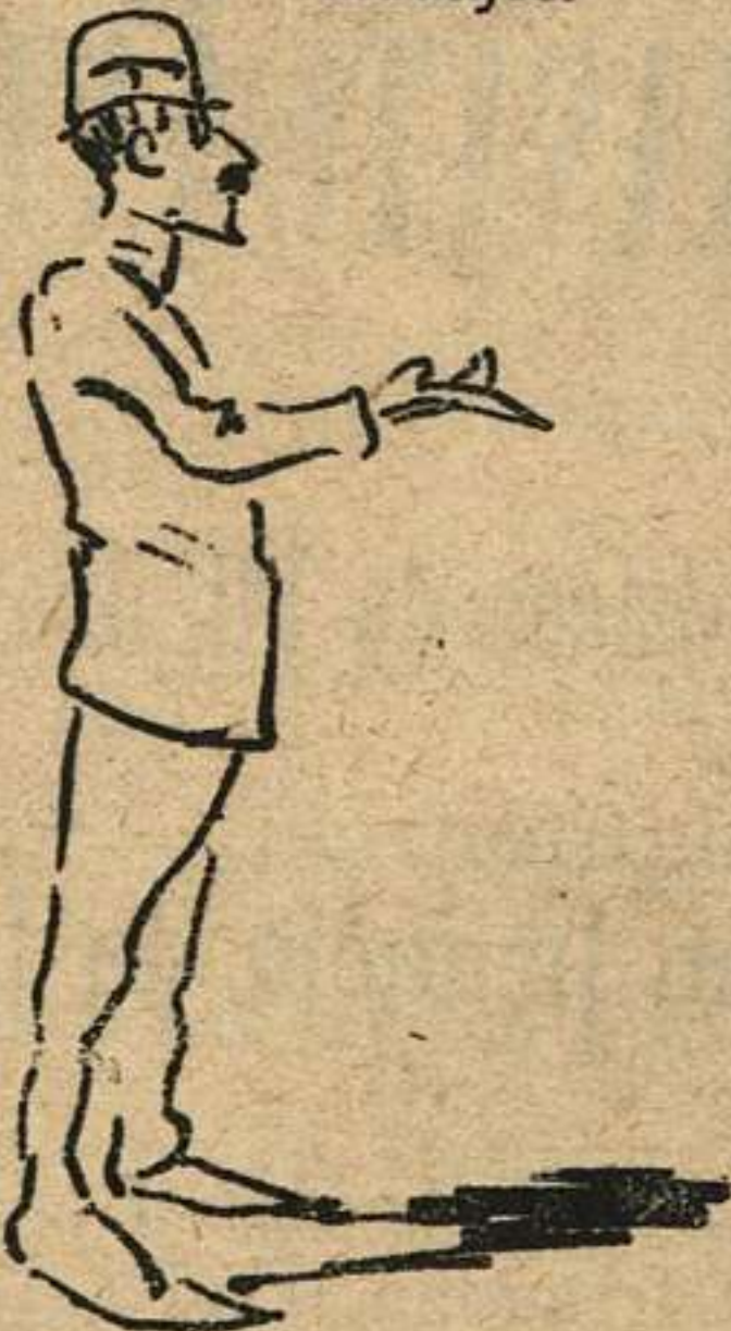
—Oye, mi querido Paco; me tienes que aconsejar: ¿En donde puedo encontrar toda clase de tabaco?