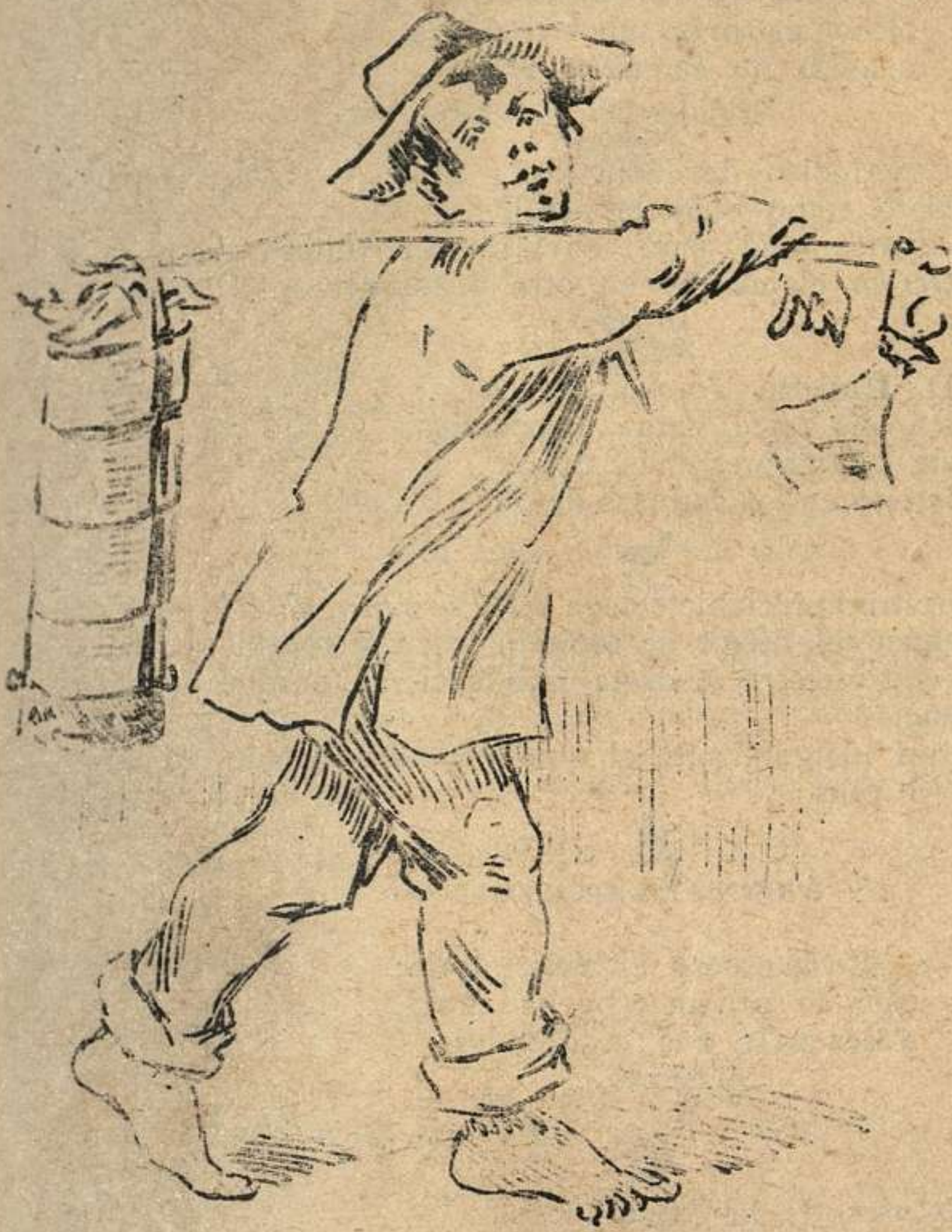
Las doce del día.