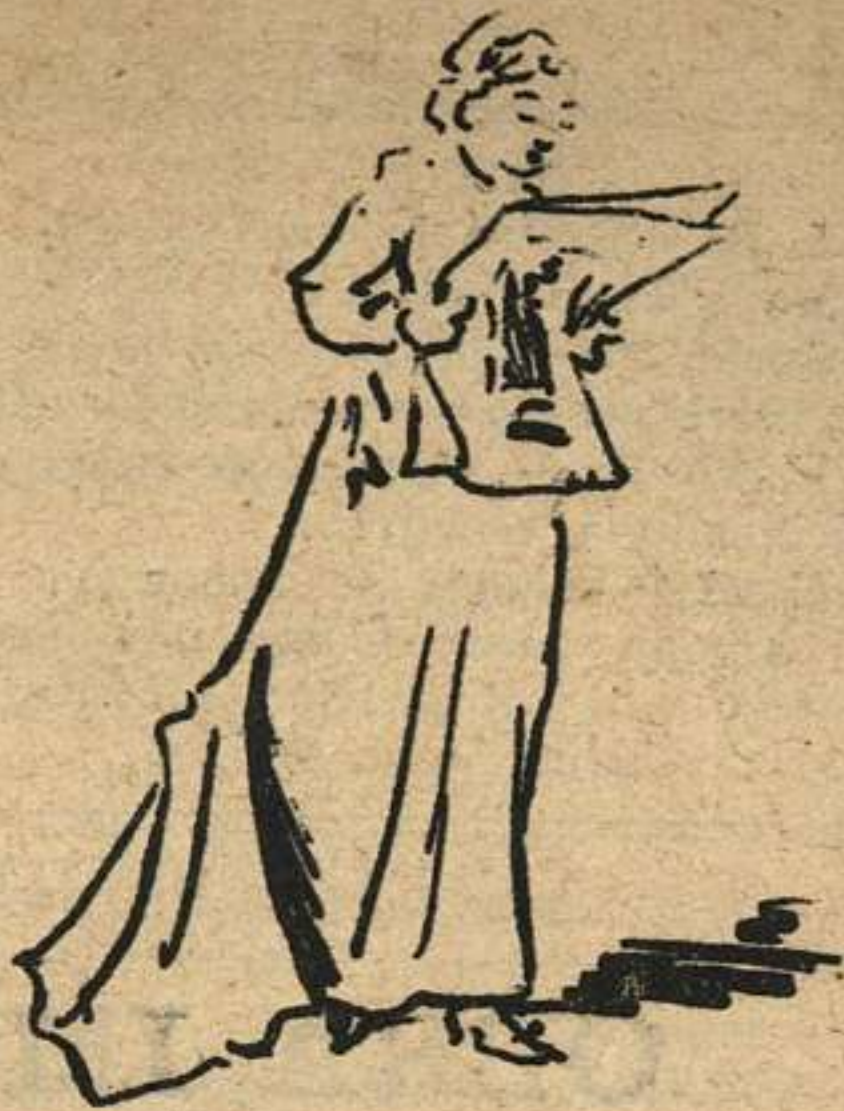
Y cifra su dicha toda y por ello se desvive, porque BOTA, la suscribe á leer La última moda .