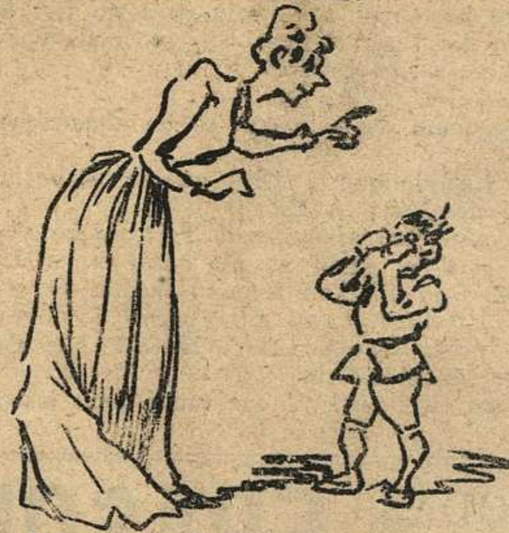
Da á su madre tanta guerra y no calla aunque lo maten, por querer que lo retraten en casa del gran PERTIERRA.