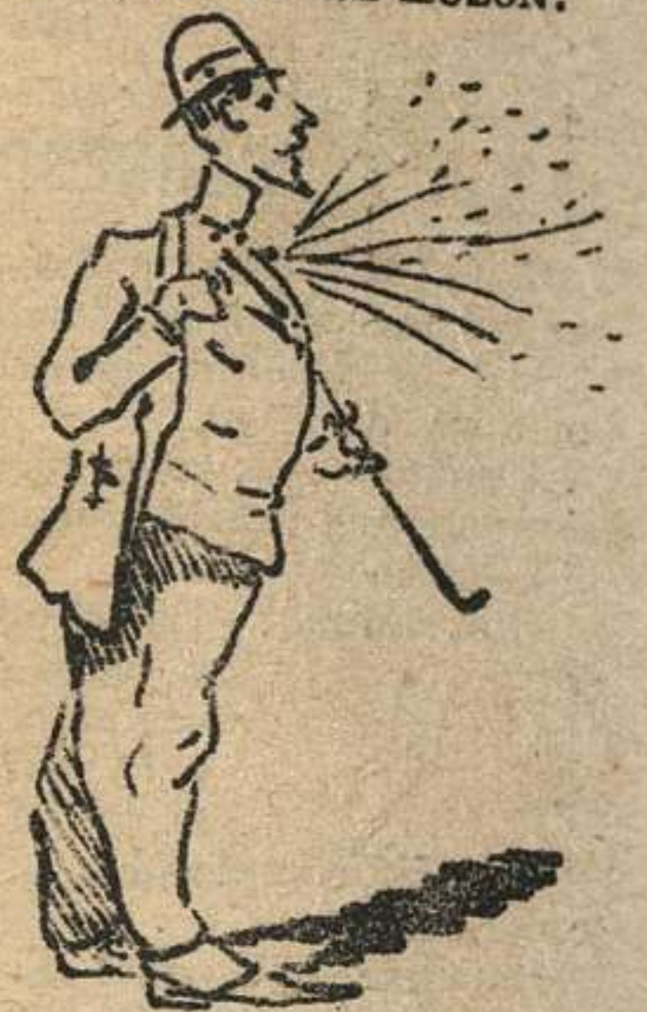
Ufano va el caballero con alfiler de brillantes, brillantes que fueron antes de FELIX ULLMANN, Joyero.