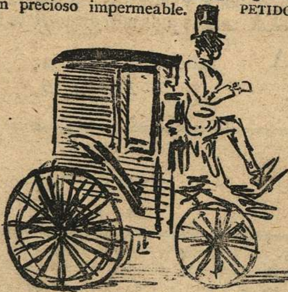
PADERN Y FONT, sin ultrajes, decirse puede, señores; son notables constructores de soberbios carruajes.