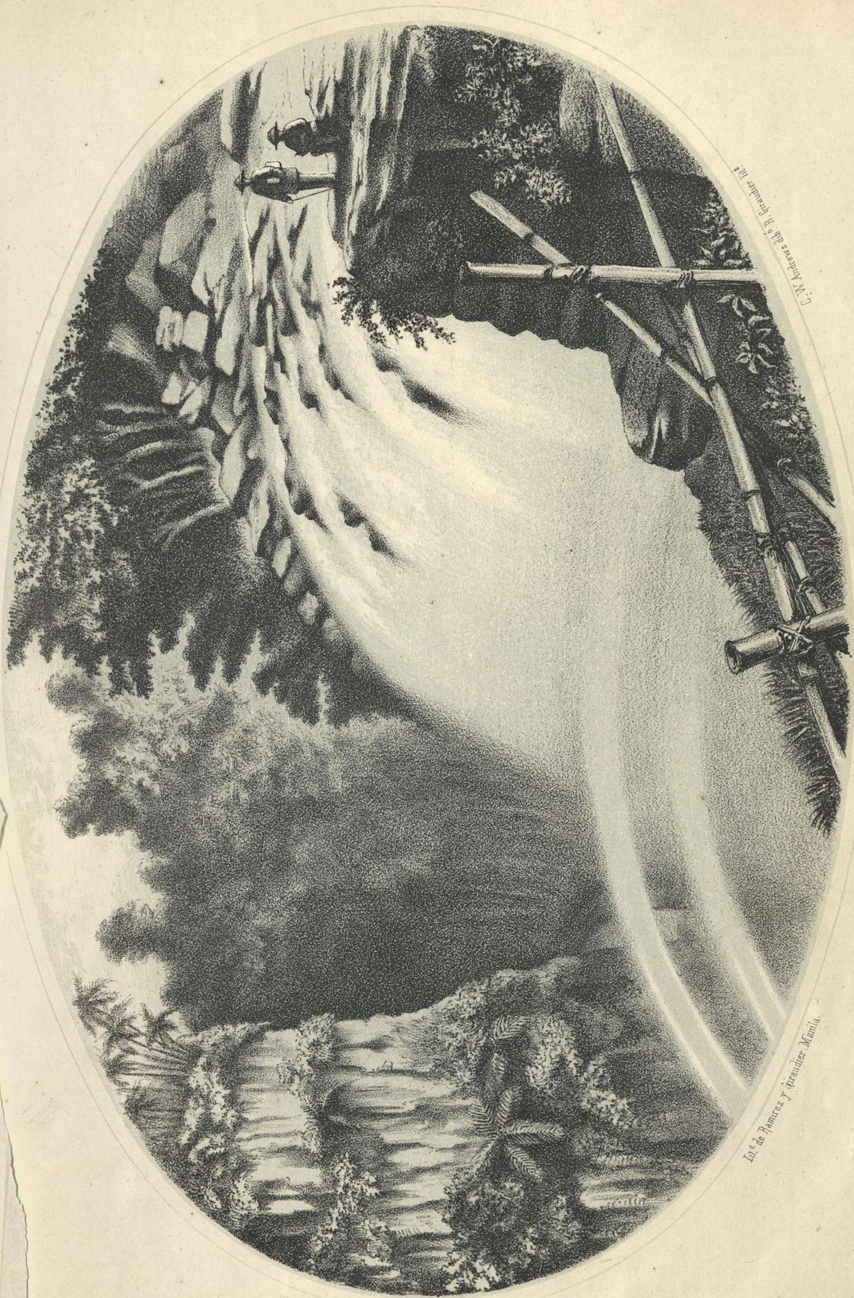
CASCADA DEL BOTOCCAN. Provincia de la Laguna.