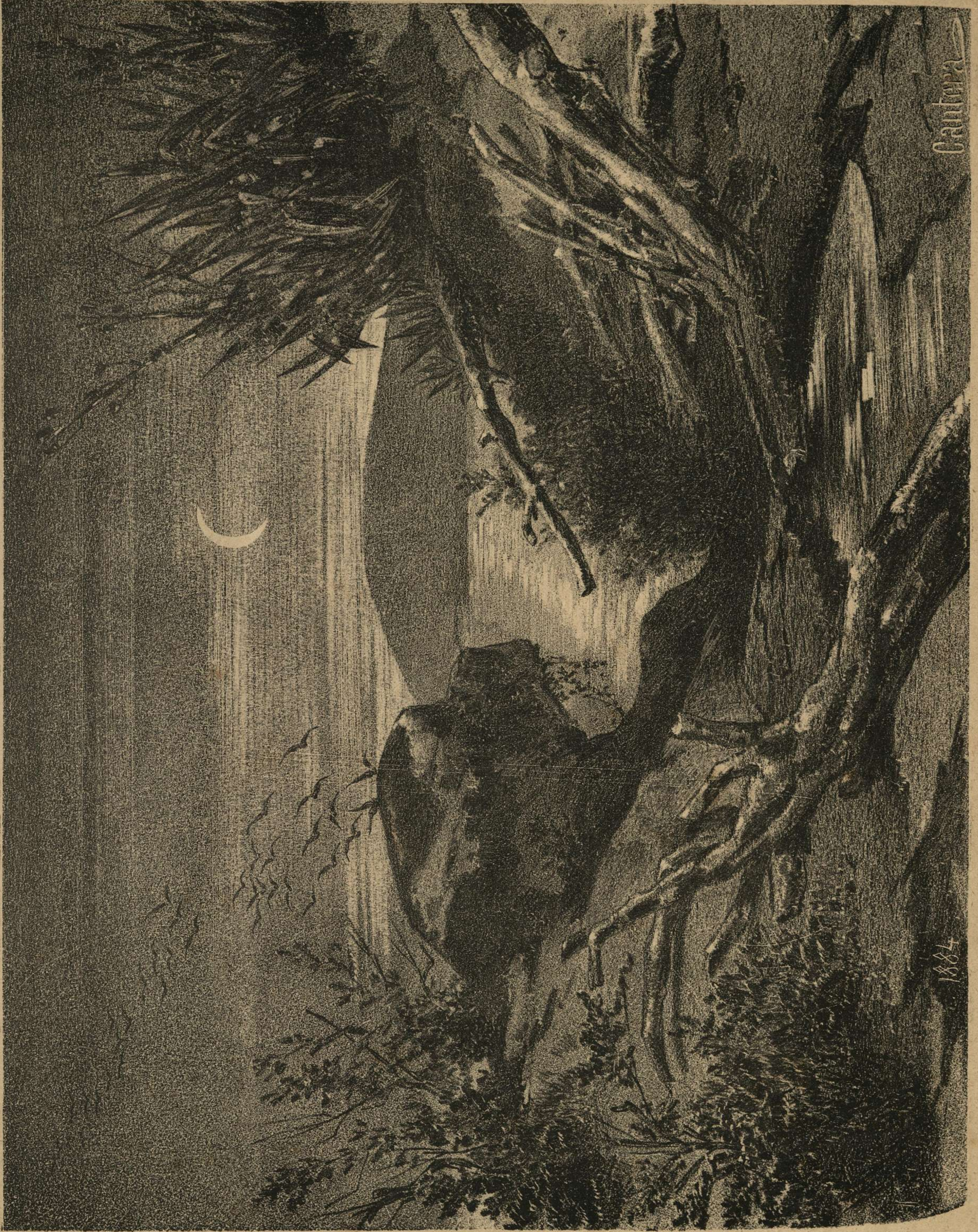
Entrada de una noche de Invierno