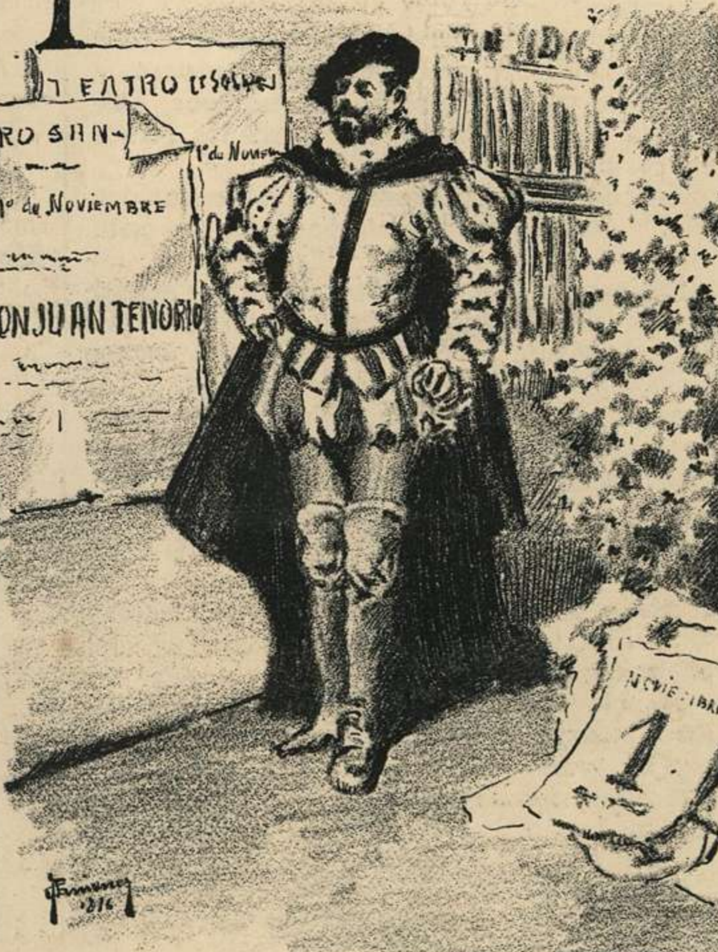
QUI ESTÁ DON JUAN TENORIO PARA QUIEN QUIERA ALGO DE ÉL

Siempre bien equipado, ciñendo el airoso talle acuchillado jubón, atrevidamente caído á un lado el birrete sobre que duerme rendida la blanca pluma, rizada como pestañas de hermosa; la mano en el puño de la tizona de retorcidos gavilanes, el bigote levantado, la mirada audaz, insolente la sonrisa, á la evocación de Noviembre acude Don Juan Tenorio, arrogante y enamorado, ostentando ricas preseas y gallarda apostura.