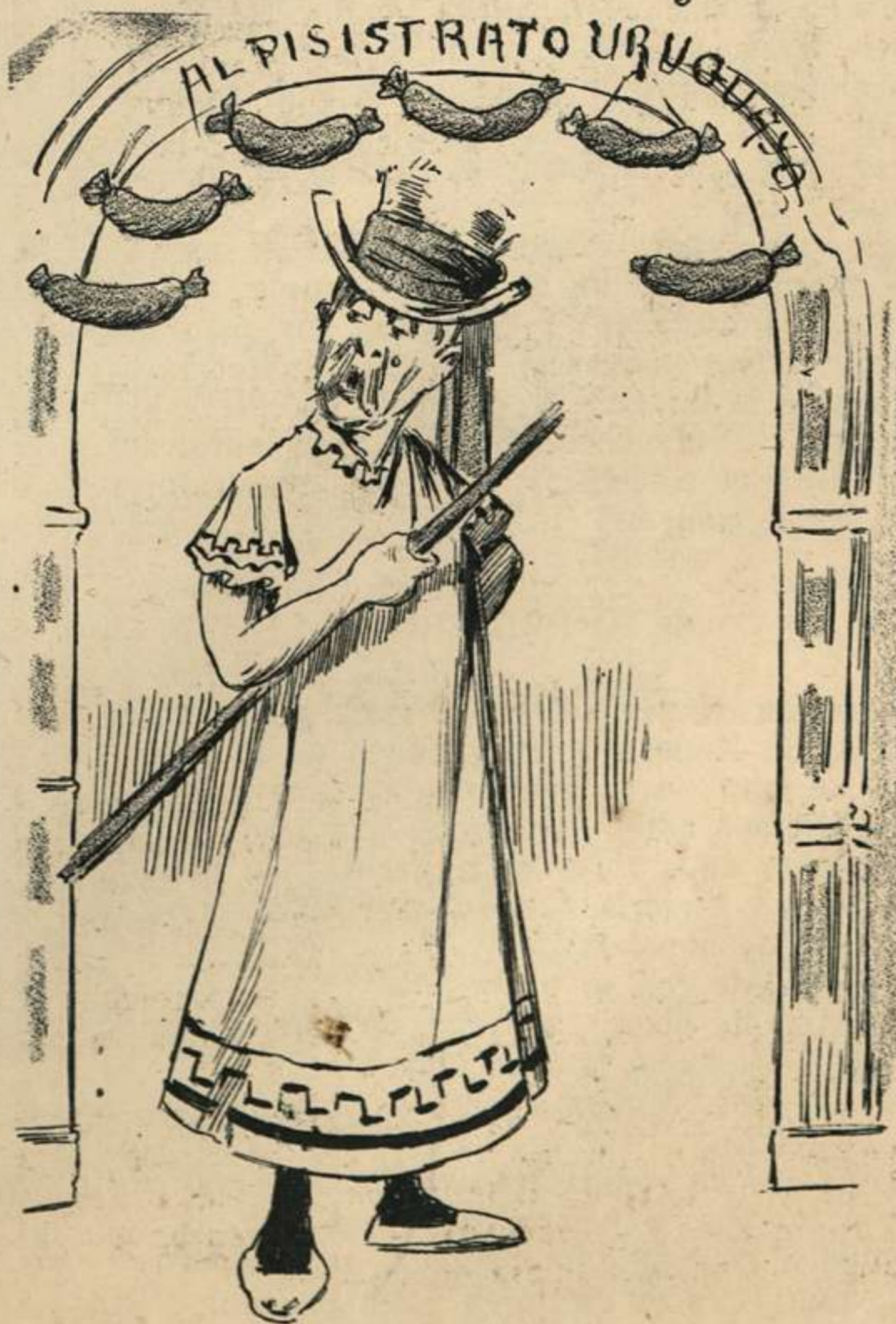
EL PISÍSTRATO URUGUAYO