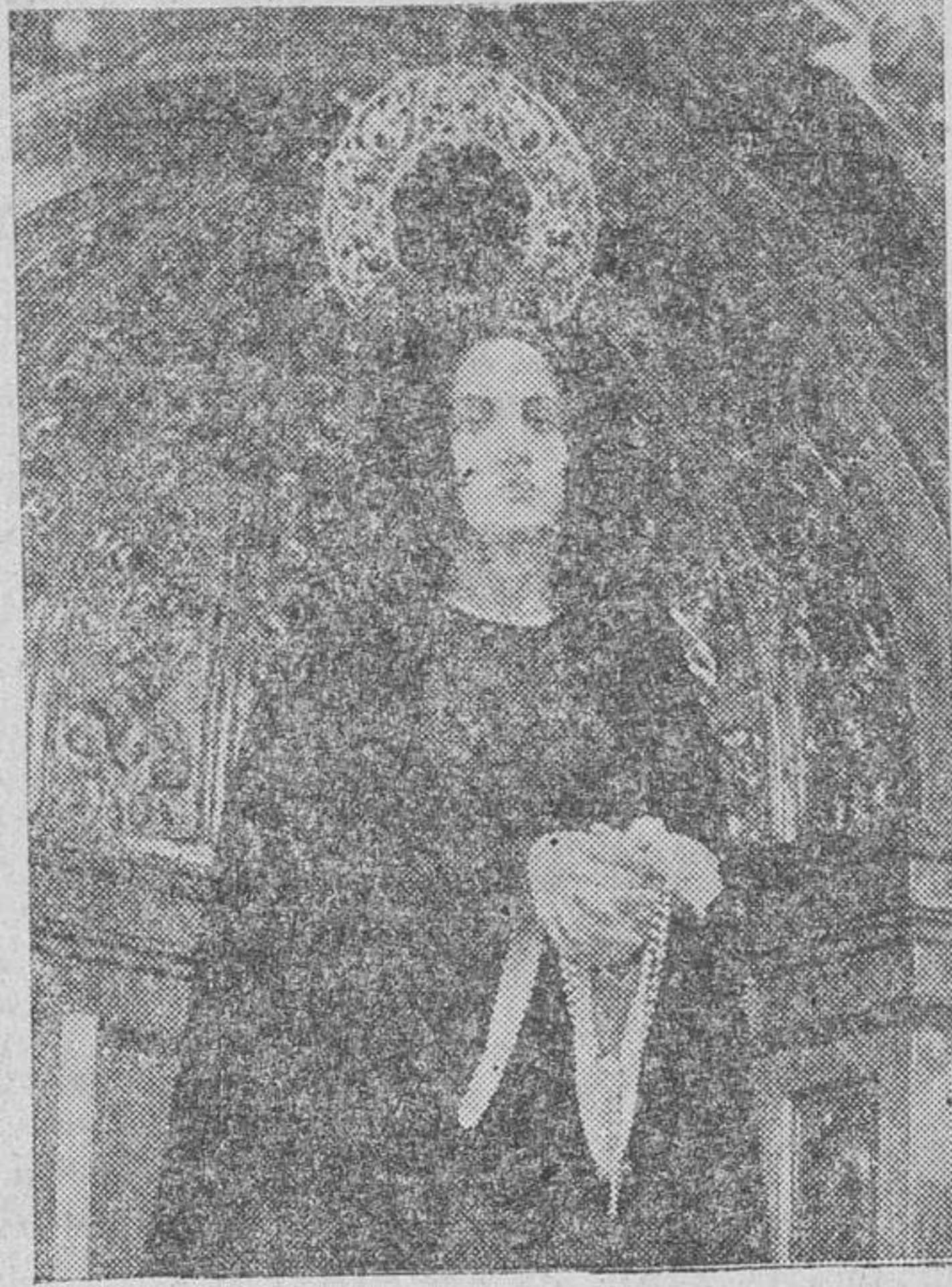
NUESTRA SEÑORA DE LA SOLEDAD. OBRA DE BENLLIURE. — A LA IZQUIERDA, LA VIRGEN DE LOS DOLORS, DE MONTAGUT