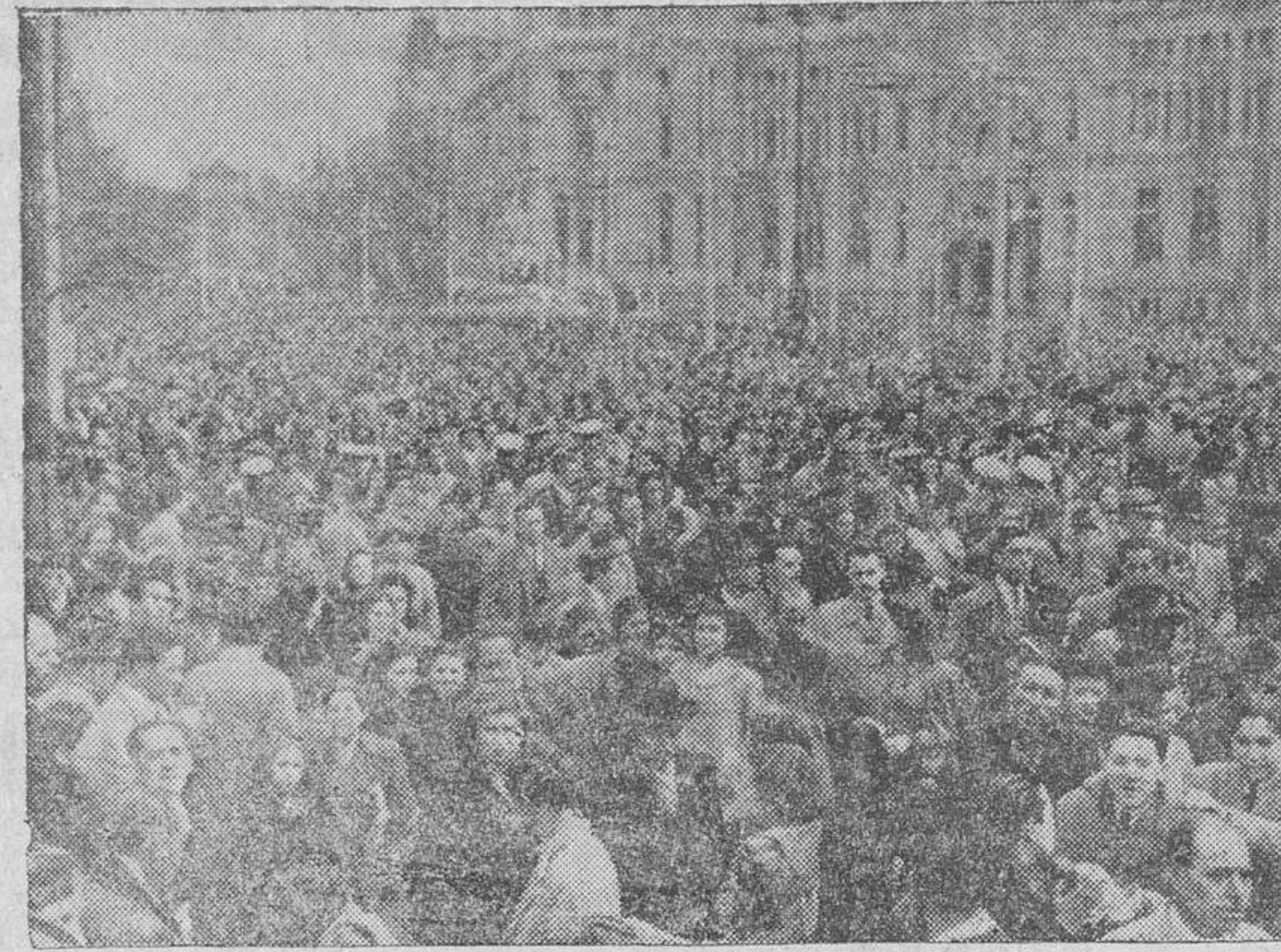
Su Excelencia el jefe del Estado, Generalísimo Franco presidiendo el desfile militar desde la tribuna presidencial. — Importante aspecto que ofrecía la calle de Alcalá al paso de la manifestación, que, dirigiéndose al Palacio Nacional tributó al Caudillo un fervoroso y entusiasta homenaje.