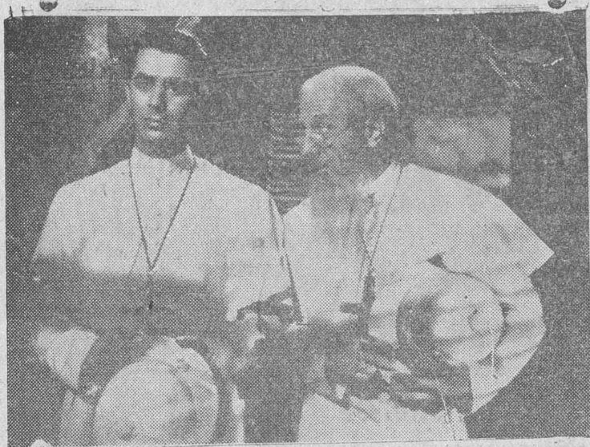
Una escena de «Misión blanca»

Esta noche se estrenará en «Galas de Prensa»