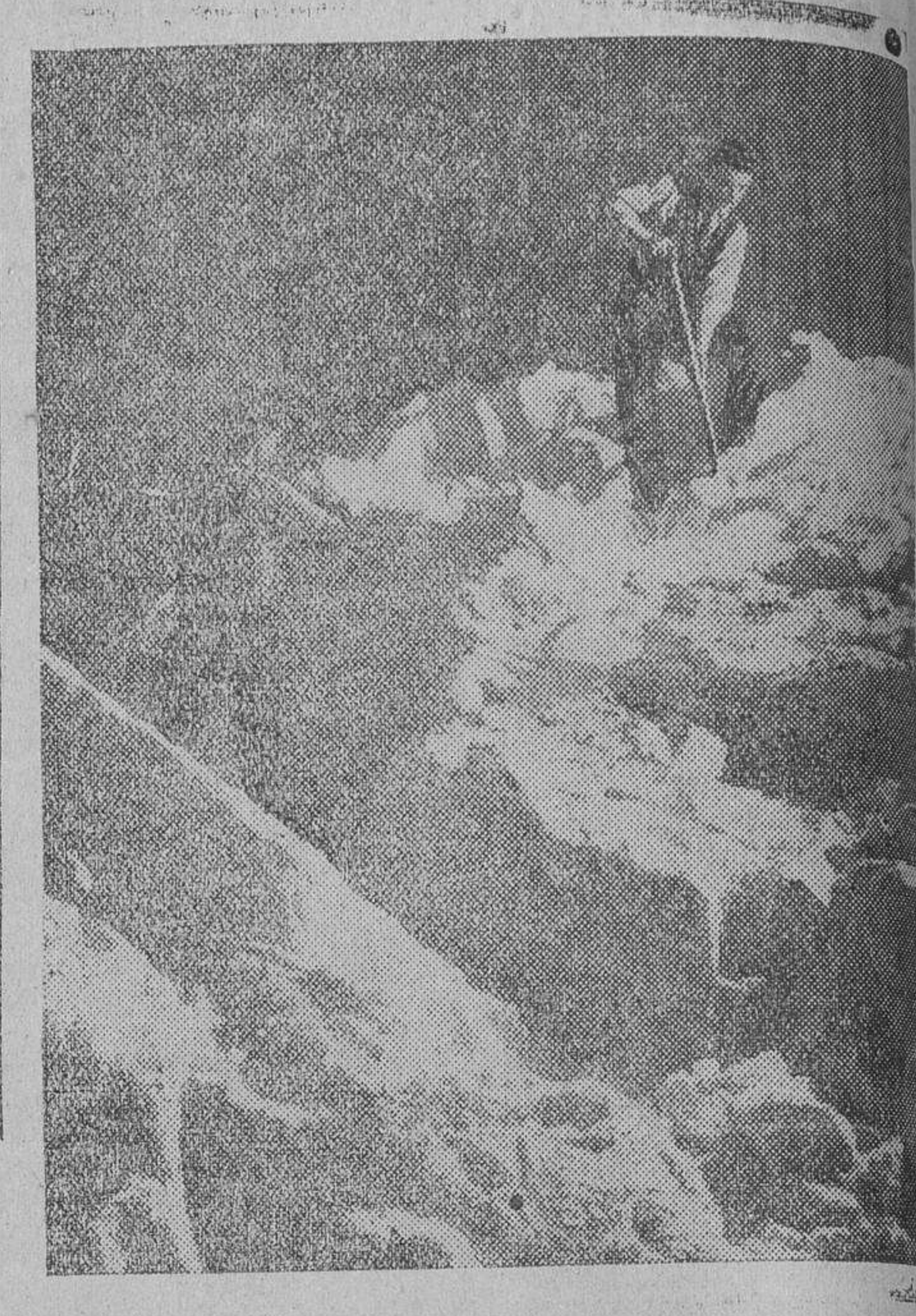
Obreros desprendiendo la sal cristalizada antes de secarla. Esta fotografía está obtenida en las fábricas de New Cheshire.