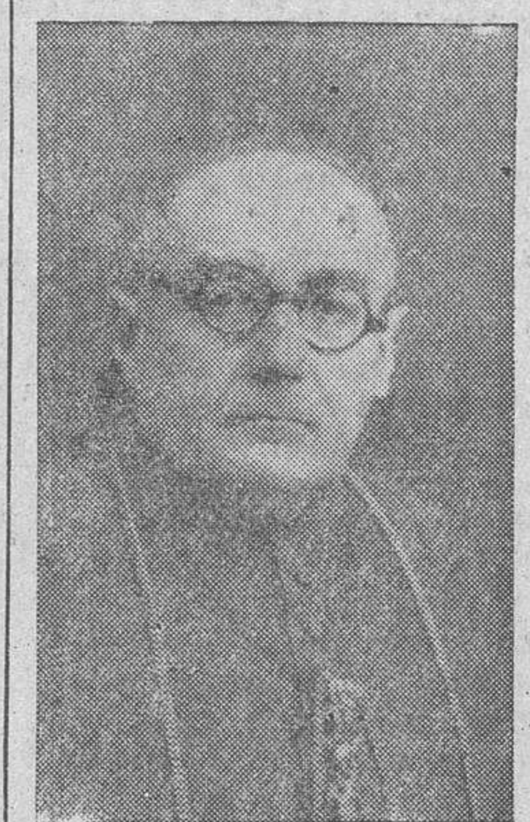
Doctor don Enrique Plá y Deniel, arzobispo de Toledo y obispo que fué de la diócesis de Salamanca

Tarragona.—En el Palacio Arzobispal se han recibido te-