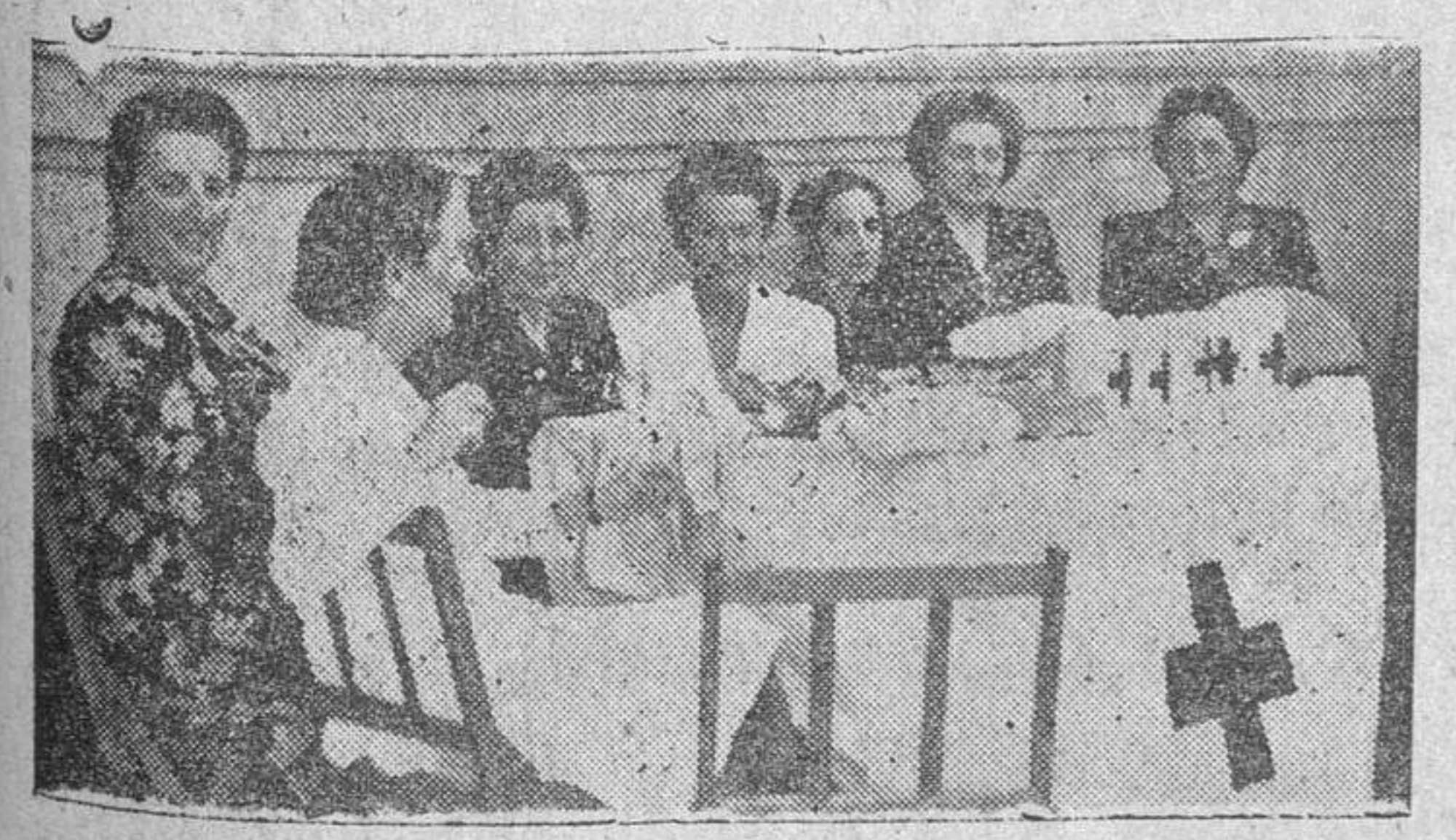
Una de las mesas petitorias en las que figuraban distinguidas señoras y señoritas

La extraordinaria animación que ayer hubo en la ciudad, con motivo del primer día grande de la feria, contribuyó espléndidamente al éxito de la Fiesta de la Banderita, para recaudar fondos a beneficio de la Cruz Roja Española.