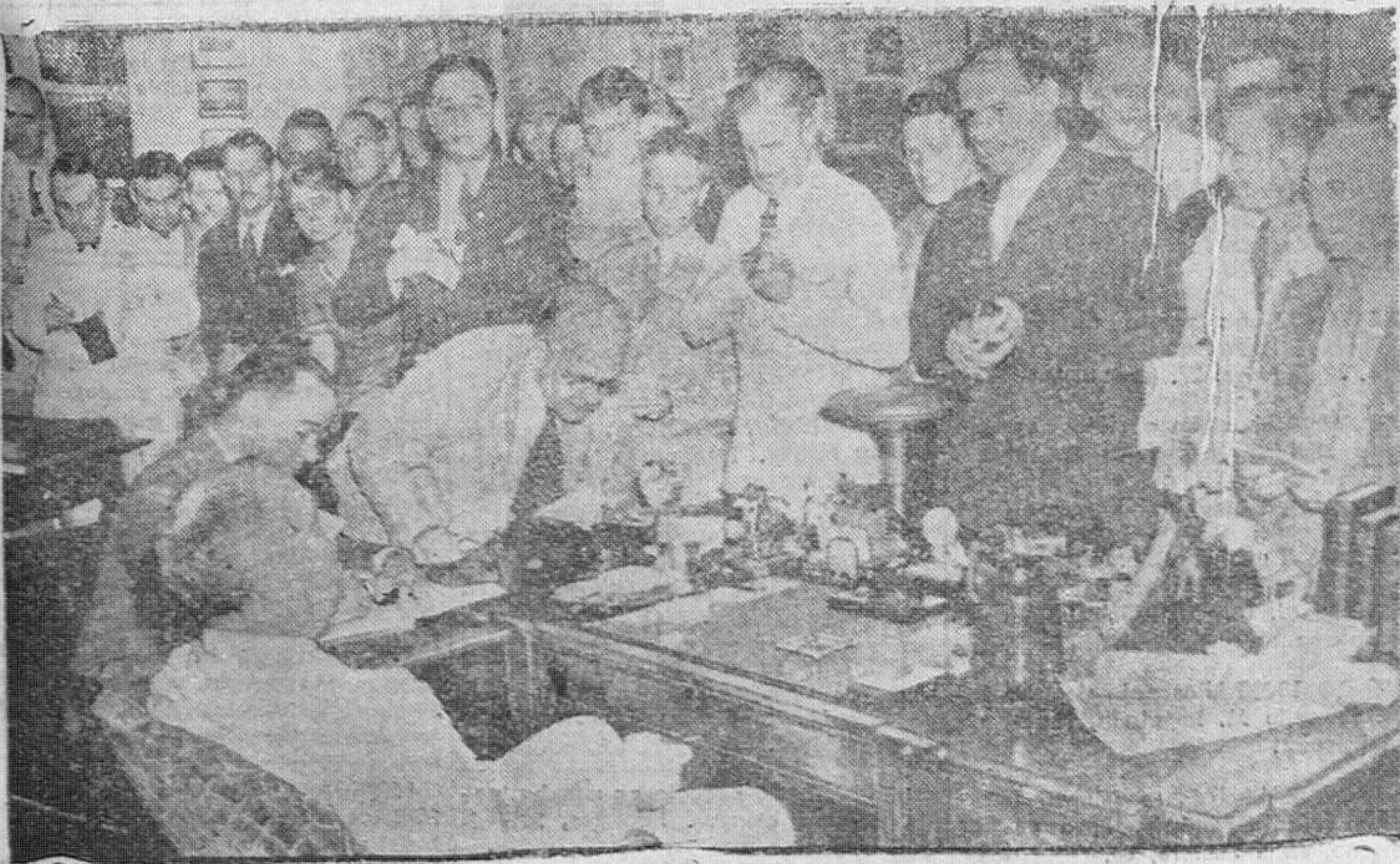
Roosevelt, rodeado de los corresponsales de los grandes diarios, durante una de las entrevistas bisemanales de la prensa, en las que el Presidente informa diariamente de los más destacados acontecimientos