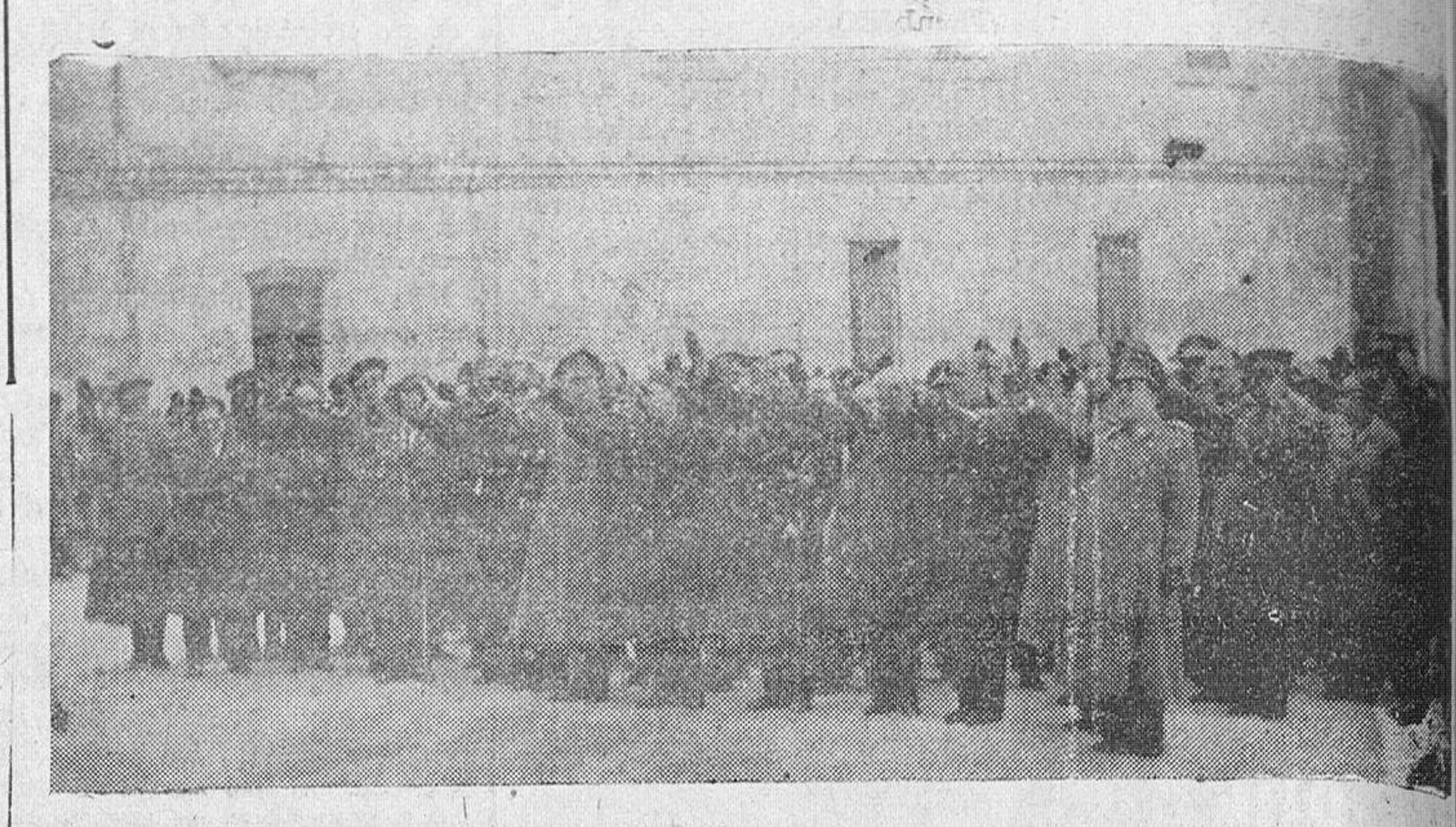
Las autoridades, jerarquías y representaciones, en el momento de colocar las coronas en el muro de la Catedral, como homenaje a los caídos

Asistieron, con el Delegado Nacional de Sindicatos y las jerarquías nacionales, las autoridades y jera quias provinciales y locales