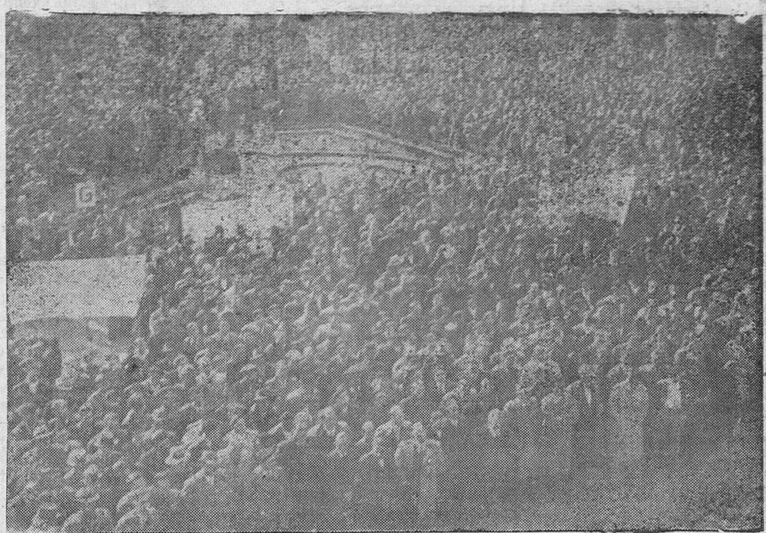
Un aspecto de la Plaza Mayor, durante la concentración de productores y empresarios.

El Delegado Provincial Sindical terminó su brillante discurso refiriéndose a los productores a los discursos que iban a pronunciar los siguientes oradores y ofreciendo al grandioso espectáculo de la concentración al Delegado Nacional. Acabó diciendo: "Con el corazón en alto y por nuestro lema de Patria Pan y Justicia. ¡Arriba España!"