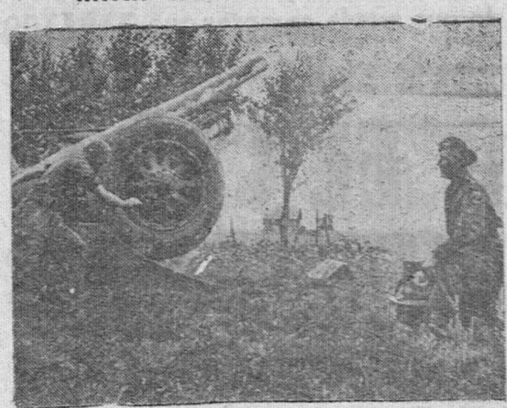
Una pieza de artillería aliada, es trasladada rápidamente a las nuevas posiciones de avance en la frontera germana.