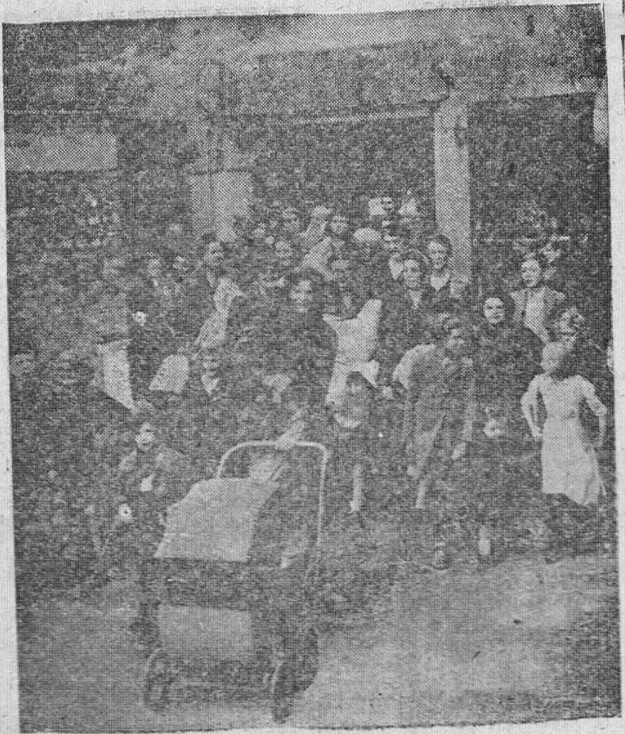
Ante la desaparición del peligro de los cañones alemanes, situados en la costa del Canal de la Mancha, los habitantes de Dover salen de las cuevas que durante tanto tiempo fueron habitadas como refugio de la población civil.

El Adelanto es el diario más antiguo en la capital y provincia