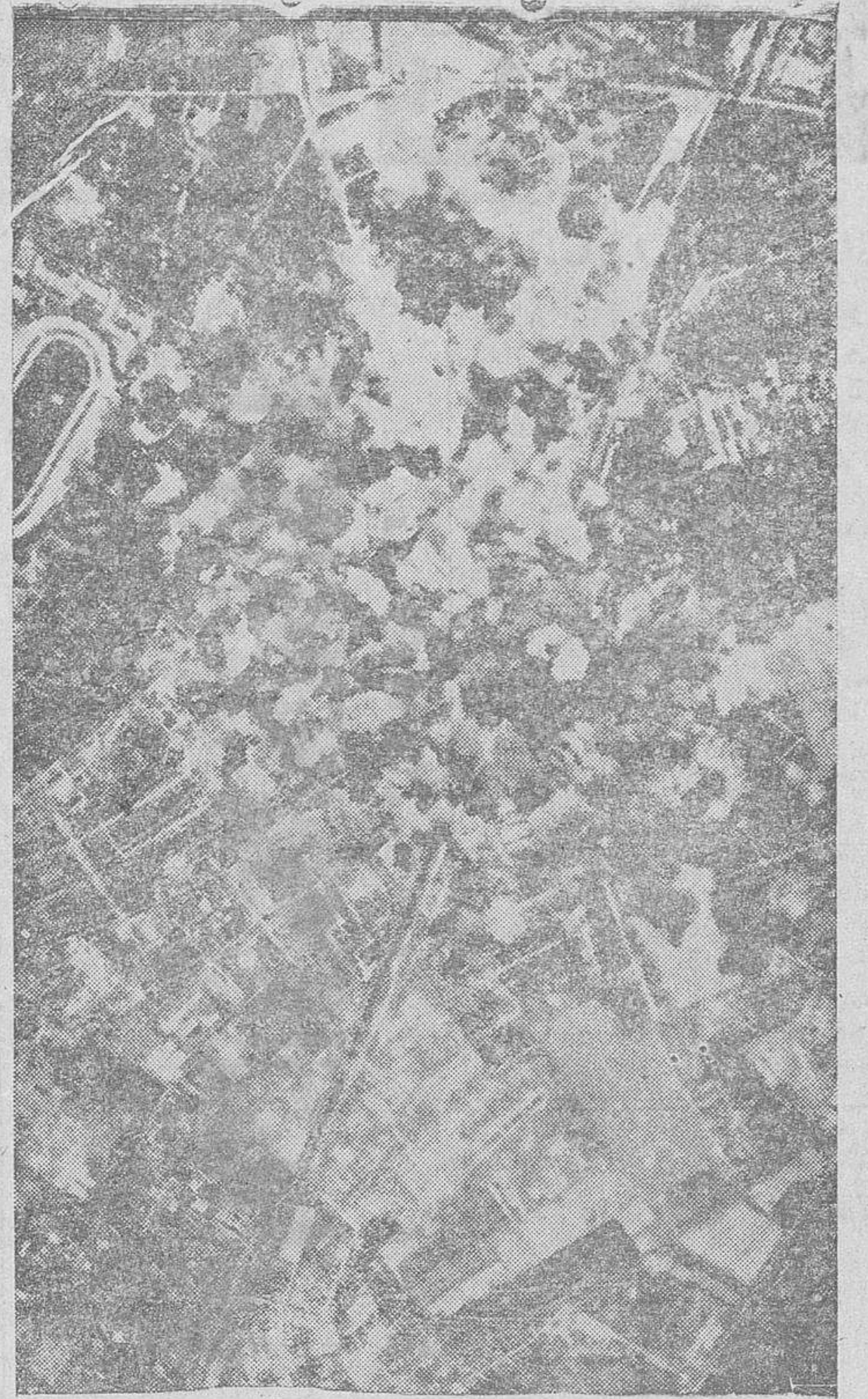
El área industrial de la capital del Reich, durante uno de los últimos bombardeos de la aviación aliada