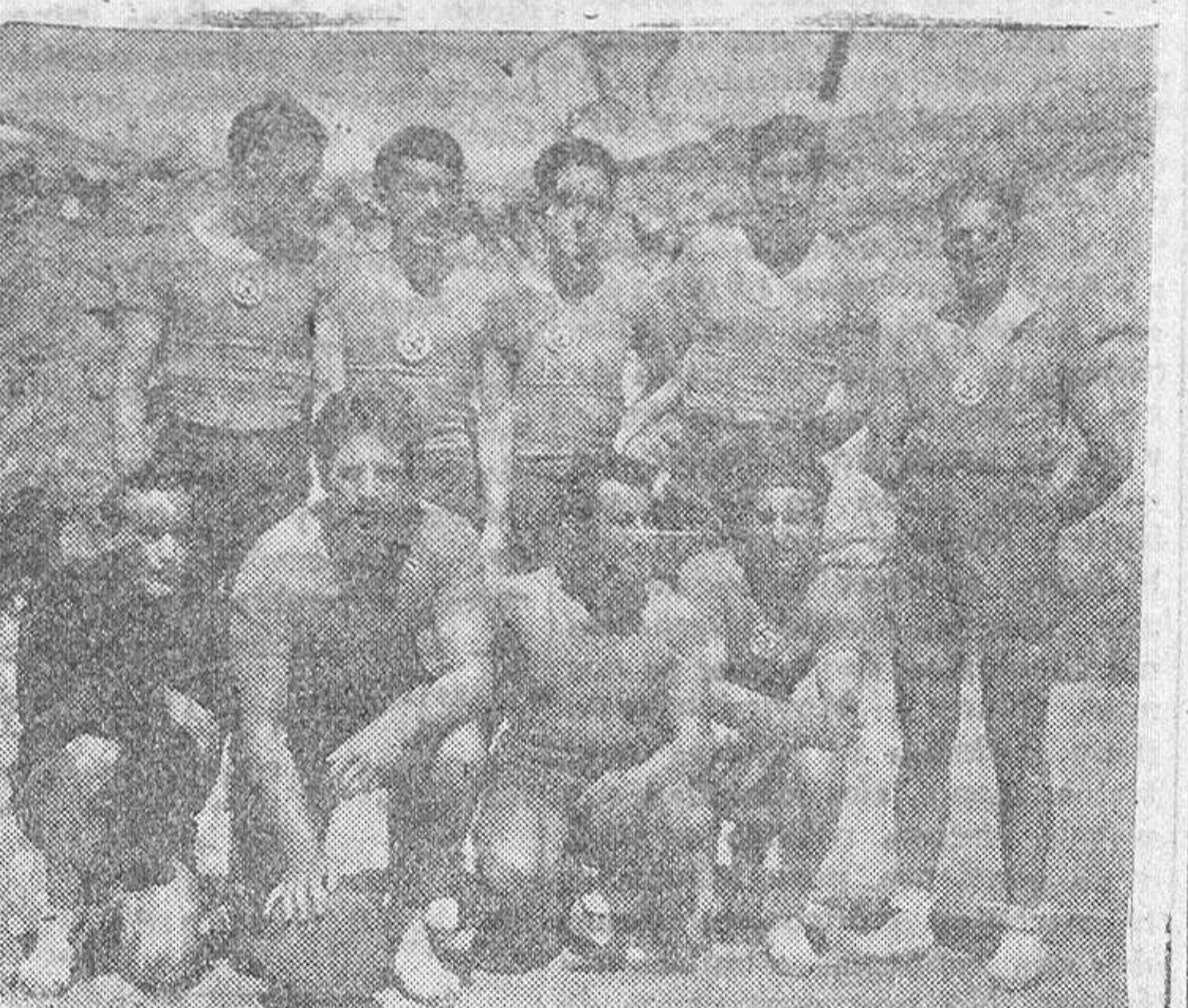
Equipo de "El Adelanto"