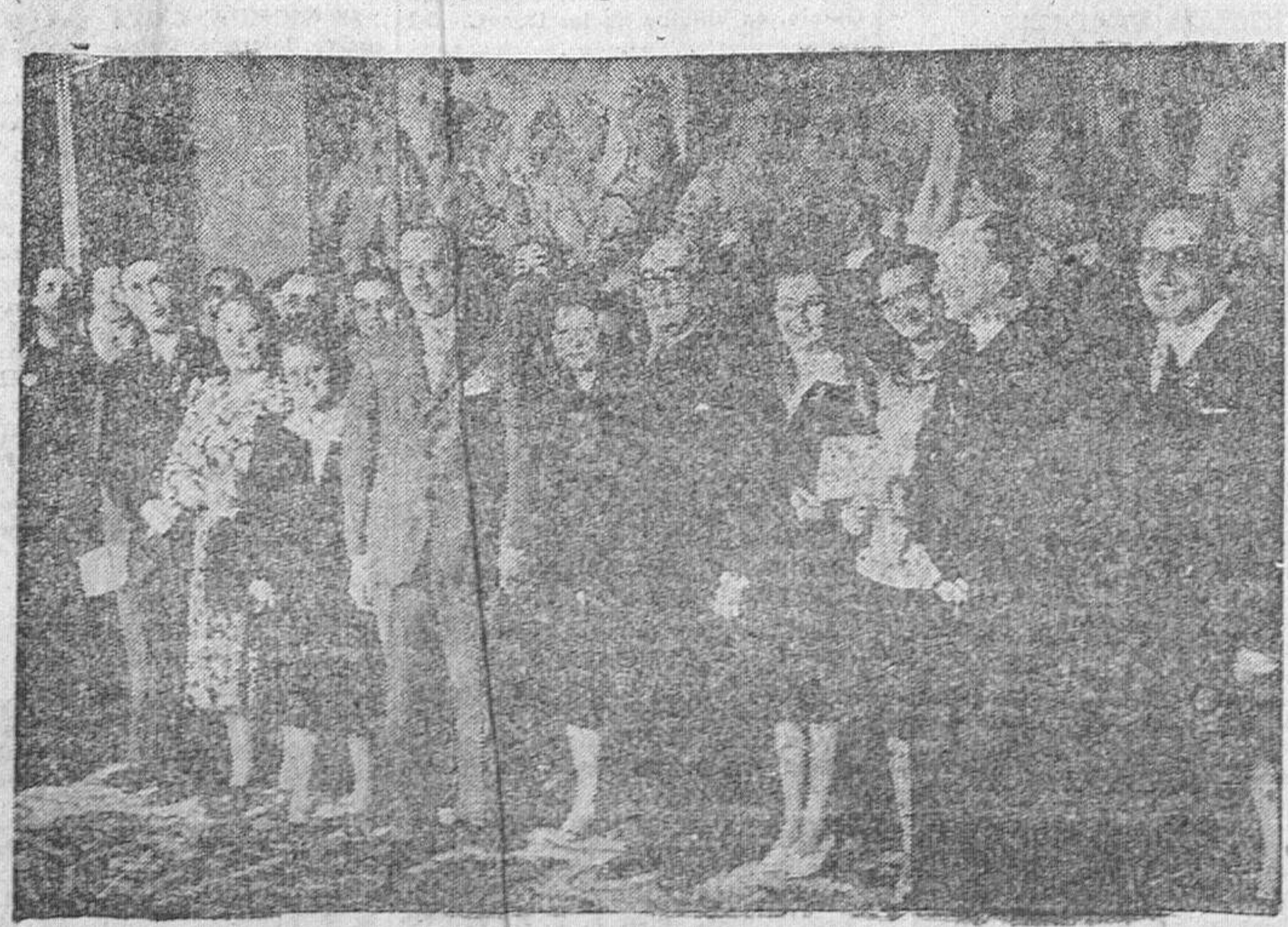
Un grupo de alumnos del Colegio Español de Oporto, que actualmente visitan España, fueron recibidos en el Palacio de Santa Cruz, por el señor subsecretario del Ministerio de Asuntos Exteriores, que les dió la bienvenida en nombre del ministro (Ortiz, Foto).