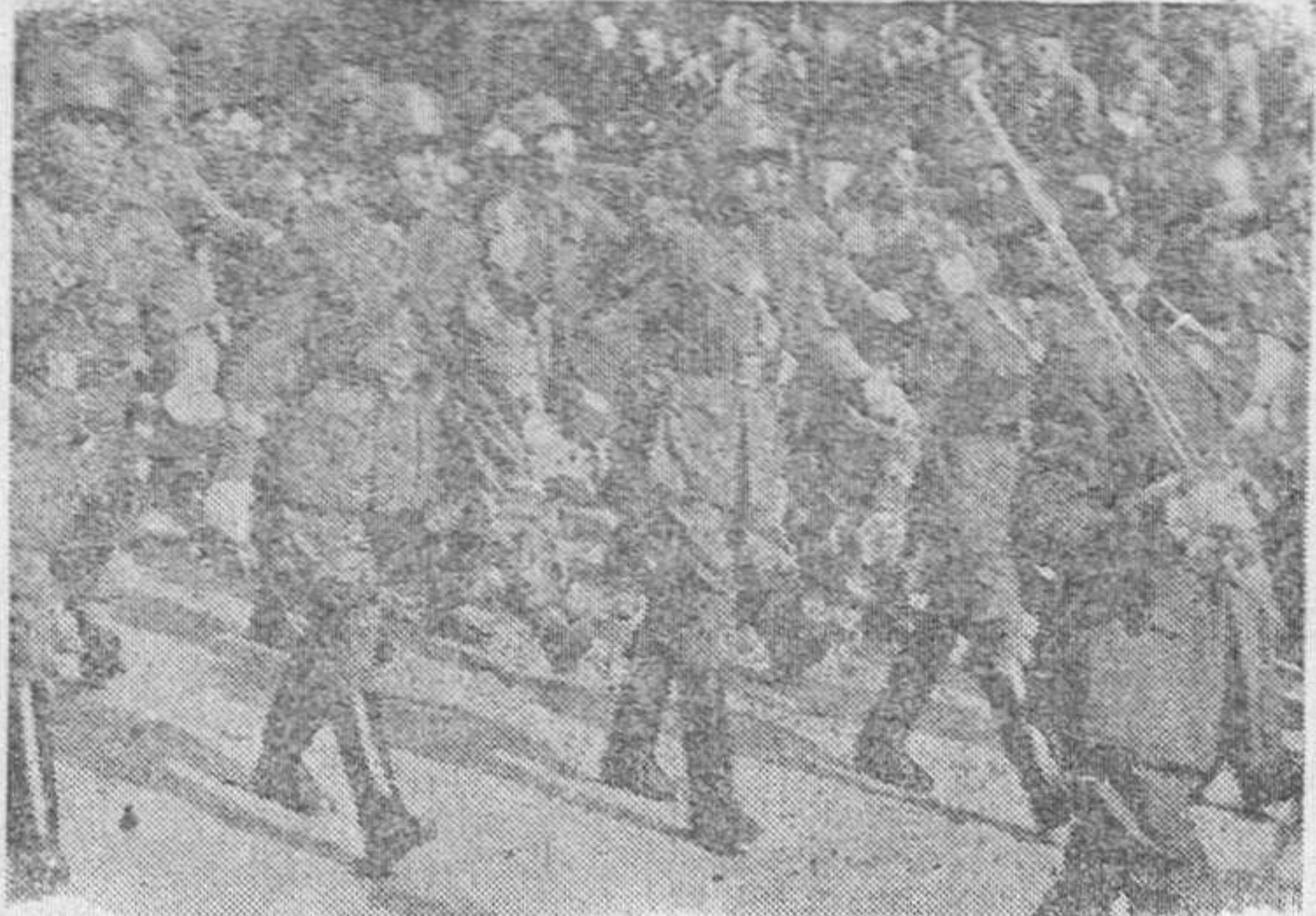
Un momento del desfile de las fuerzas del Regimiento de Ingenieros ante la tribuna de las autoridades.