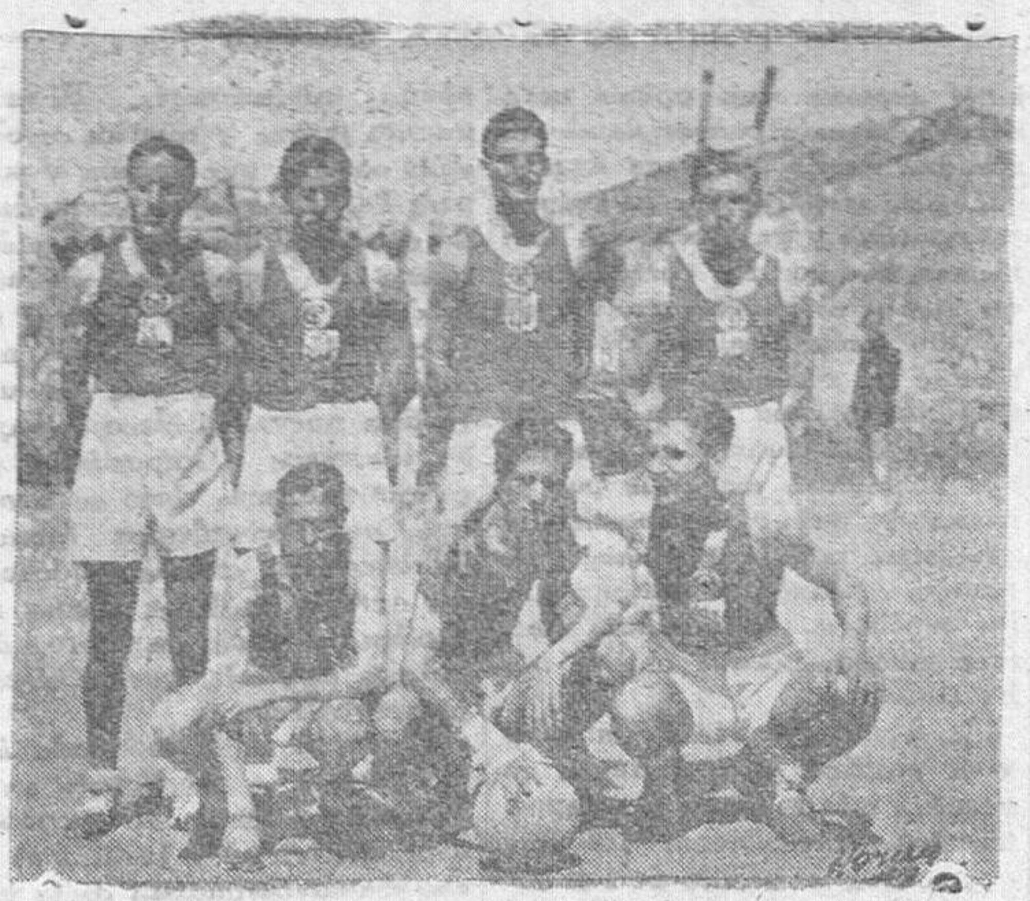
Equipo de la Sociedad Gallega de Electricidad