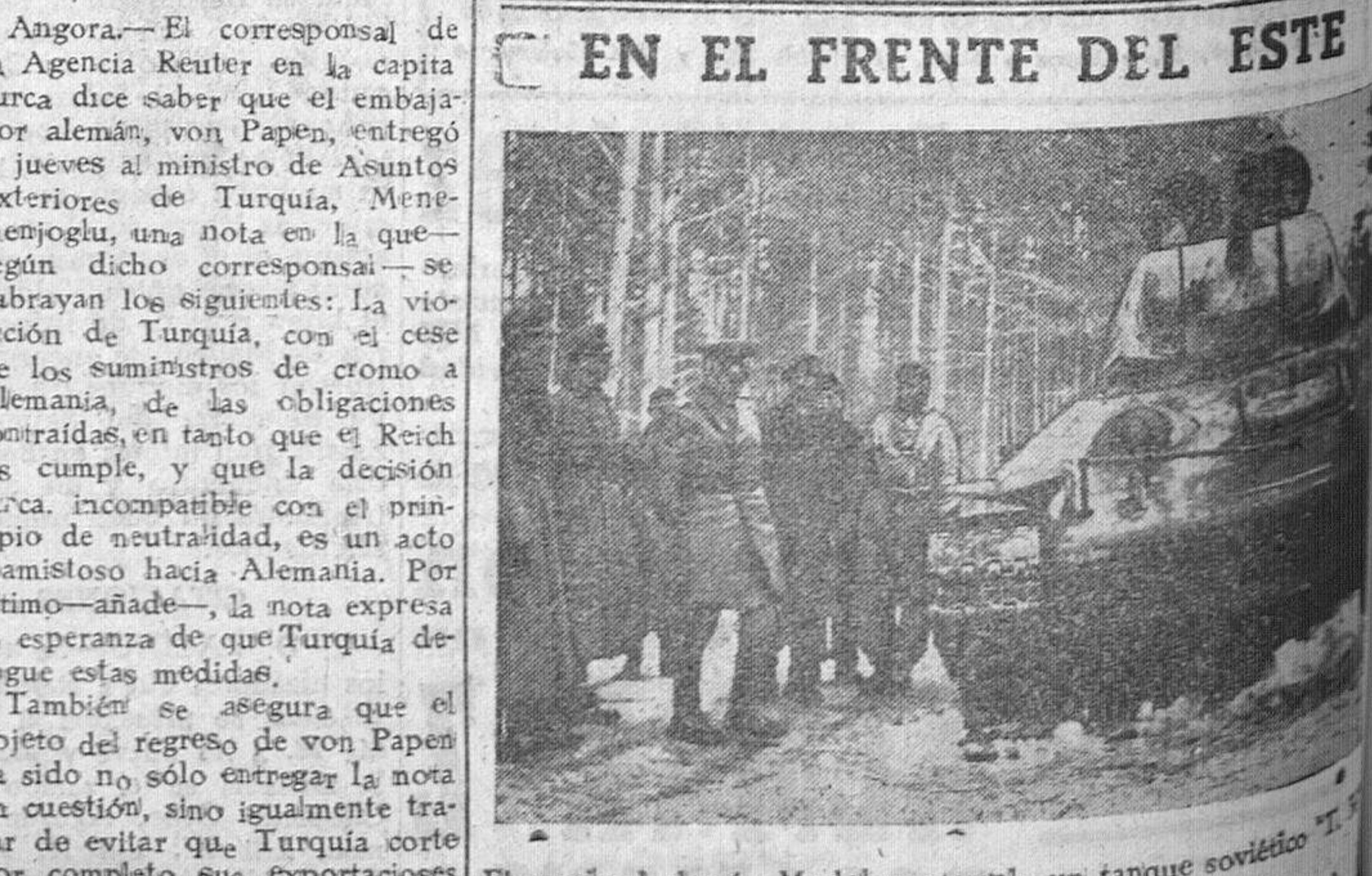
El mariscal alemán Model contemplaba un tanque soviético inutilizado.