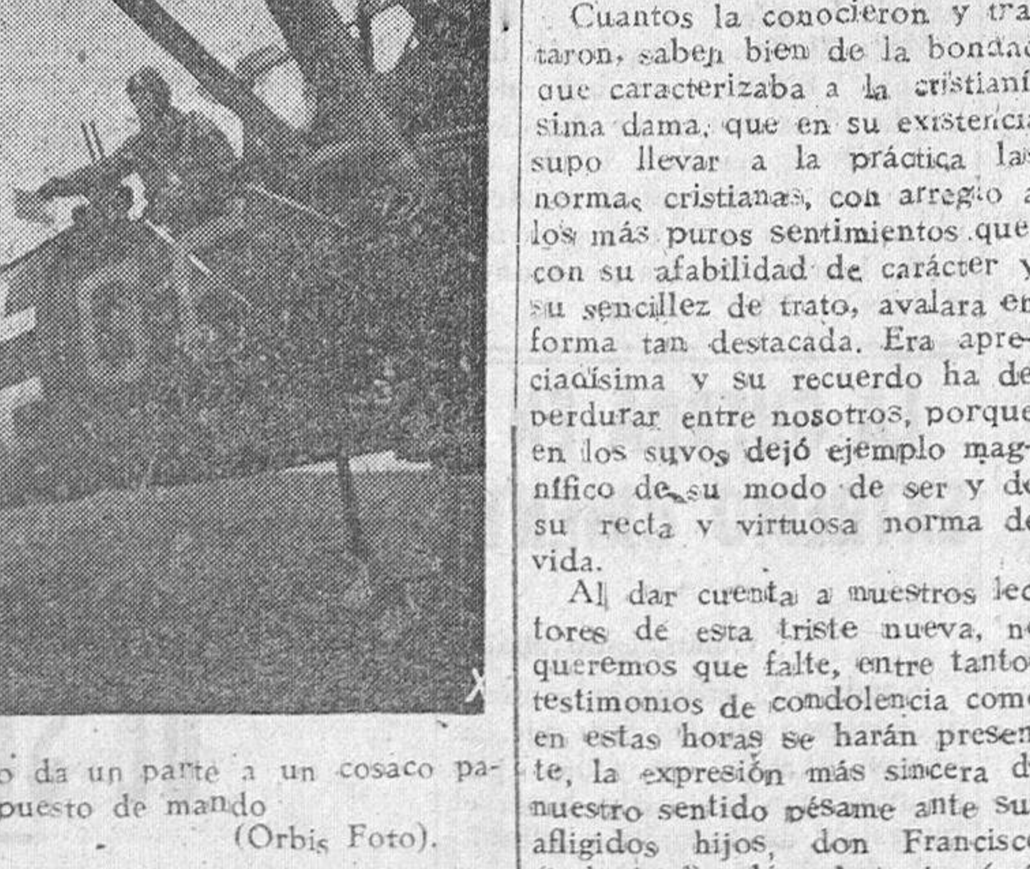
Desde un avión alemán, el piloto da un parte a un cosaco para que lo lleve al puesto de mando.