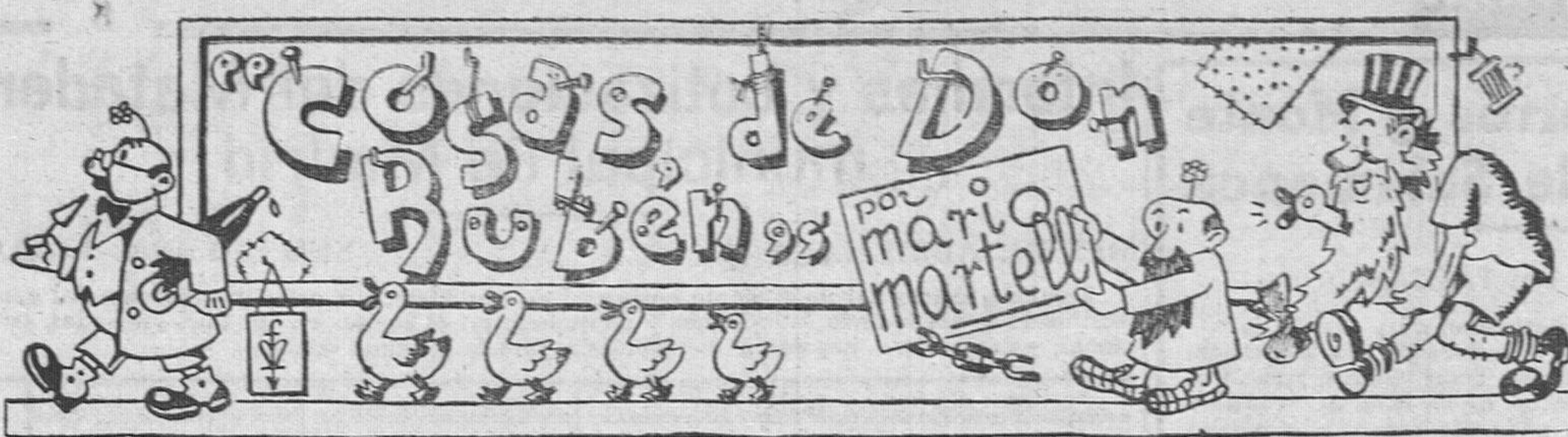
Si algún parecido existe con personas o hechos del pasado, presente o futuro, es solamente debido a la casualidad.

Se celebró ayer, con gran animación, la fiesta de la Feria del Libro. En todas las librerías de la ciudad se hicieron exposiciones de libros verdaderamente extraordinarias y se vendieron éstos con un 10 por 100 de descuento. Más que por esta ventaja, por la extraordinaria exposición, el público respondió al carácter de la fiesta, visitando en cantidad singular los establecimientos y los puestos instalados al aire libre.