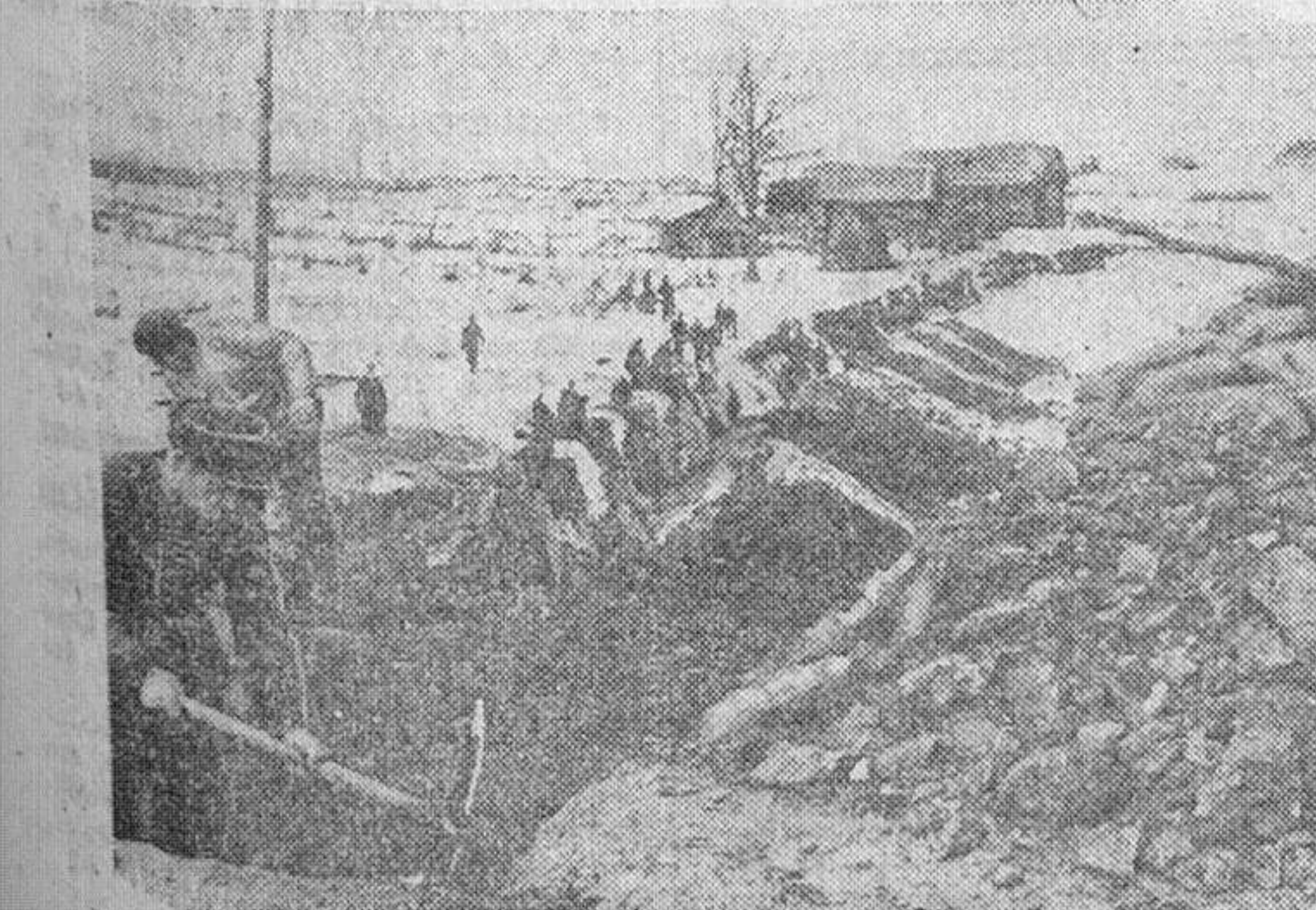
Zapadores alemanes especializados en fortificaciones, construyendo barreras antitanques en el frente ruso