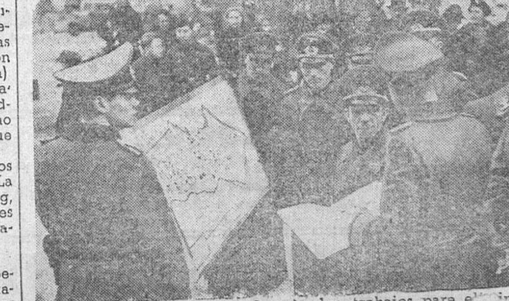
El ministro del Reich examinando los trabajos para los peligros de la aviación, conferencia después con los jefes y oficiales de la guarnición de la capital.