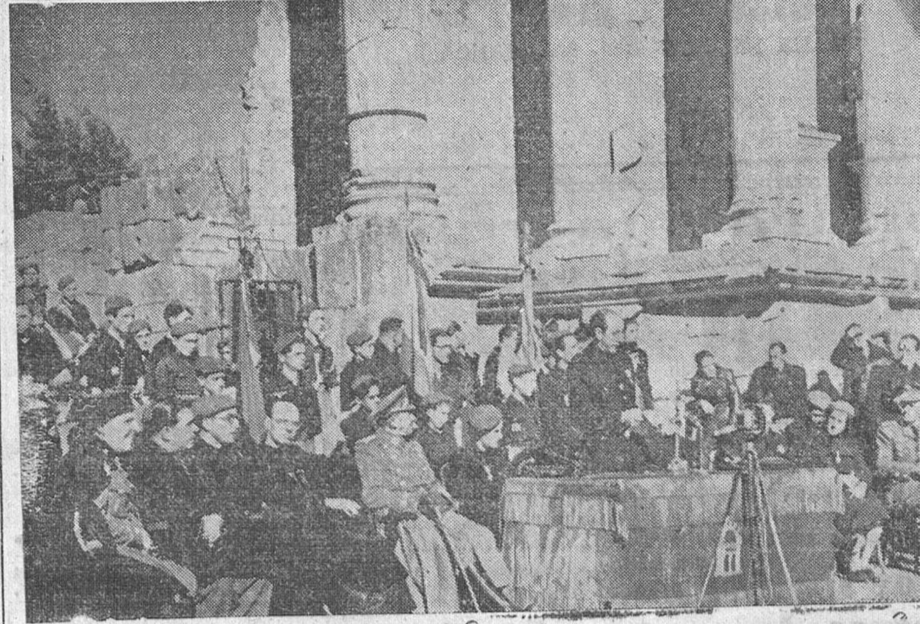
La presidencia del solemne acto de clausura del Consejo Nacional de la Sección Femenina. El vicepresidente general del Movimiento, camarada Mora Figueroa, pronunciando su discurso. (Foto Orbis-Vallmitjana).