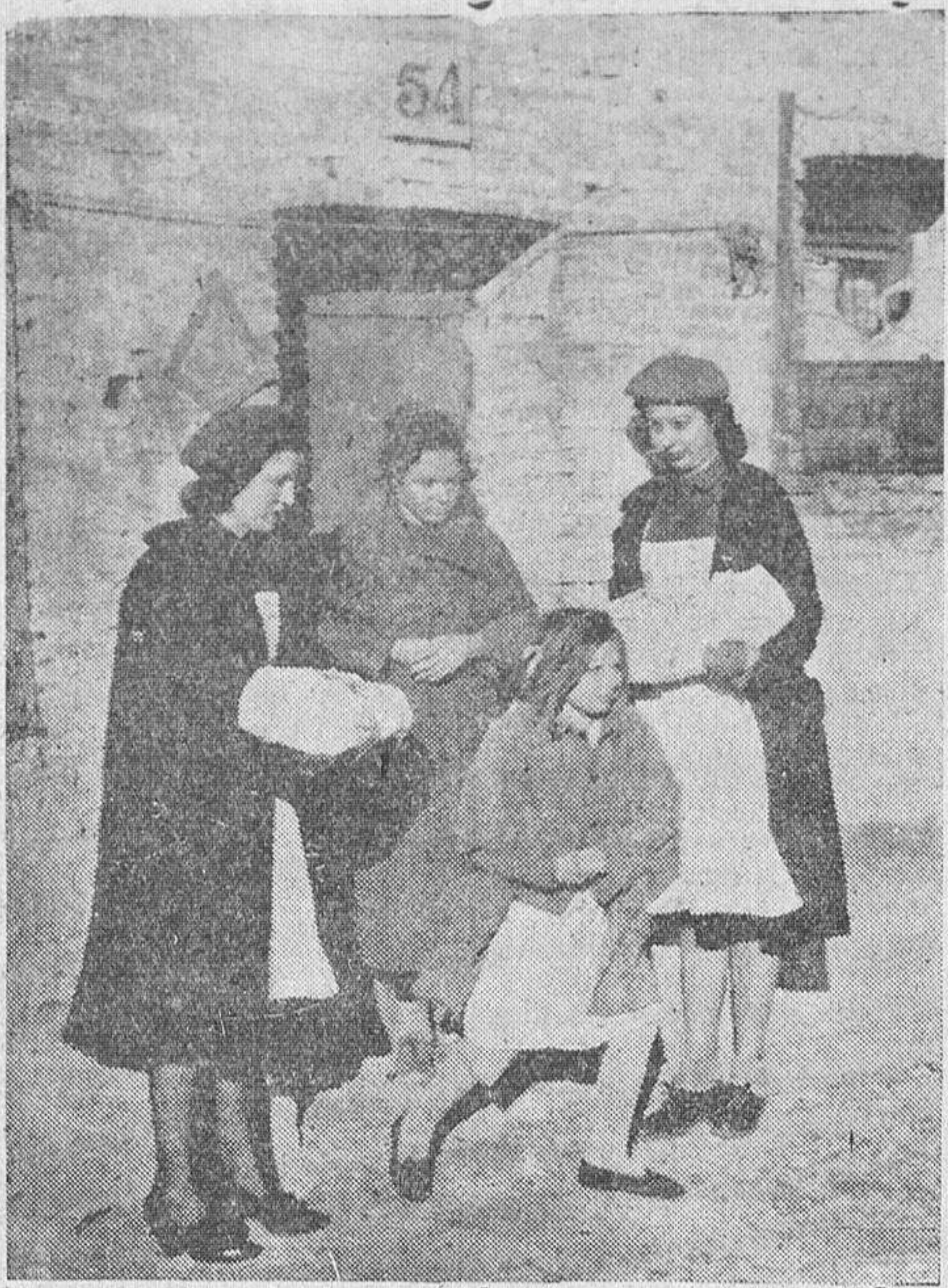
Cumplidoras del Servicio Social prestan servicios de asistencia en los suburbios de Madrid

Se llama visitadoras a las cumplidoras del Servicio Social que van por los suburbios de las ciudades inquiriendo el estado sanitario de los hogares humildes, el número y estado de hijos, los medios de alimentación. Y divulgadoras son las que hacen este mismo menester en los pueblos, en los que, además, dan normas e instrucción a las familias menesterosas para vivir con cierta higiene y cuidar a los hijos. Pues a ambos nobles oficios se dedican no pocas muchachas en los seis meses de servicio. Es un servicio duro, nos dicen. Se les dan unas fichas que tienen que cubrir con datos de las distintas familias que visitan; deben hacer dos o tres fichas diarias y esto supone dos o tres visitas a ho-