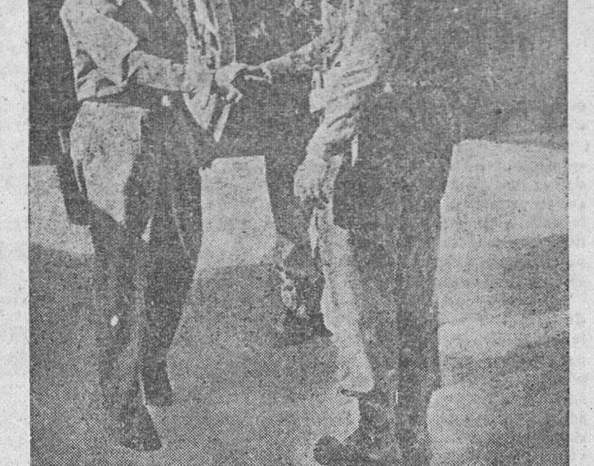
El teniente general Mark Clark recibe en el aeródromo de Capodocchino al general Eisenhower. Los dos jefes americanos conferenciaron recientemente sobre la marcha de las operaciones en Italia con otros altos jefes ingleses.

ESPAÑOLI Otro motivo más de enorgullecimiento para tí ha de ser la legislación española de Subsidios Familiares. Comprende, en su protección, toda la vida de la familia. No incumplas sus obligaciones.