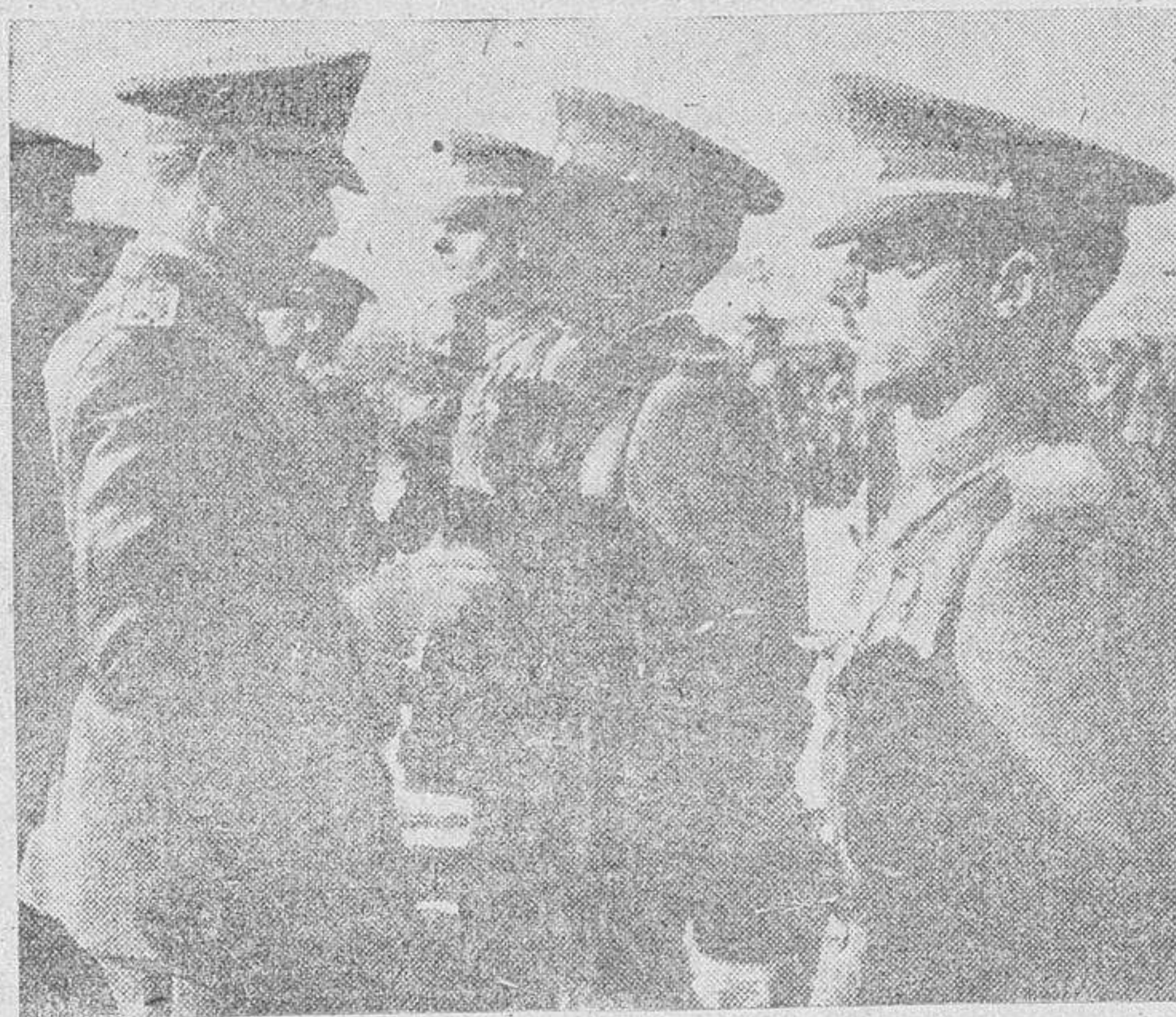
El ministro del Ejército imponiendo la Cruz de la Orden del Mérito Militar a los sargentos de las Escuelas de Transformación...