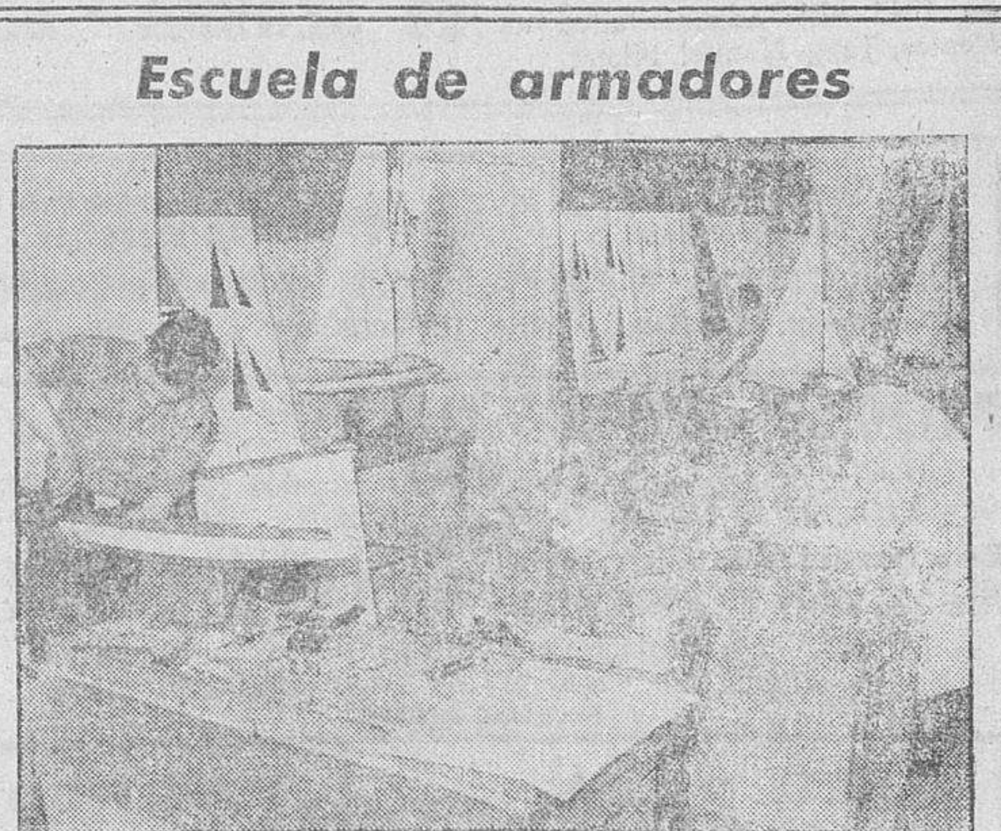
He aquí una clase de construcción de maquetas en una escuela de armadores del ejército del Reich.

Escuela de armadores. He aquí una clase de construcción de maquetas en una escuela de armadores del ejército del Reich.