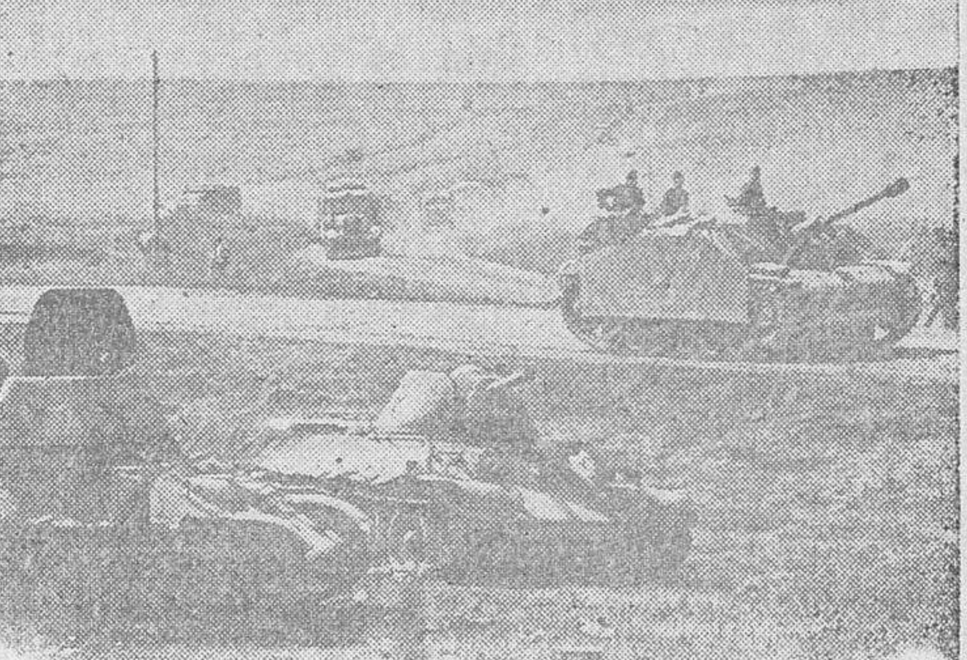
Tanques y elementos motorizados, dirigiéndose a las primeras líneas del frente ruso