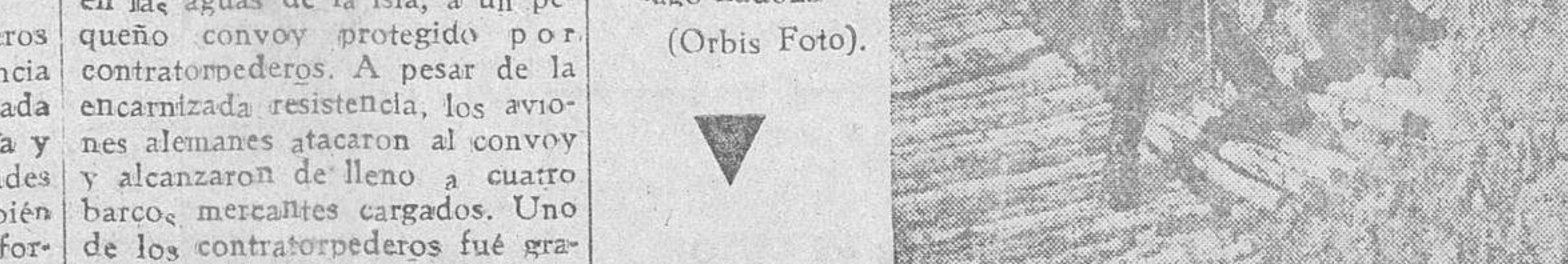
El general alemán Lindemann, salió de conversar con el jefe de un puesto de mando, en el frente del lago Ladoza.