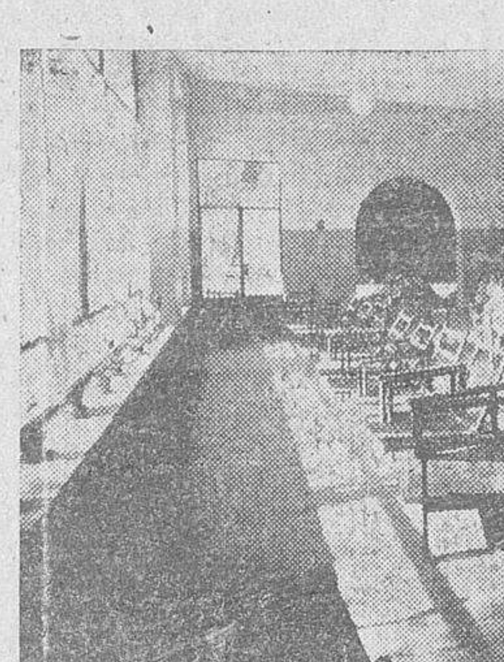
Escuela y lugar de reposo del "Jardín Maternal" salmantino.

Realizada la visita por la enfermera y reconocido el niño o niña por el médico, y aprobado el ingreso por reunir las condiciones, exigidas, que son bien