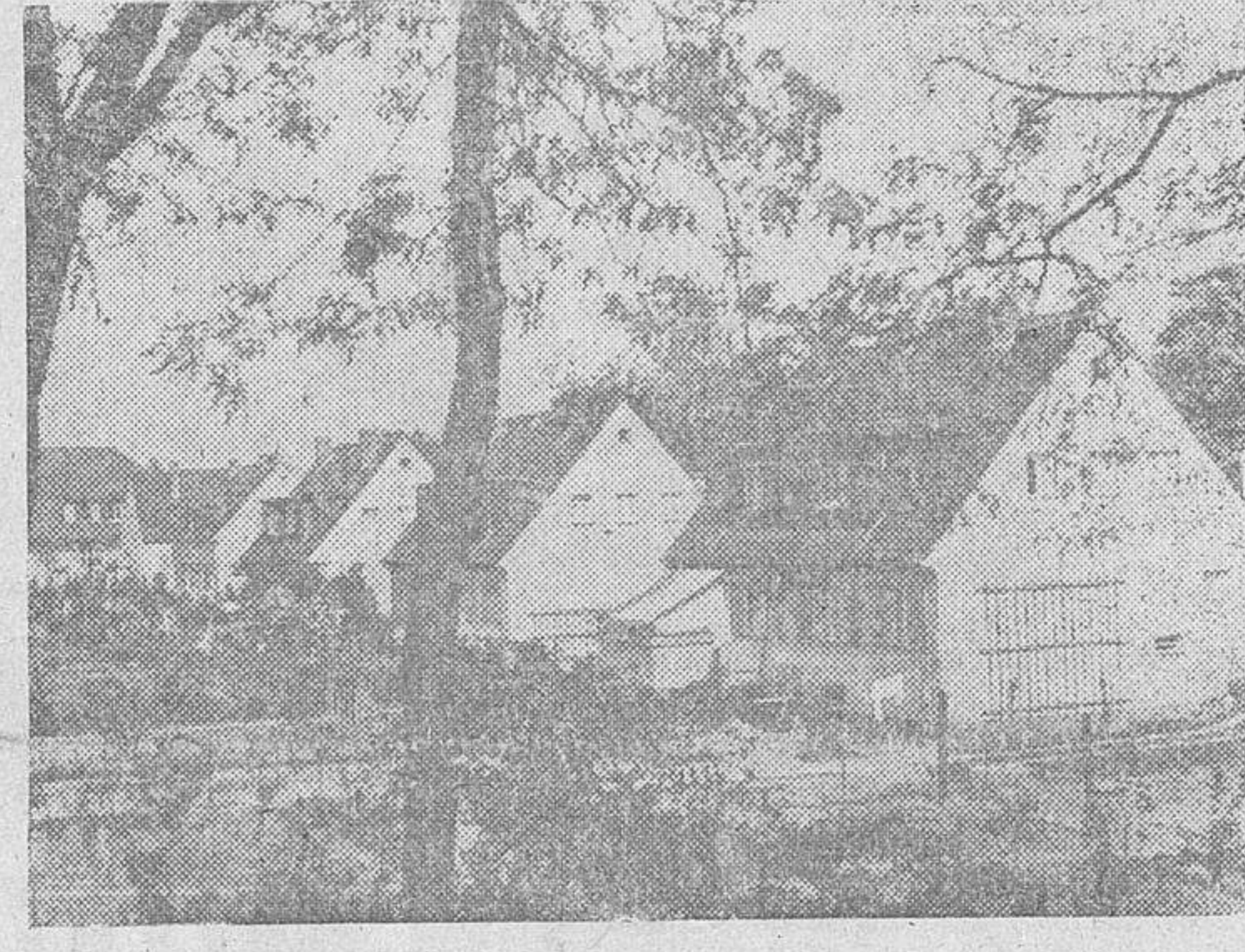
He aquí el tipo de vivienda para obreros generalizado en Alemania