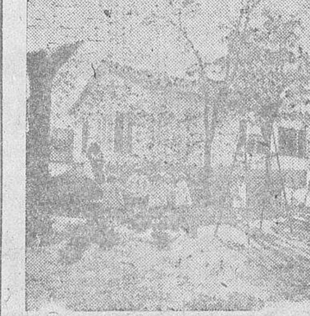
Exterior del "Jardín Maternal" de Auxilio Social, construido en la Alameda, y que en breve será inaugurado oficialmente.

Para el ingreso en el Jardín Maternal, es condición impres-