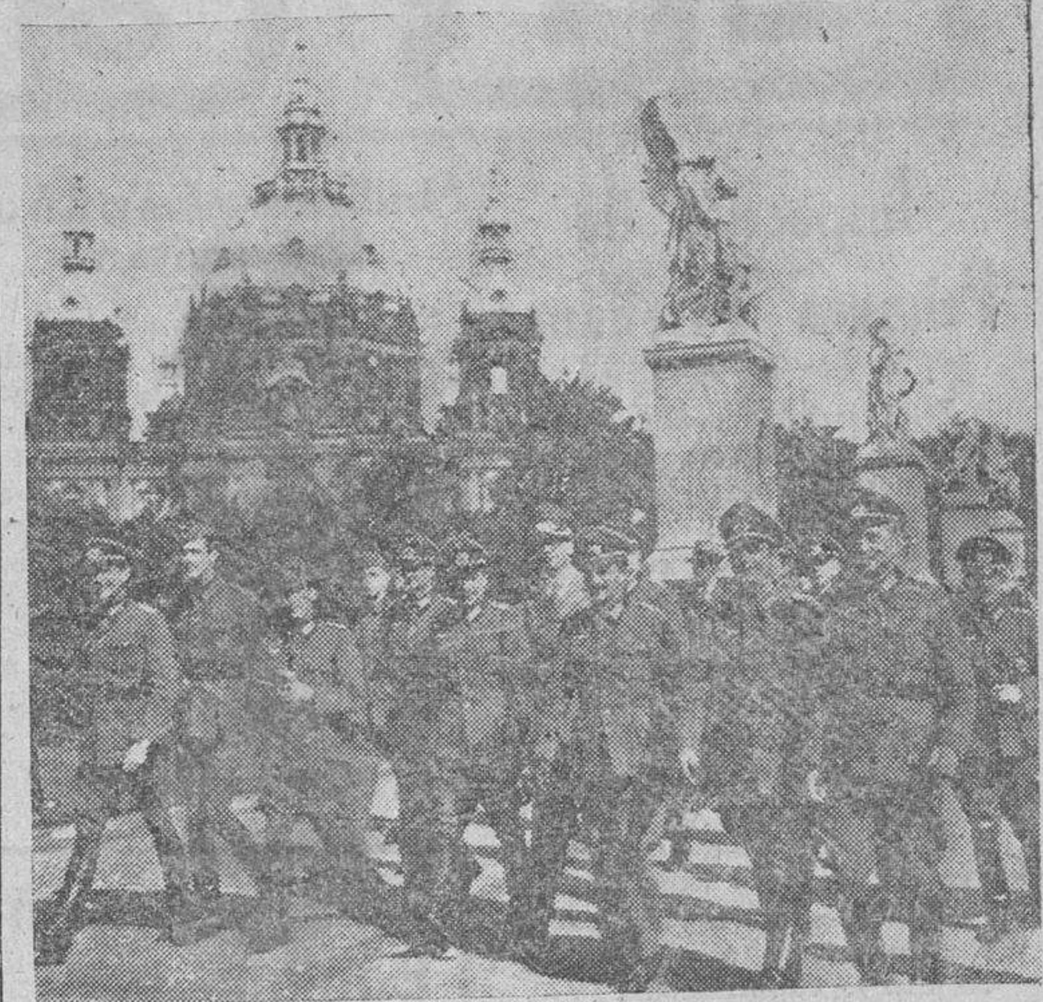
Oficiales de la División Azul, en disfrute de permiso por sus méritos, recorren las calles berlinesas en alegre camaradería, visitando los monumentos de la capital

ADMINISTRACION: TELEFONO 1018 RUA MAYOR, 13.- APARTADO 10