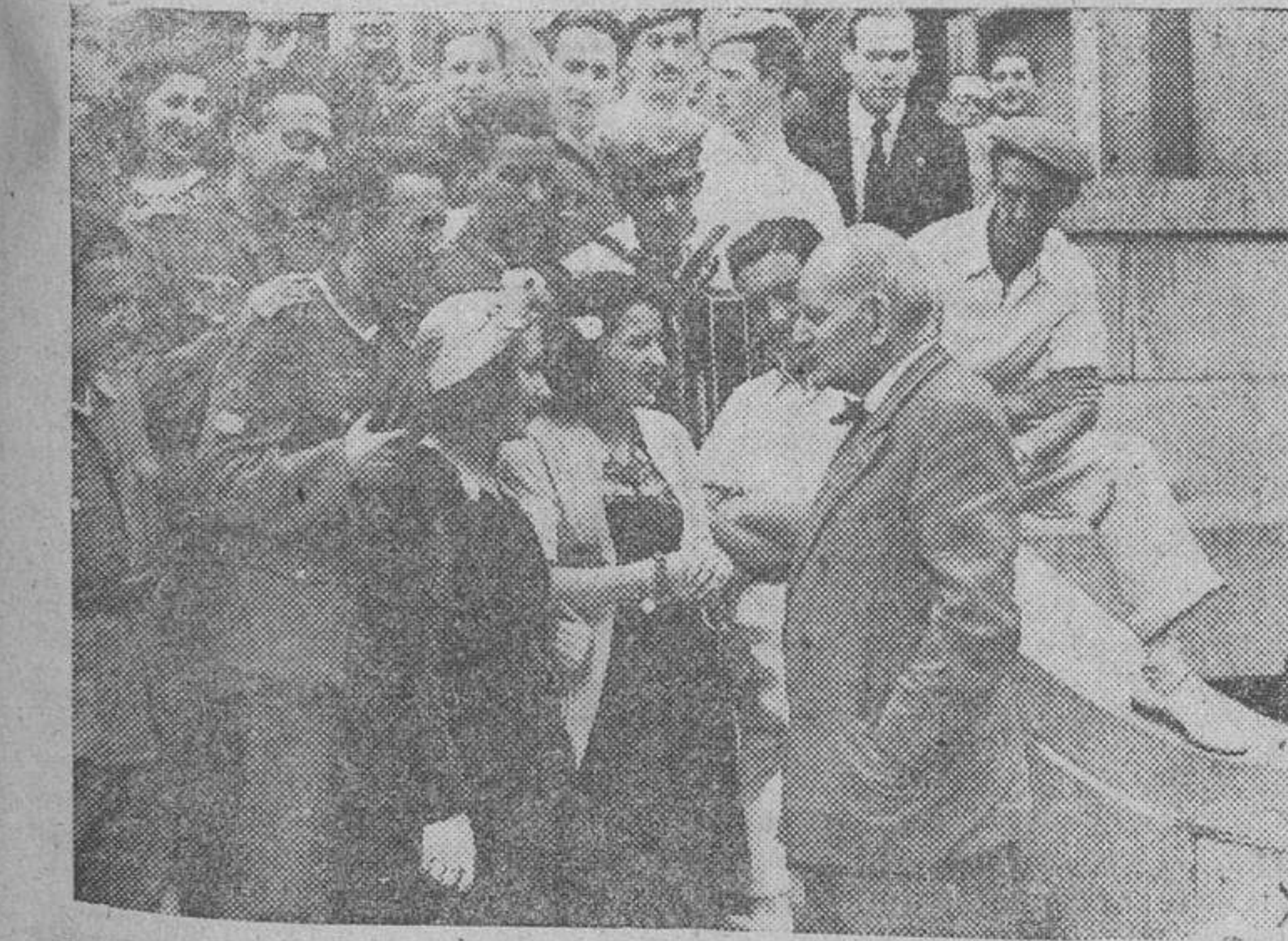
A la fiesta que Von Faupel, presidente del Institut. Ibero-Americano en Berlín, dió en honor de un grupo de heridos de la División Azul, asistieron también algunos artistas españoles que se encuentran en camino hacia el frente del Este. En la foto, Von Faupel, conversa con todos ellos