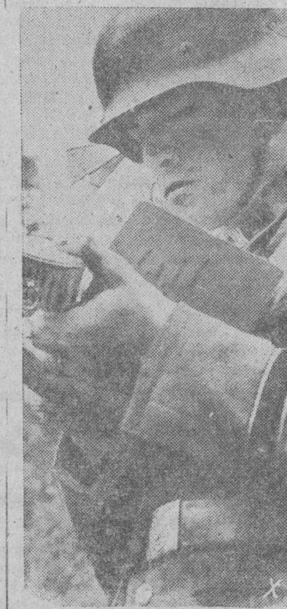
Antes de iniciar el ataque contra el enemigo, el jefe de una compañía de granaderos alemanos echa un último vistazo al anemómetro para comprobar el perfecto estado de la pieza