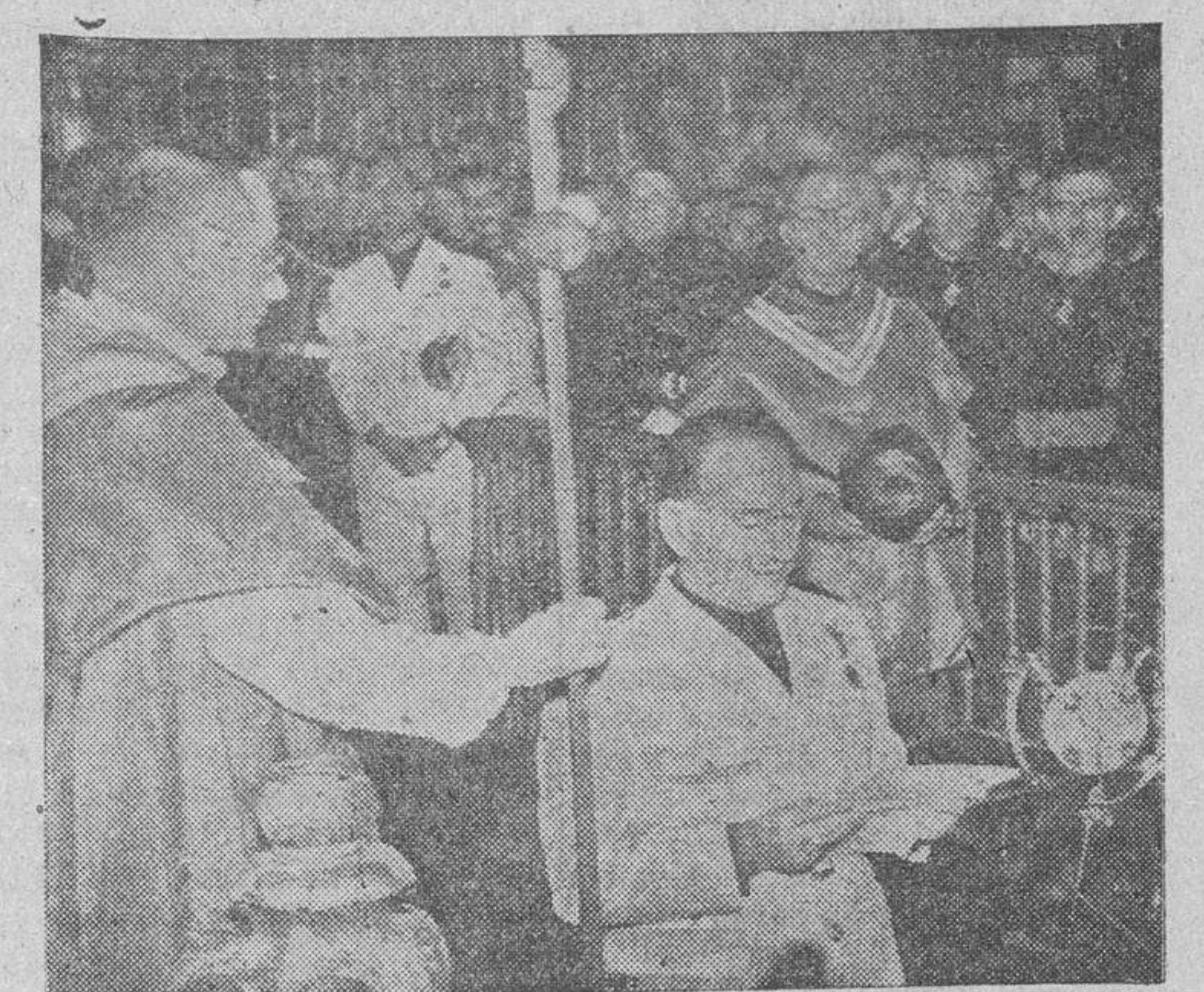
Su Excelencia el Jefe del Estado, dirigiéndose al templo con el bordón de peregrino, en unión del ministro secretario general del Partido y otras jerarquías, al frente de la peregrinación nacional de la Falange. — El señor Arrese ante la imagen del Apóstol haciendo la ofrenda