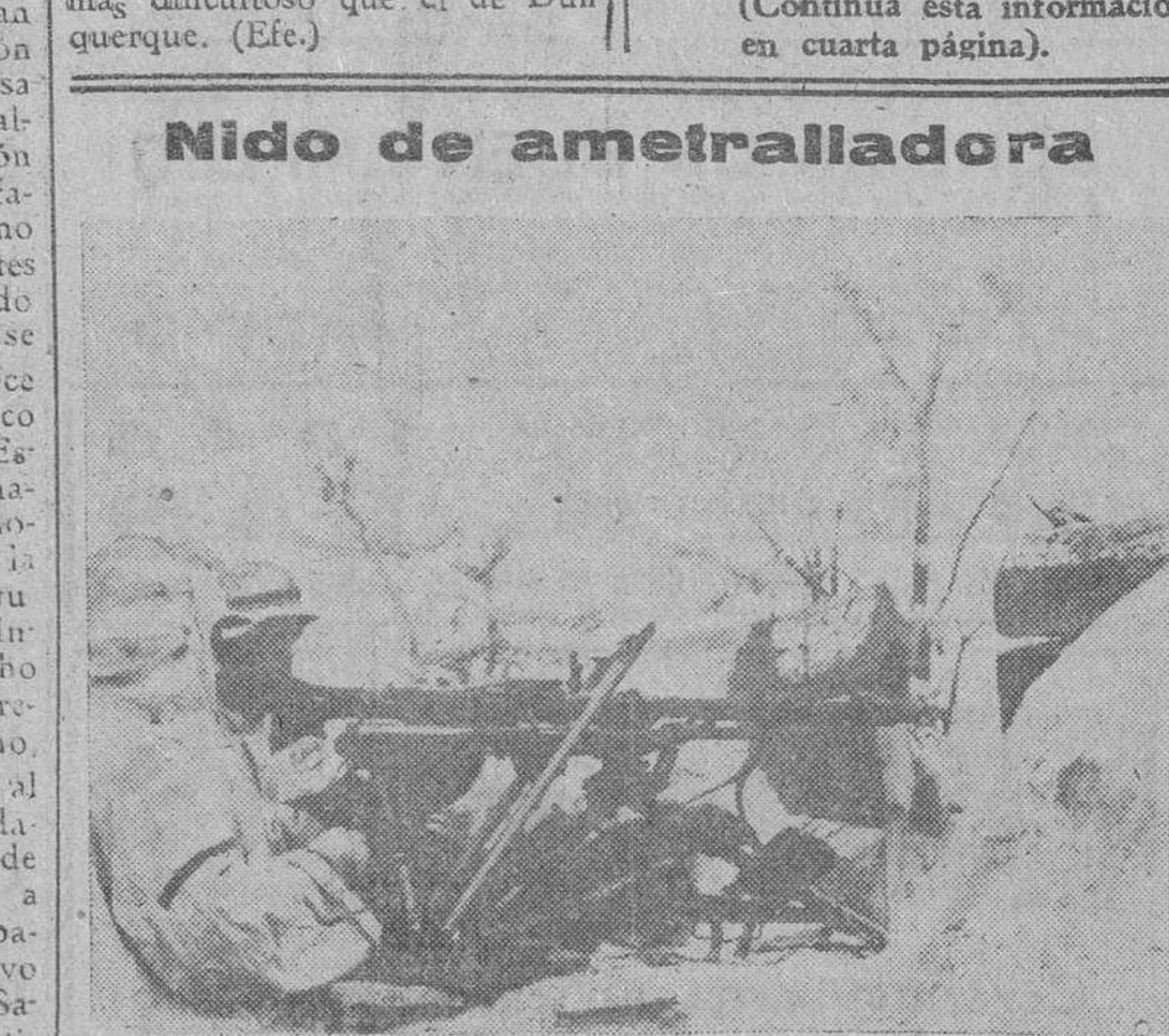
Puesto alemán de ametralladora, que asegura su posición en primera línea. Los soldados se hallan camuflados de blanco, para pasar desapercibidos en la nieve