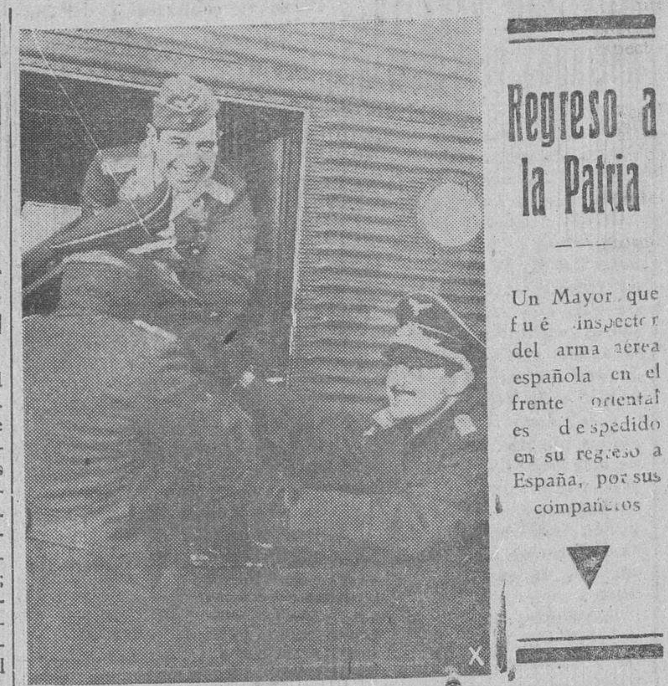
Un Mayor que fué inspector del arma aérea española en el frente oriental es despedido en su regreso a España, por sus compañeros

(Continúa esta información en cuarta página.)