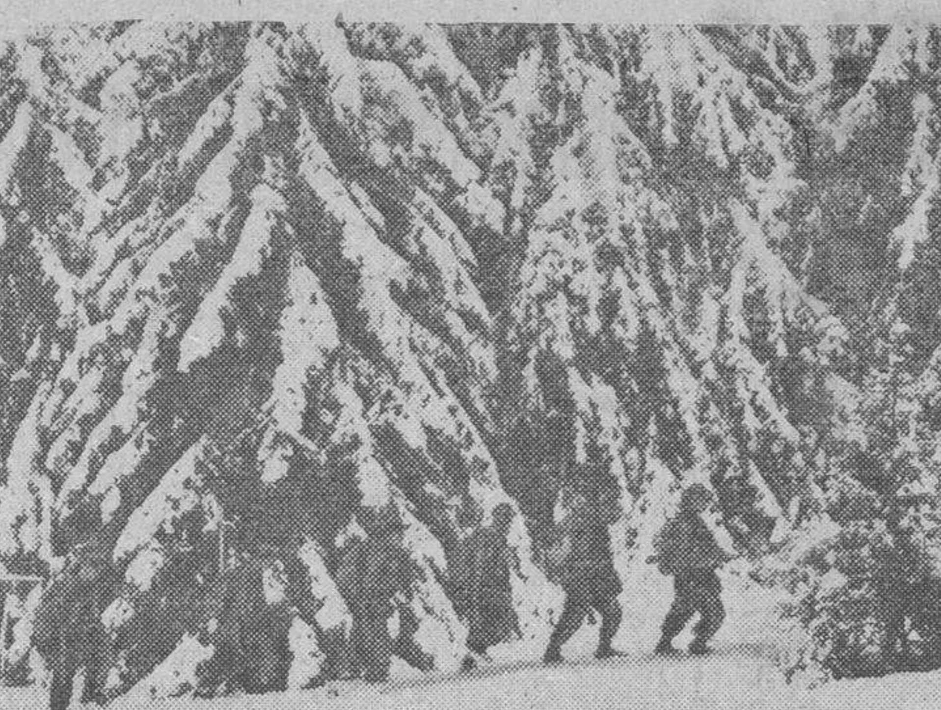
Un bello paisaje en las montañas soviéticas, cubiertos los bosques de nieve, por los que marchan las avanzadillas de las S. S.