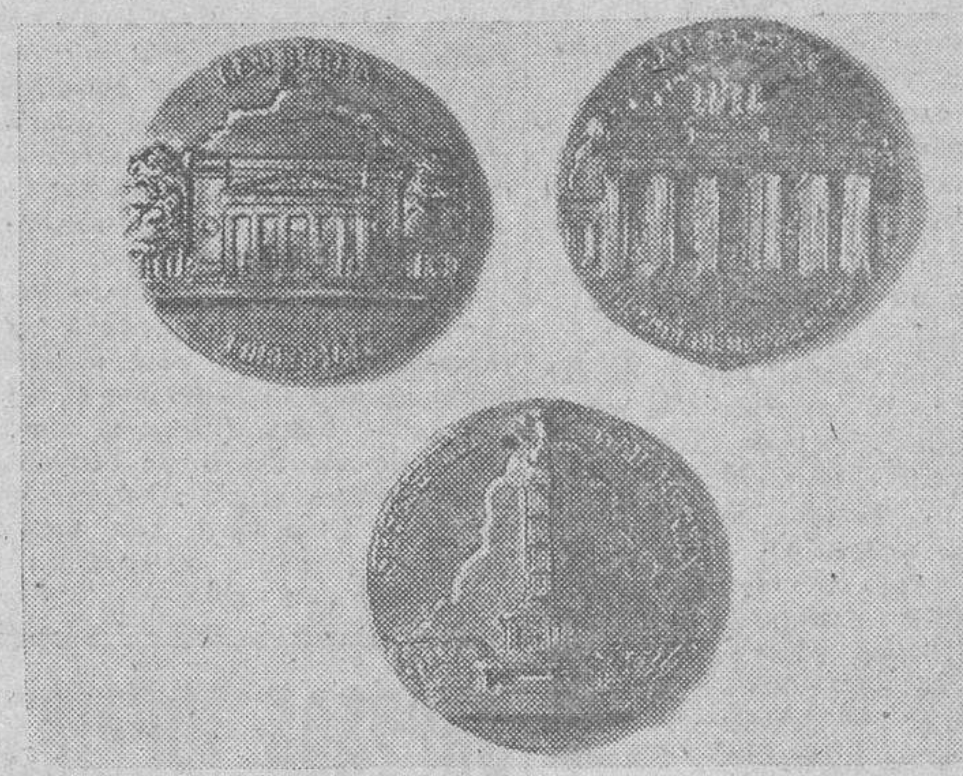
Recientemente han sido puestas a la venta en Alemania, estas Medallas, de color cobrizo, reproduciendo los más notables monumentos de Berlín