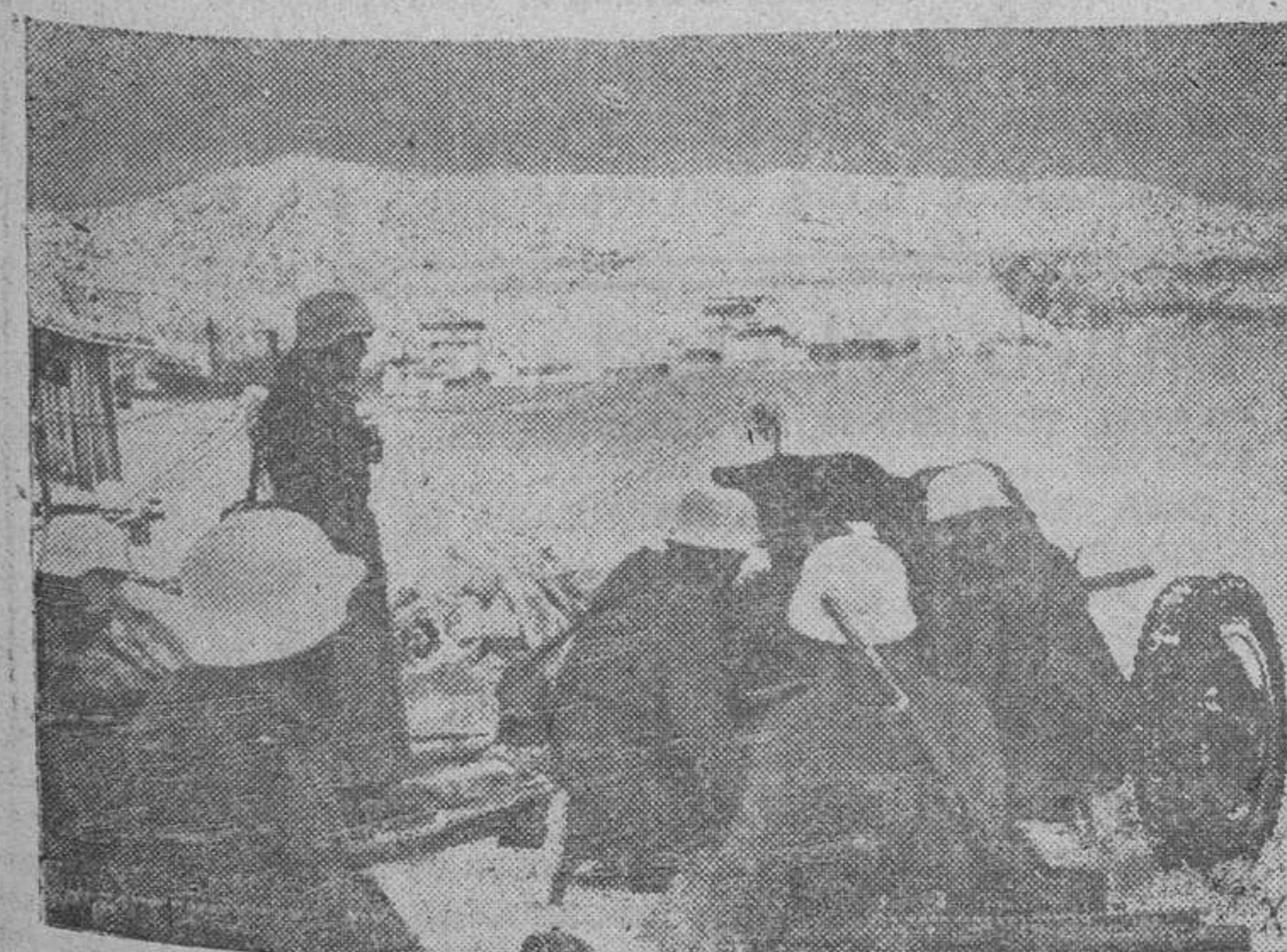
Desplazamiento de una pieza antitanque alemana, en un puerto del mar polar