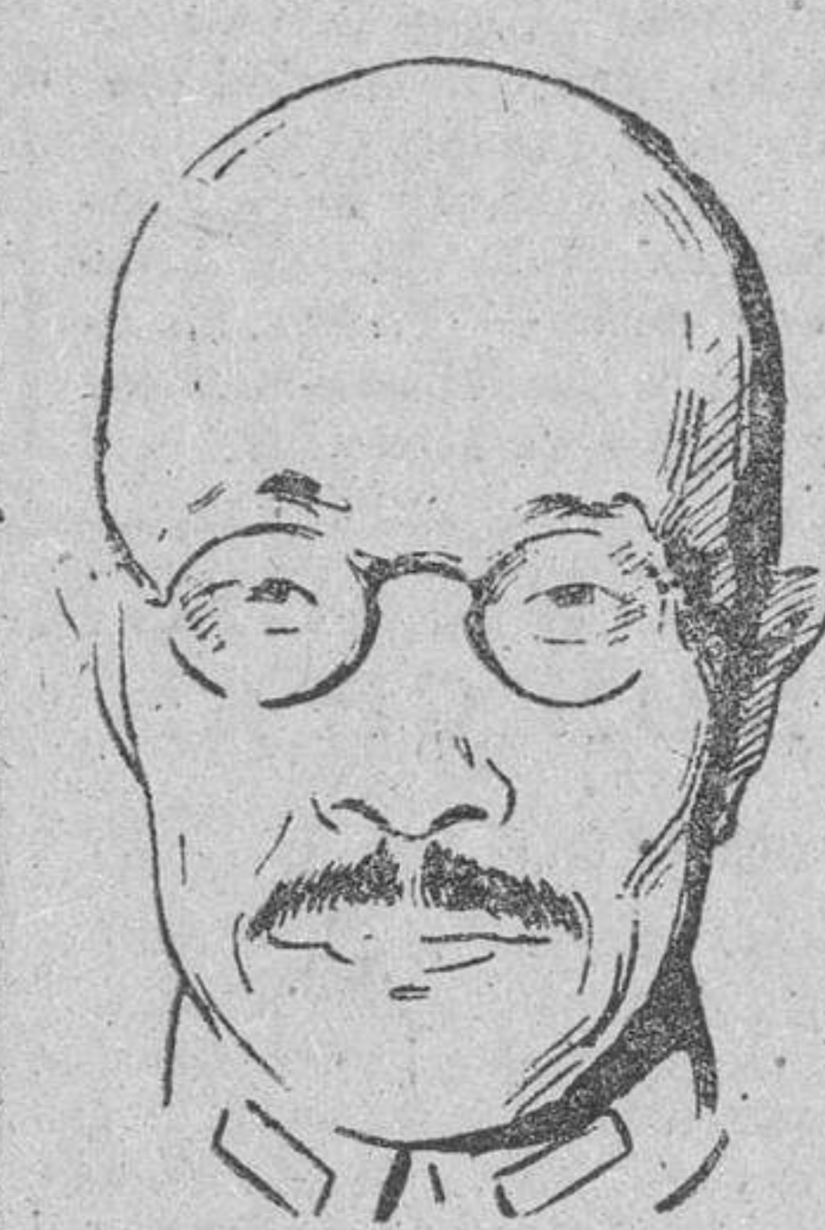
Mensaje de Tojo.

Los tres países marchan unidos hasta alcanzar los objetivos que se han propuesto