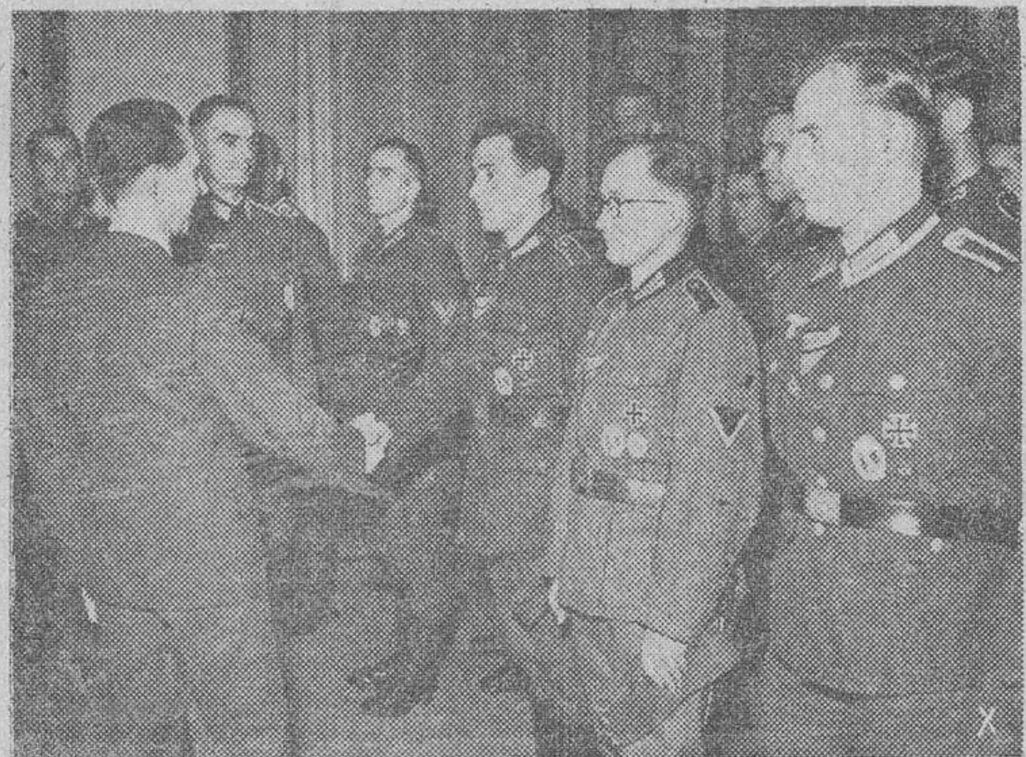
El ministro del Reich, doctor Goebbels, saluda a un grupo de oficiales que, procedentes del frente de Rjew, disfrutaron de un permiso en la capital de Alemania.