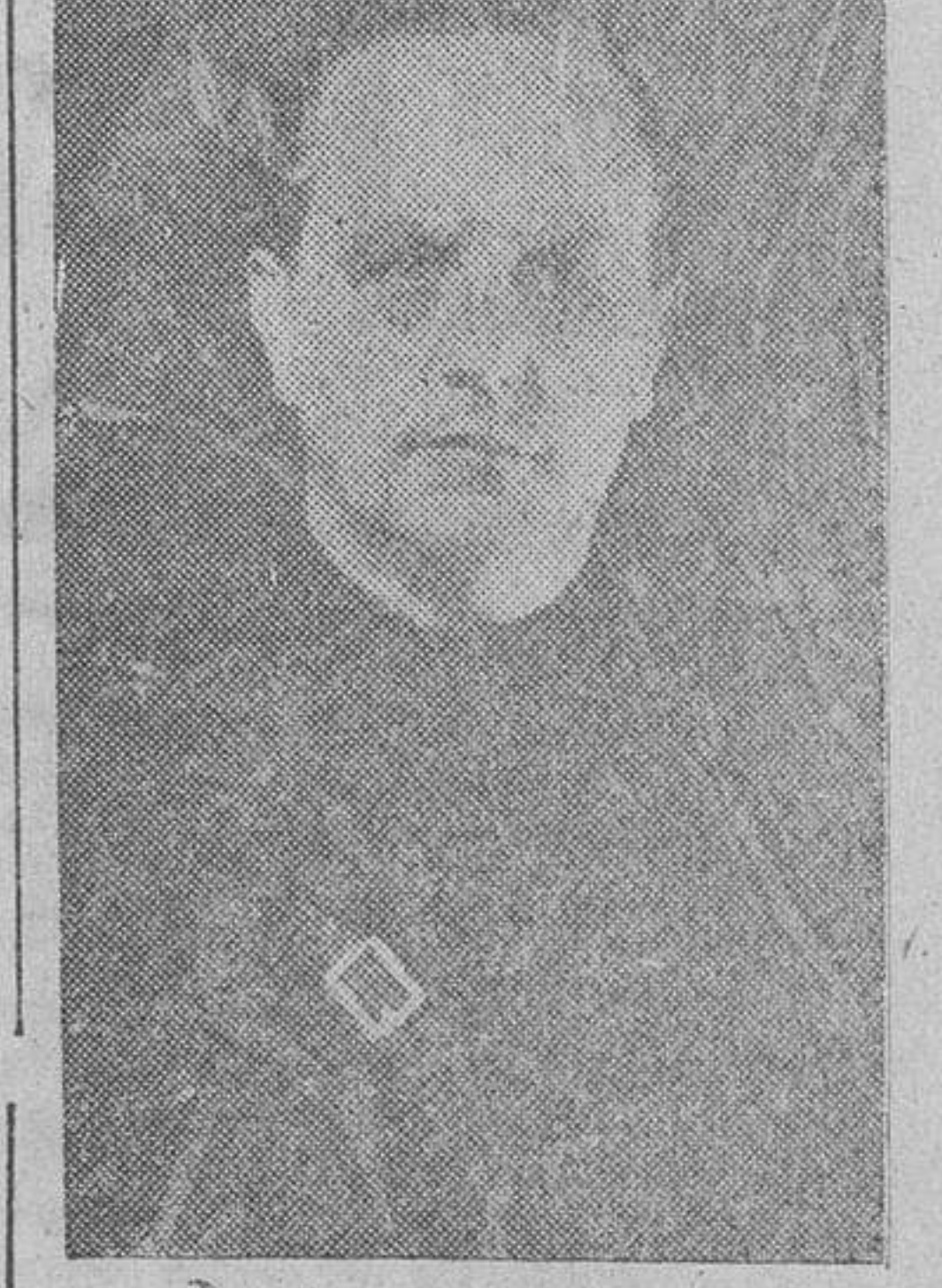
Don Raimundo Fernández Cuesta, nuevo embajador de España en el Quirinal.