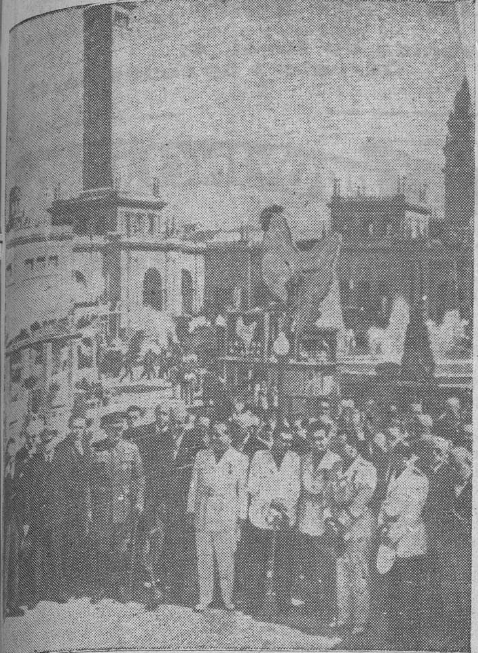
El ministro de Industria y Comercio y las demás autoridades en el momento de la bendición de la Feria de Muestras, de Barcelona