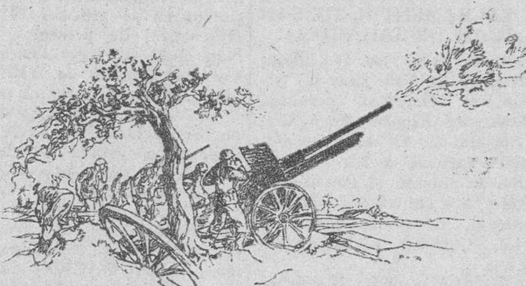
Del comunicado alemán del domingo

UN ATAQUE RUSO AL NORTE DE OREL, RECHAZADO CON GRANDES PERDIDAS