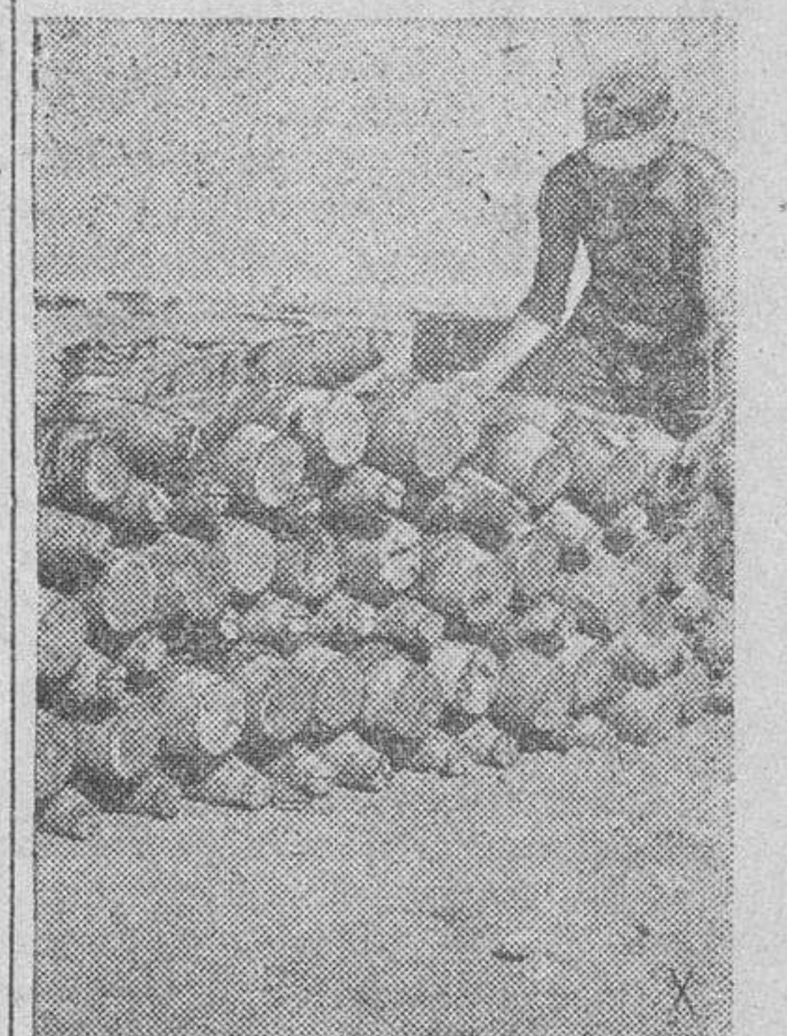
Granadas alemanas de artillería, en pleno desierto africano, dispuestas a servir las piezas del frente.

Berlín.—El mariscal Rommel parece emplear una nueva táctica en El Alamein, declaran los