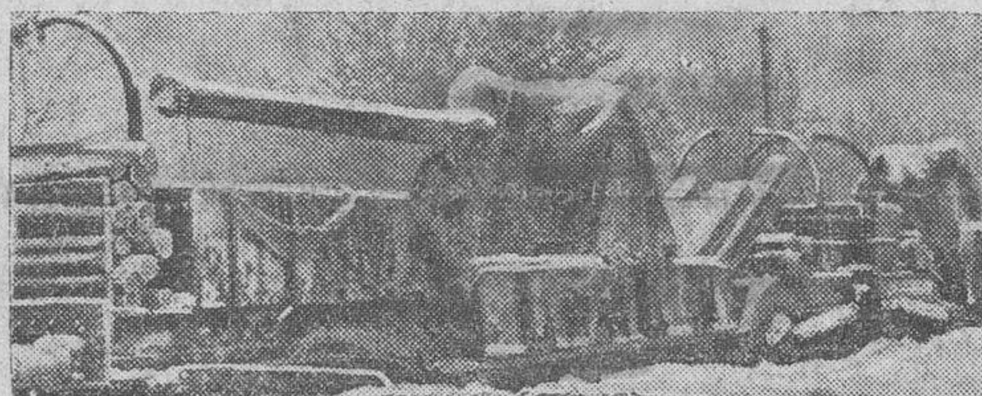
Una batería de largo alcance transportada por ferrocarril al lugar de su emplazamiento del frente ruso

Berlín.—En la ocupación de Sebastopol se produjo un hecho que tiene todos los caracteres de una catástrofe: Mil docenas mujeres y niños que habían sido llevados al fuerte Inkerman perecieron al ser volada esta obra