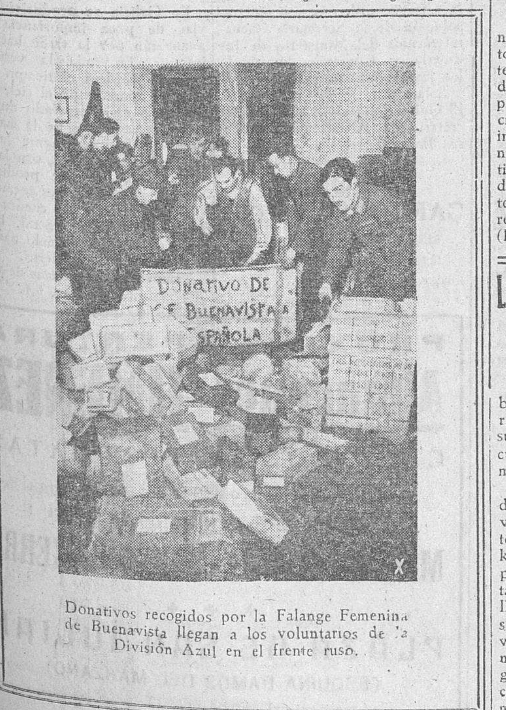
Donativos recogidos por la Falange Femenina de Buenavista llegan a los voluntarios de la División Azul en el frente ruso.

Roma.—Italia ha adoptado importantes medidas de orden económico para remediar una eventual inflación, ha declarado el ministro de Hacienda, Tahon Di Ravel, en los debates de la Comisión presupuestaria de la Cámara de los Fascios y Corporaciones. Añadió que se han suprimido todos los gastos que no tienen utilidad militar, habiendo aumentado, por otra parte, el ahorro privado, todo lo cual ha permitido una economía de unos 5.000 millones de liras en el transcurso del pasado año fiscal. (Efe.)