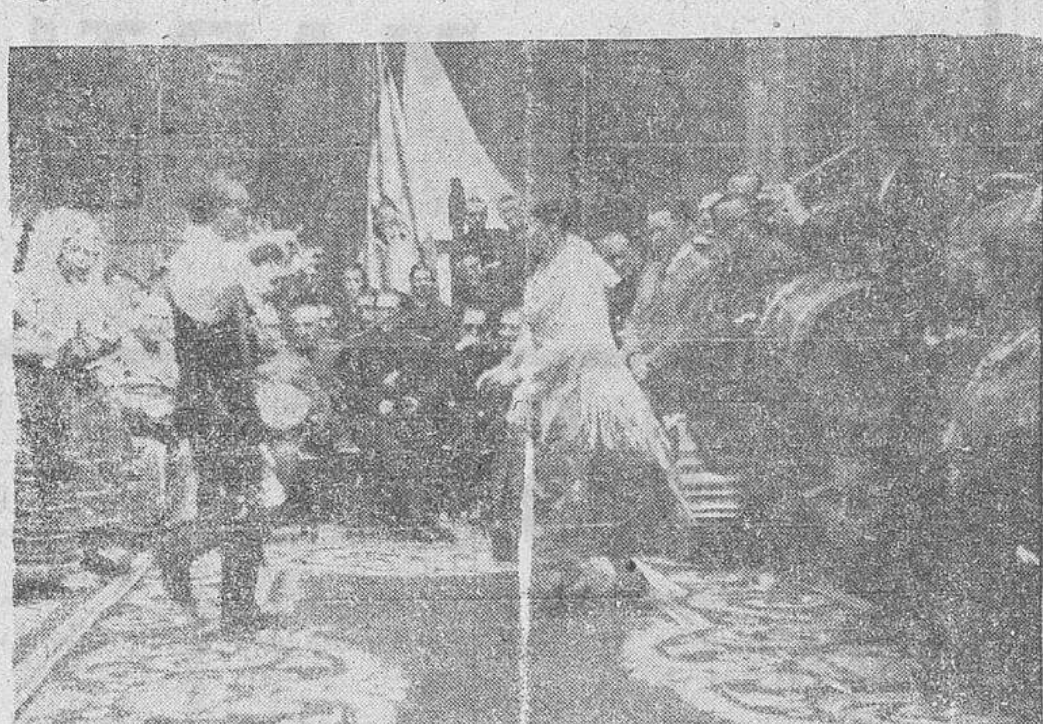
La pareja de bailarines de Mogamraz actuando con la Coral Salmantina en la C. N. S. de Albacete.—Al fondo el Gobernador civil de Albacete y autoridades