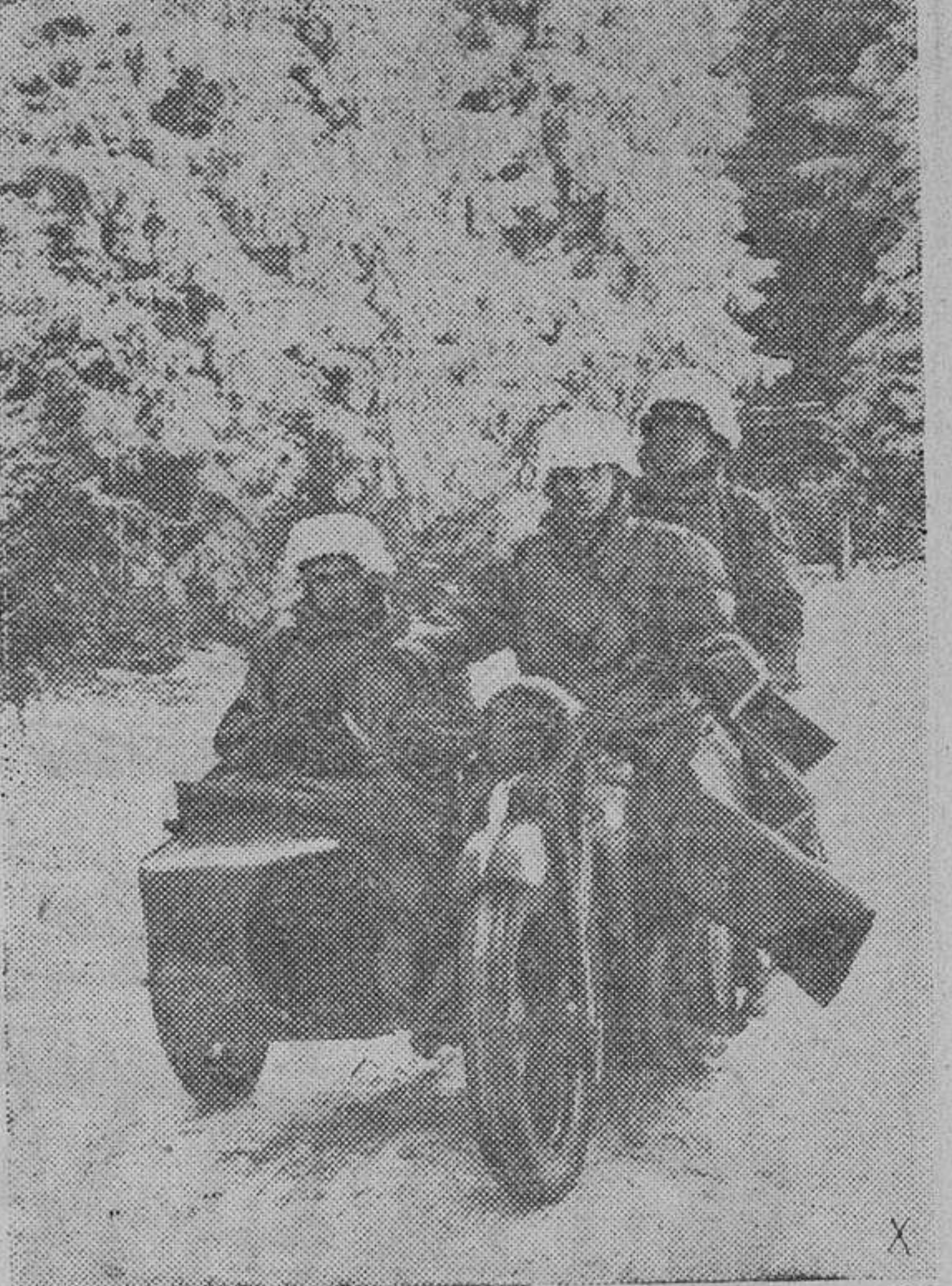
Por las pistas que forma la nieve casi helada, marchan las columnas motorizadas alemanas a los puntos que le ha designado el mando para pasar la época invernal