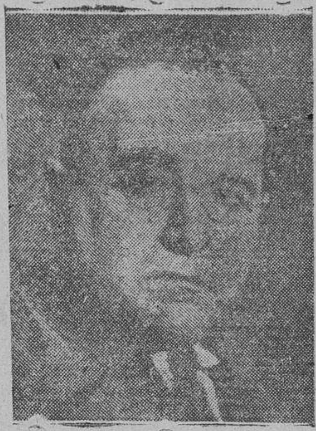
El presidente del Brasil, Getulio Vargas, que preside las sesiones de la Conferencia

Río de Janeiro. — Actualmente, horas antes de comenzar las sesiones, no se sabe con certeza cuál será la actitud que adopten las