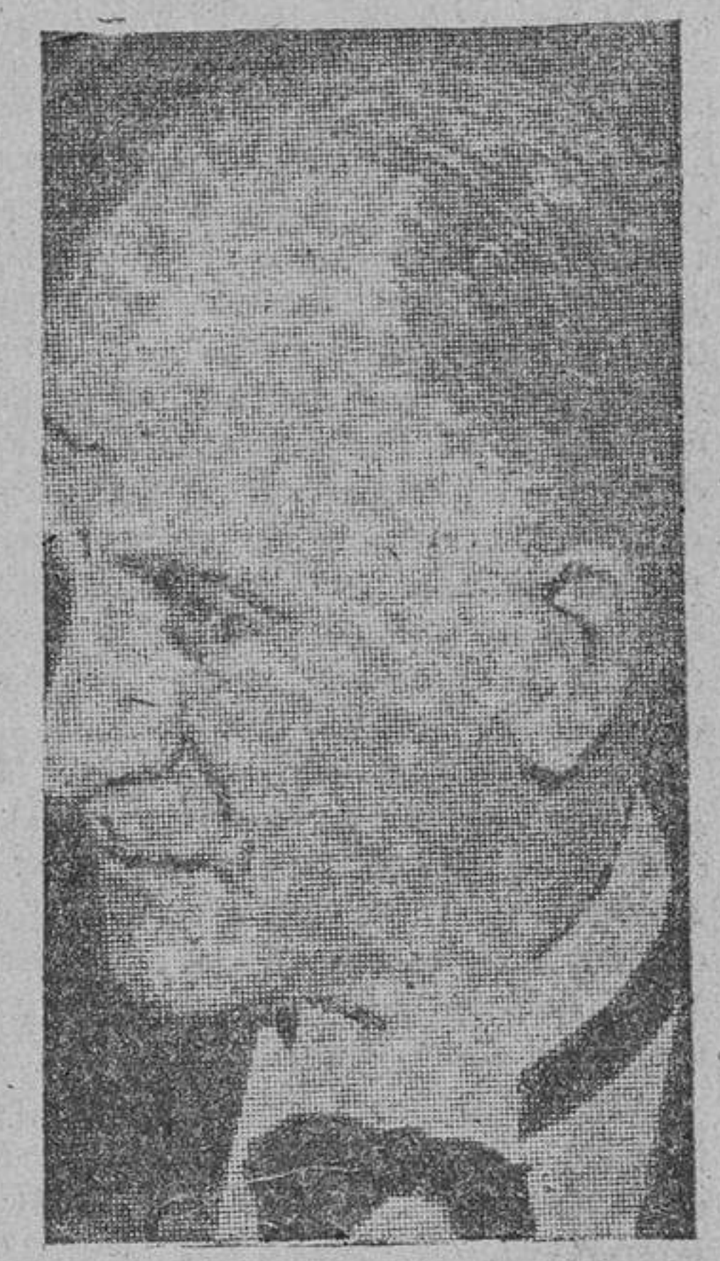
Sumner Welles, jefe de la Delegación norteamericana

La sociedad no rechaza a nadie por ser pobre, pero sí a la sociedad ostentada llamativamente. Y no se diga que la carencia de jabón es la causante de la falta de aseo personal que se advierte en muchas personas; con agua basta para poner en orden la limpieza individual, cuando es un hábito y una necesidad el estar limpio y no se ha reñido con las prácticas higiénicas más elementales. Debemos todos esforzarnos por extremar estas medidas, ya que del abandono pueden surgir peligros colectivos que es necesario evitar y prever hasta donde humanamente sea posible.