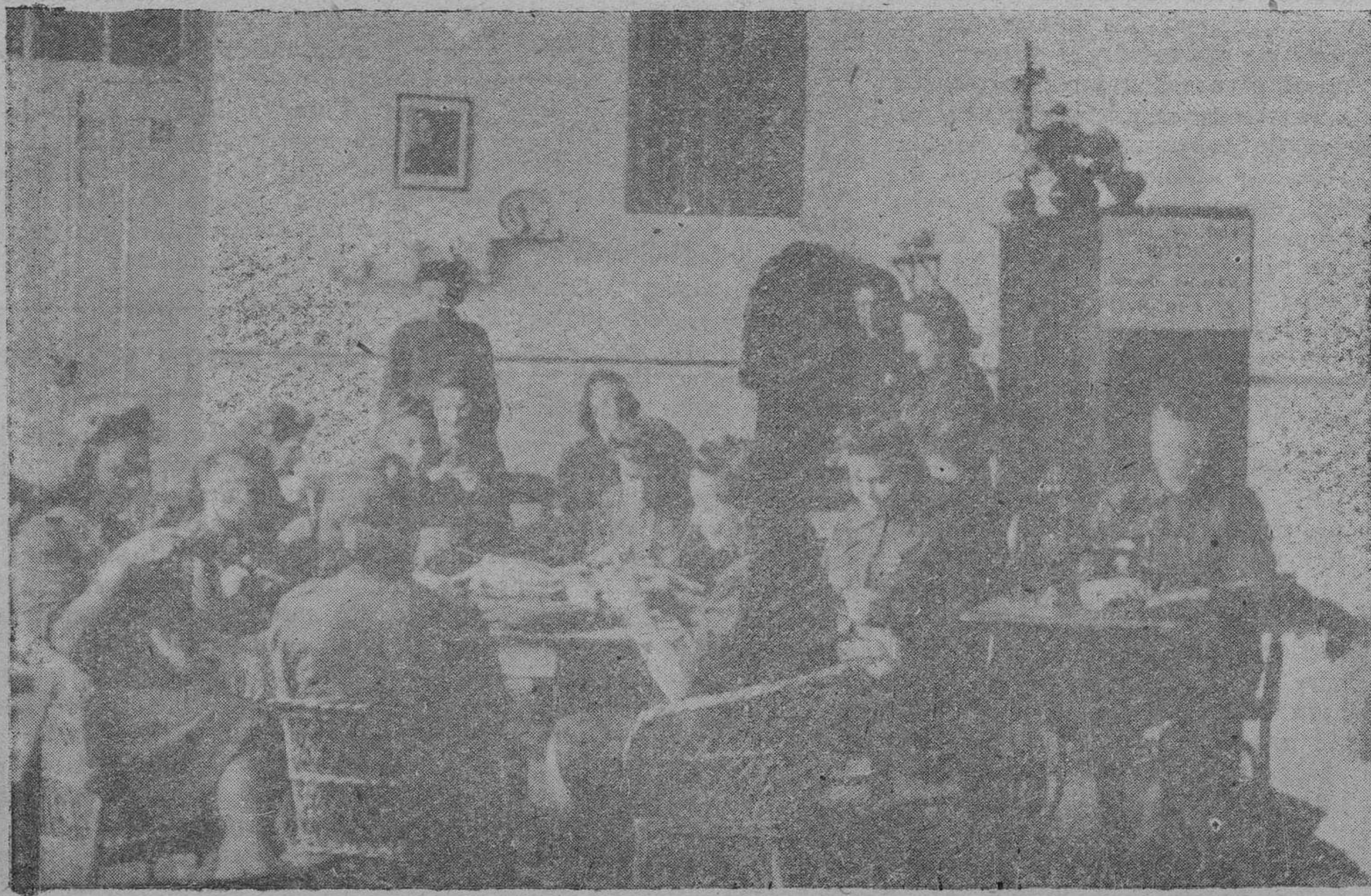
Camaradas de la Sección Femenina trabajando con todo entusiasmo y cariño en la confección de prendas de abrigo para los heroicos voluntarios de la División Azul

aportación de los salmantinos ha de lograr. Salamanca entera ha de contribuir, sin duda, a la empresa de llevar calor cariñoso y amable recuerdo hasta las estepas rusas, hasta las desoladas ciudades en que nuestros compatriotas ejemplares han de vivir las horas de navidad y del Año Nuevo. Todos los salmantinos van uniéndose en la labor conjunta con su apor-