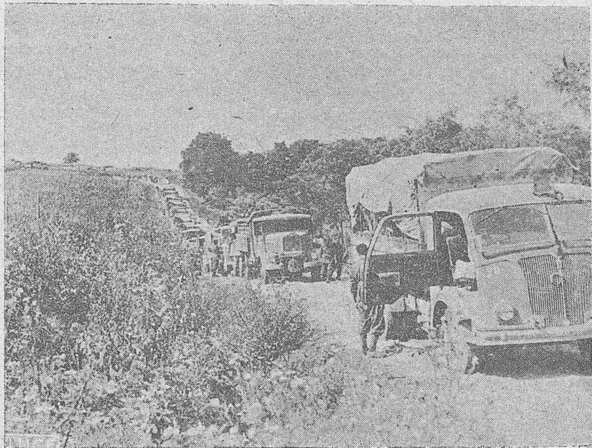
Una columna motorizada italiana, en marcha de aprovisionamiento al frente ruso.

"Un pequeño número de aviones enemigos han volado la noche