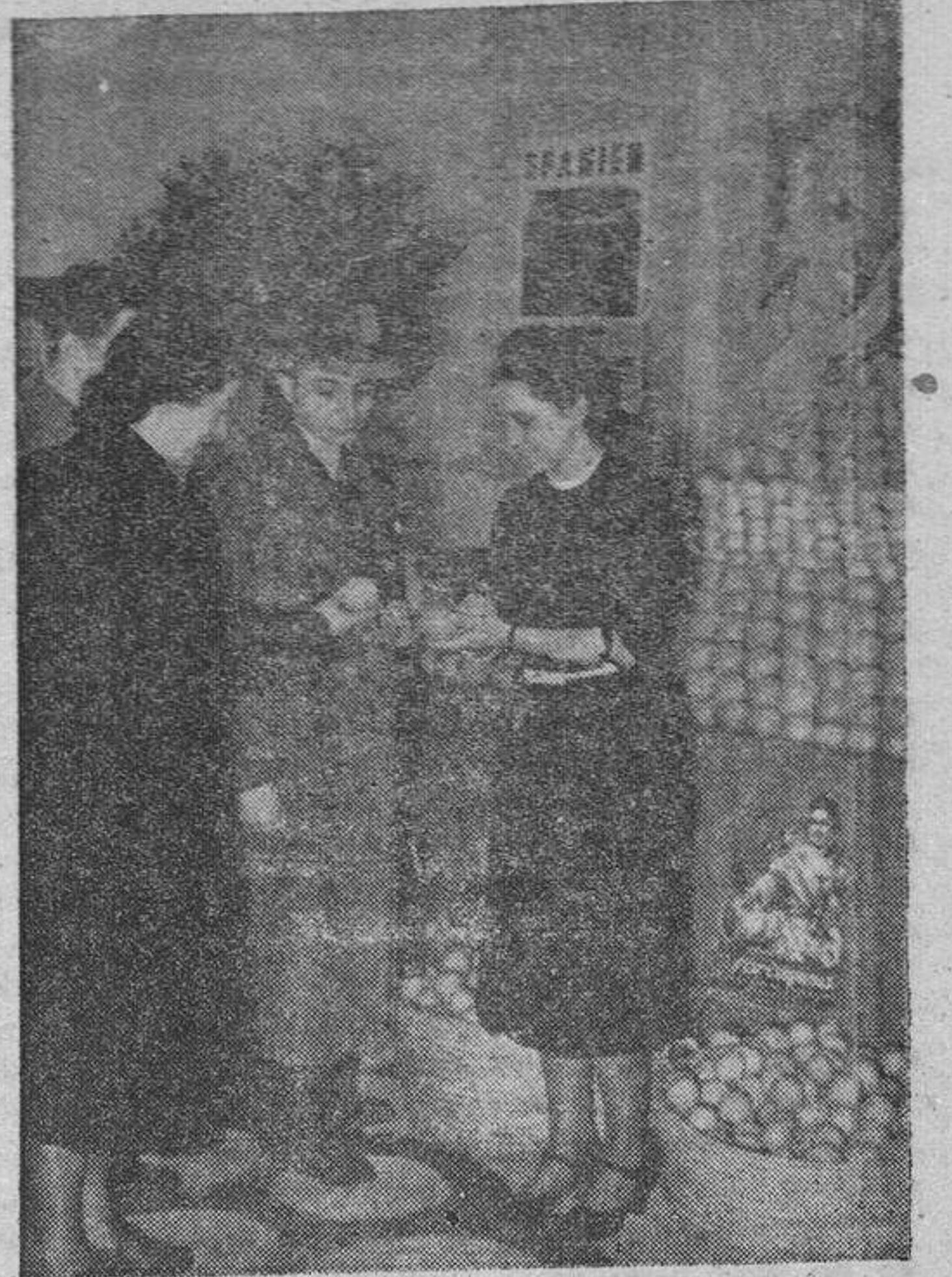
Detalle de la instalación española (frutas)

manes, que han desfilado por el famoso certamen, verificándose importantes transacciones, por valor de varios millones de marcos.