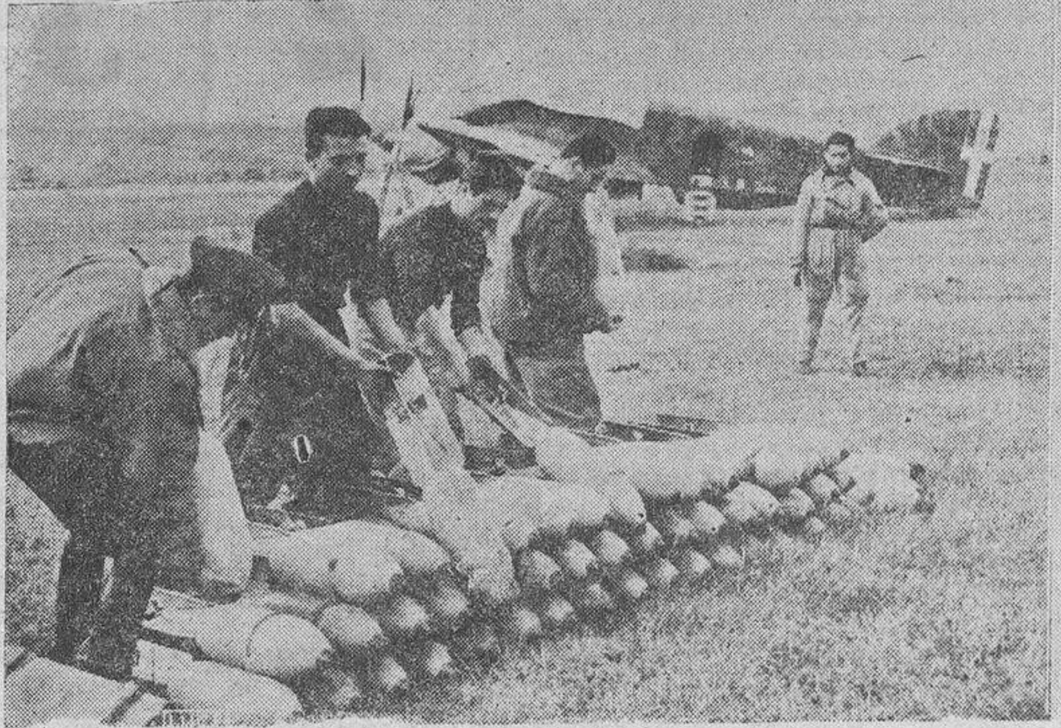
Aviadores italianos preparando sus cargas de bombas en un aerodromo de Albania

Nueva York.—Radio Mackay ha captado una llamada de socorro del buque británico "Empire Jaguar" y otra del buque cisterna noruego "Middlesjora", que navega con pabellón