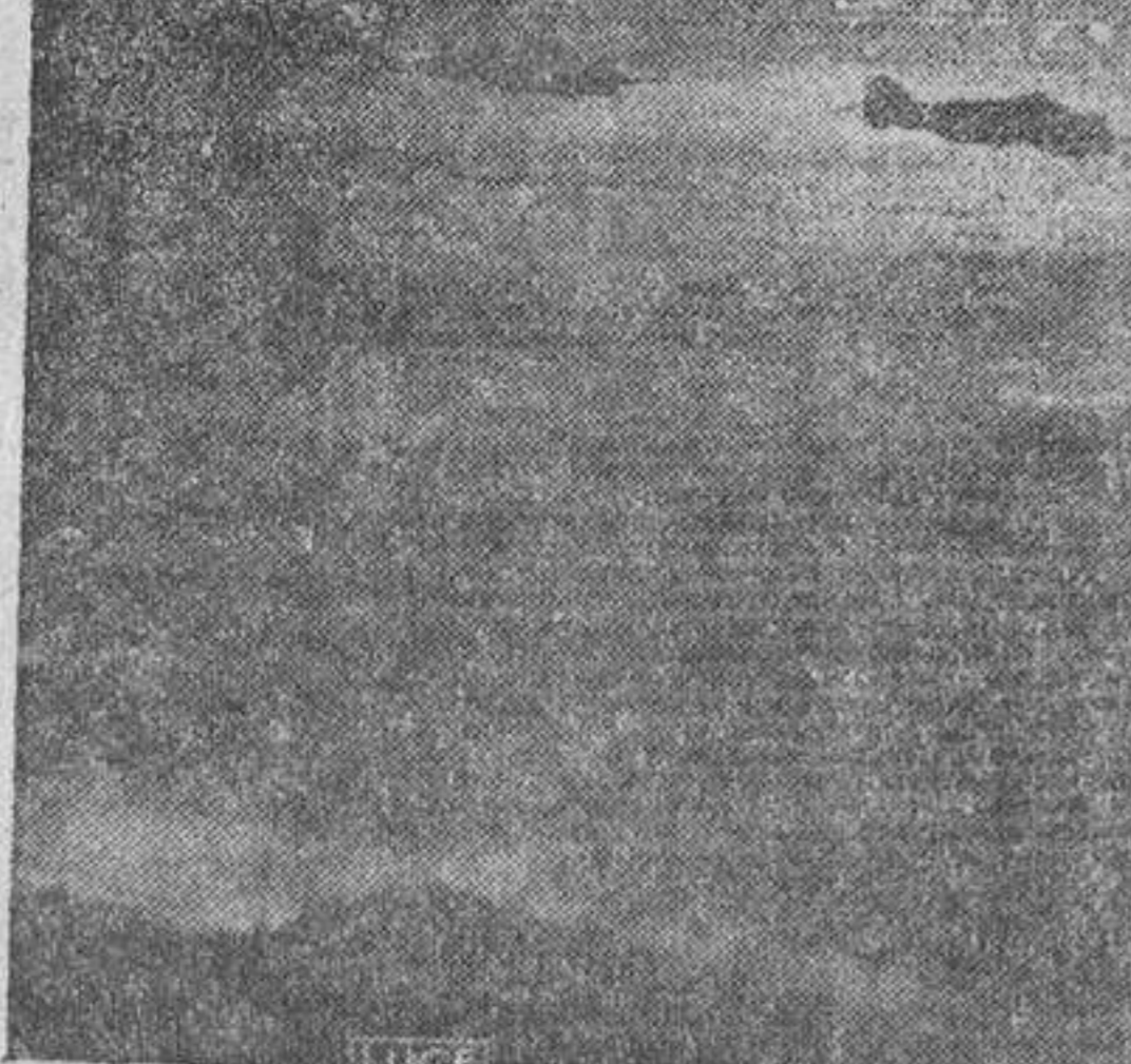
Una escuadrilla de bombarderos italianos volando sobre territorio griego en una de sus diarias incursiones para alcanzar objetivos militares y columnas de abastecimiento del enemigo

Berlín.—La agencia DNB comunicó que setecientos mil kilos de bombas explosivas y de ochenta a cien mil kilos de bombas incendiarias, han sido arrojadas sobre la ciudad de Londres en la noche del domingo al lunes. Se señala que la defensa antiá-