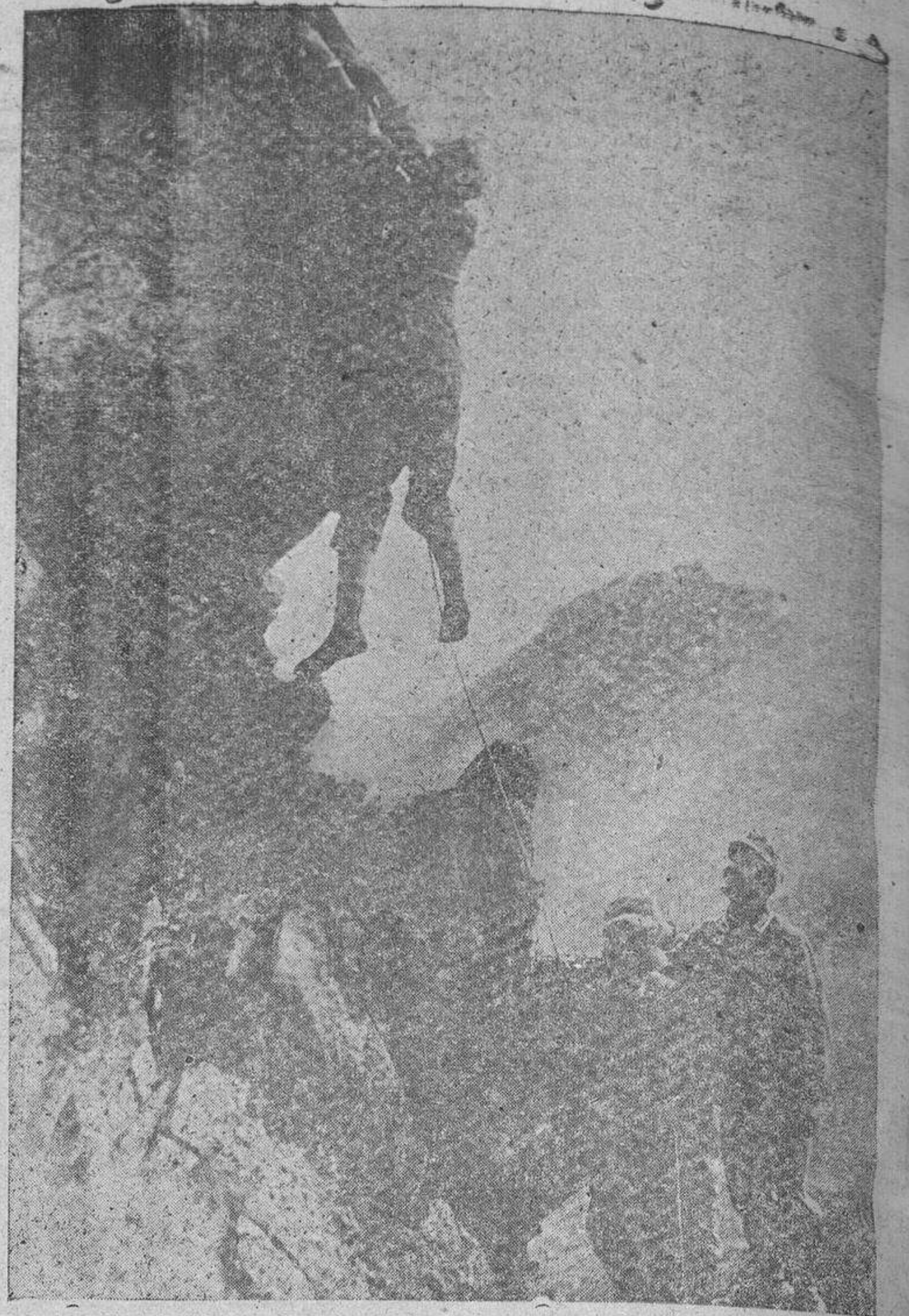
El Ejército alemán viene instruyendo en cursillos especiales gran número de guías alpinistas reclutados principalmente entre soldados bávaros y austriacos

El país conservará su soberanía territorial y los Estados Unidos facilitarán el material y el personal necesario para la organización de dichas bases. Una de ellas, aérea, será establecida en Carrasco, a 16 kilómetros de Montevideo, y otra, naval, en la desembocadura del Río Plata. (Efe.)