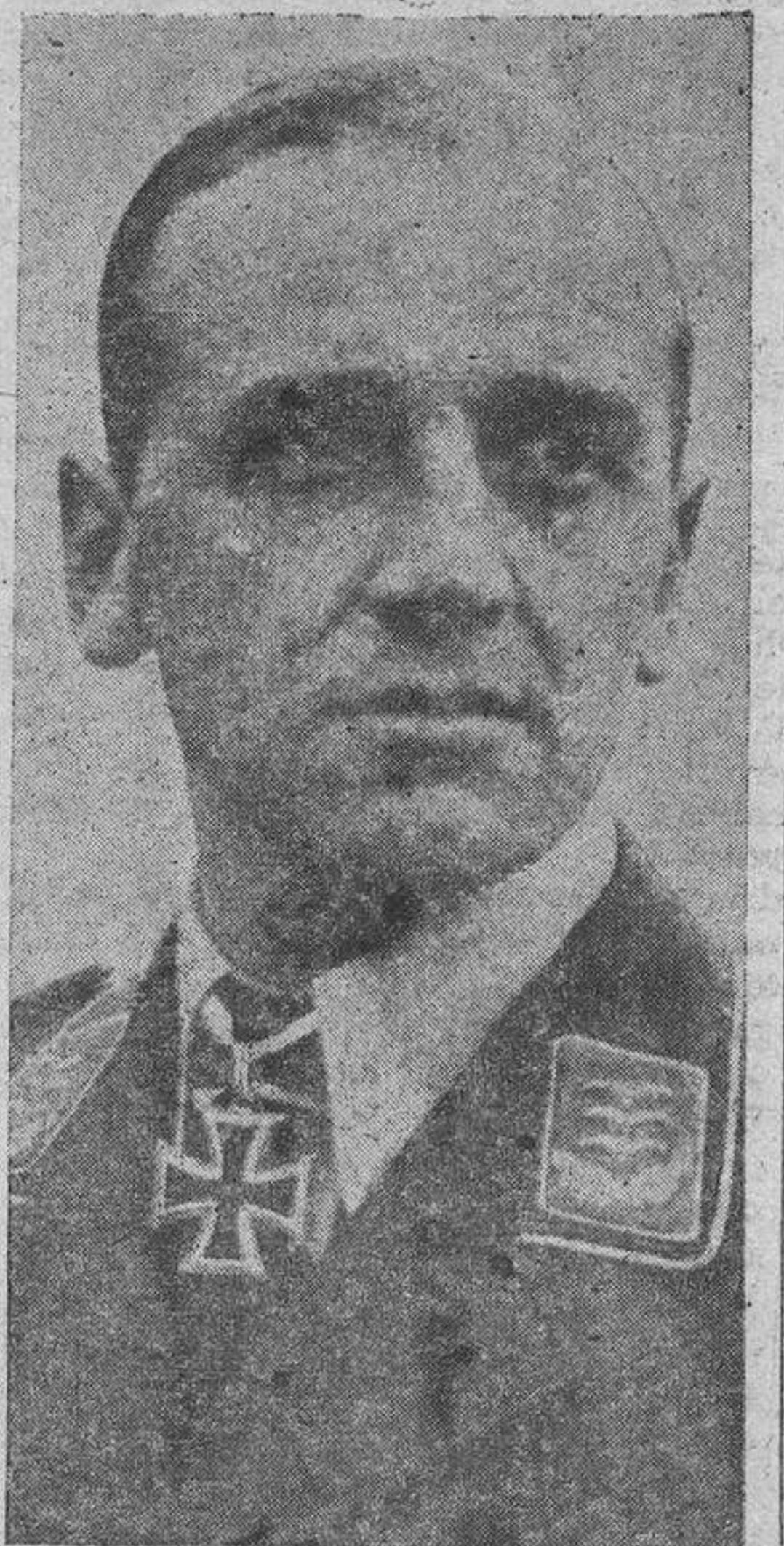
El capitán Streib, jefe de una escuadrilla de cazas nocturnos, fué condecorado con la Cruz de Caballeros por las victorias logradas en combates con aparatos ingleses.

Londres. — Comunicado del Ministerio de Seguridad Interior y del Aire: "Los ataques del enemigo sobre este país comenzaron ayer a la caída de la tarde, especialmente en Escocia oriental, Midlands y Londres. En ningún momento se desarrollaron en gran escala. Más avanzada la noche, estos ataques disminuyeron y solamente se registraron "raids" intermitentes hasta las primeras horas de la mañana. En cuyo momento volvió a aumentar la actividad. El número de víctimas que hasta las siete horas se