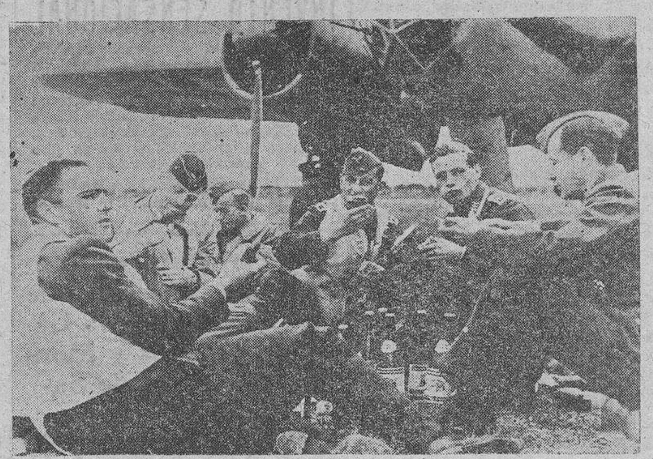
Aviadores de una escuadrilla de combate alemana, dispuestos a levantar el vuelo en cualquier momento, dan muestras de su buen apetito.

Berlín. - En la noche del 1 al 2 de noviembre, Amsterdam ha sido bombardeado por los aparatos británicos, que arrojaron bombas explosivas sobre barrios habitados. Un hospital militar resultó gravemente alcanzado. Ha-