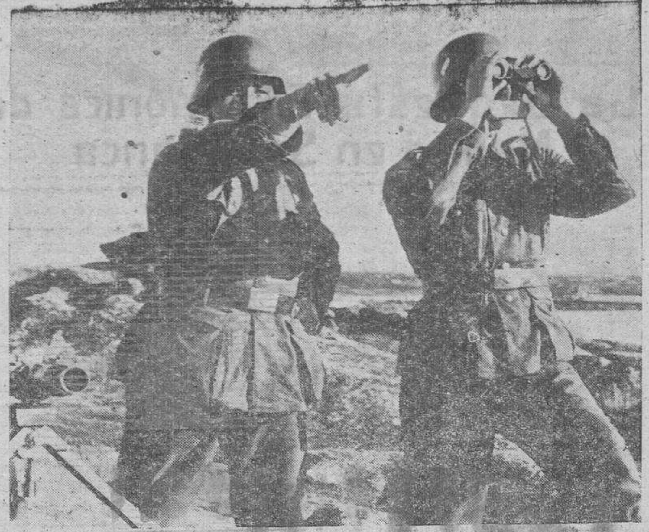
Avanzadilla alemana de observación en uno de los puntos más próximos a Inglaterra, en el Canal de la Mancha

Hoy, domingo, 15 del actual, tendrá lugar en esta capital y pueblos de la provincia, la cuestación pública de AUXILIO SOCIAL. El emblema que se pondrá a la venta es la alegoría del DISCO-BOLO, representación de la fuerza y el deporte.