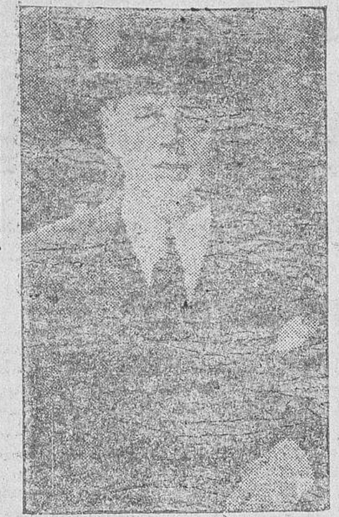
...mente con el Conde Ciano. (DNB.)

Berlin.— El ministro alemán de Negocios Extranjeros, von Ribbentrop, saldrá el jueves hacia Italia, donde permanecerá varios días. Se cree que conversará personalmente con el Conde Ciano. (DNB.)