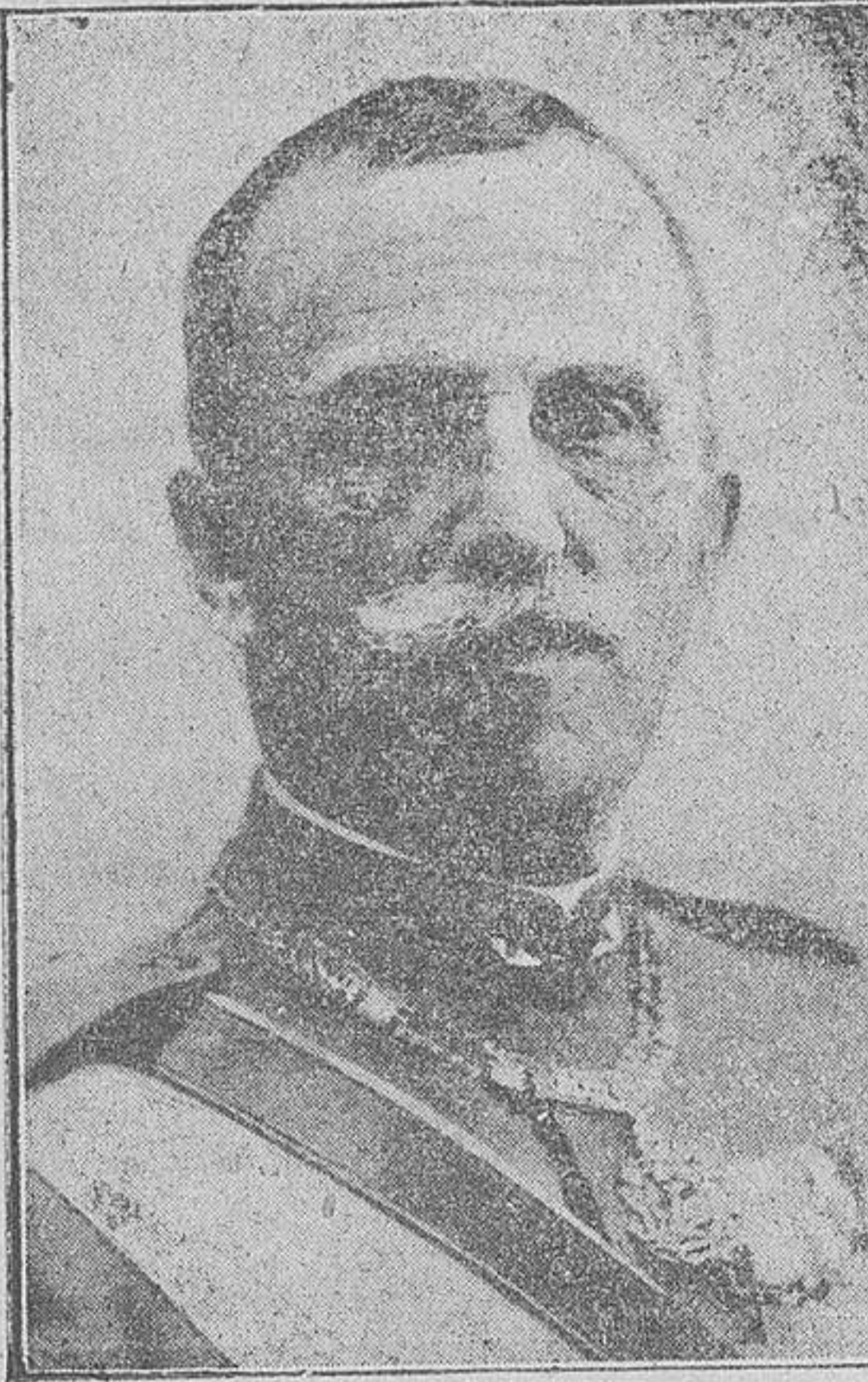
S. M. EL REY - EMPERADOR DE ITALIA, VÍCTOR MANUEL III, NACIDO EN NAPOLLES EL 11 DE NOVIEMBRE DE 1869, Y QUE CUMPLE HOY SESENTA Y NUEVE AÑOS

Si todo el valor de un hombre se mide por el grado de fidelidad con que ha cumplido la misión que Dios le ha señalado en la vida terrenal, no hay duda que la personalidad de Víctor Manuel III se nos presenta dentro de su concreto cometido de soberano y de su simbólica representación del pueblo de Italia, con el más limpio relieve del cumplimiento perfecto e impecable de una alta y delicada función dentro del sistema jerárquico del Estado. Víctor Manuel III, que subió al Trono en 1900, ha ejercido durante su largo reinado su alta función de realeza en un período excepcionalmente agitado y tempestuoso de la historia europea, en el que las guerras y las revoluciones, algunas de ellas las más terribles que haya registrado la historia, han conmovido hasta sus cimientos las bases no sólo de la política, sino de la civilización de Europa. Y Víctor Manuel III, al cabo de los treinta y ocho años de su reinado, ha podido verse firmemente asentado en su trono en medio del derrumbamiento de la mayoría de los que no pudieron resistir al embate furioso de las últimas tormentas del destino. Aparte de todas las consideraciones que pueda sugerir un estudio atento de su largo reinado, podemos desde luego afirmar que un rey que ha tenido la virtud de sobrevivir a la más honda de las revoluciones modernas, cual es la fascista, es digno de seguir siendo rey, de seguir ocu-