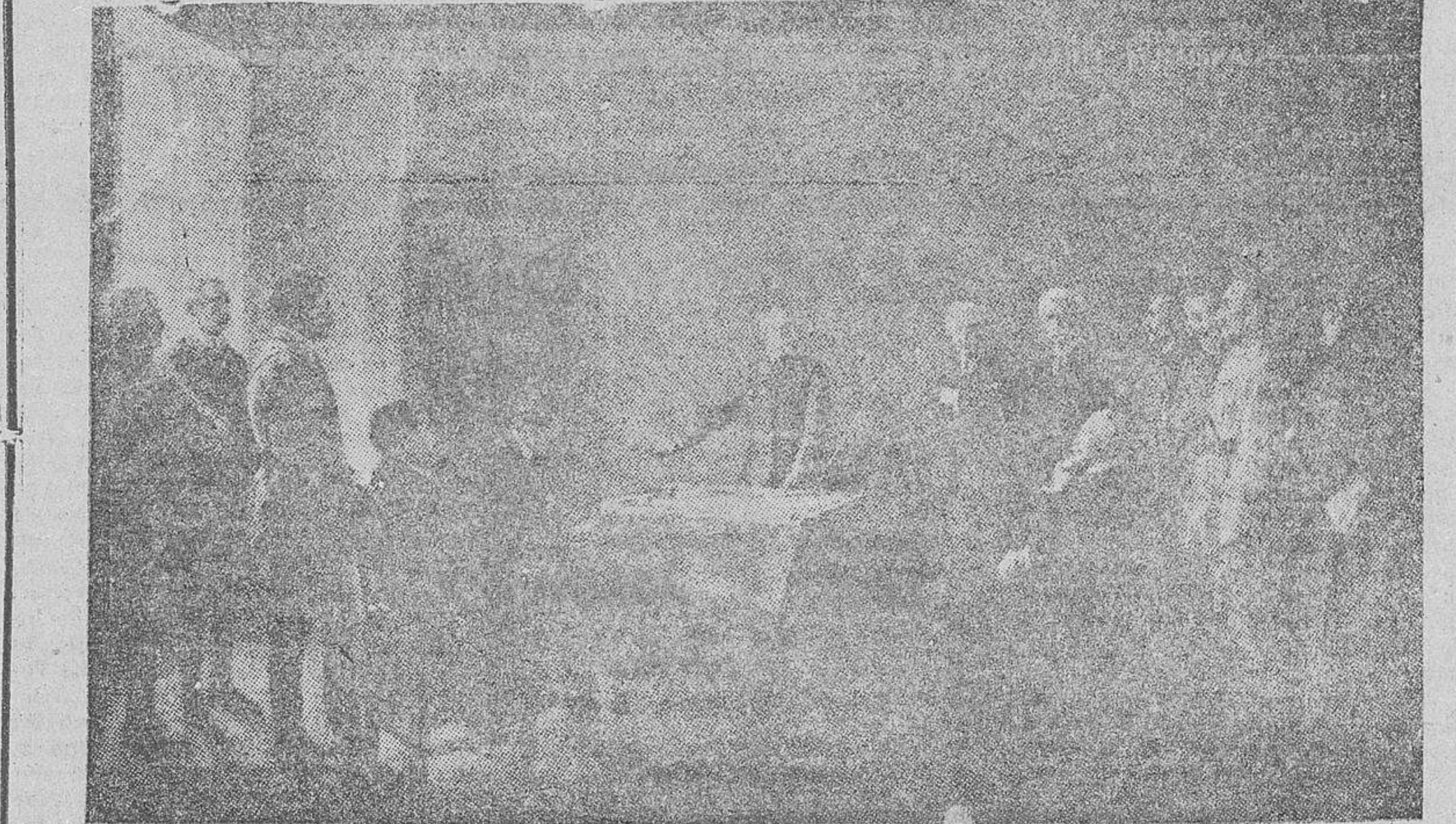
8 de Noviembre de 1917.—El histórico Convenio de Peschiera, en el que S. M. Víctor Manuel III fijó la línea de resistencia en el Piave

La historia del Fascismo es—en uno de sus aspectos—el resultado de la íntima penetración de Víctor Manuel III con Mussolini y de su leal y siempre inteligente colaboración se ha ahorrado la enorme complicación y las graves consecuencias que hubiera entrainado el mantenimiento de determinados puntos de su primitivo programa revolucionario, la suerte que le deparó la Providencia al encontrarse con un soberano tan inteligente y tan impetuoso de su papel en la historia, permitió a Mussolini realizar el milagro de llevar a cabo la más profunda de las revoluciones modernas sin tener que destruir "los cuatro pilares básicos del Estado y de la Nación" a los que se refirió en su discurso de Milán del 28 de Octubre de 1923: la Mo-