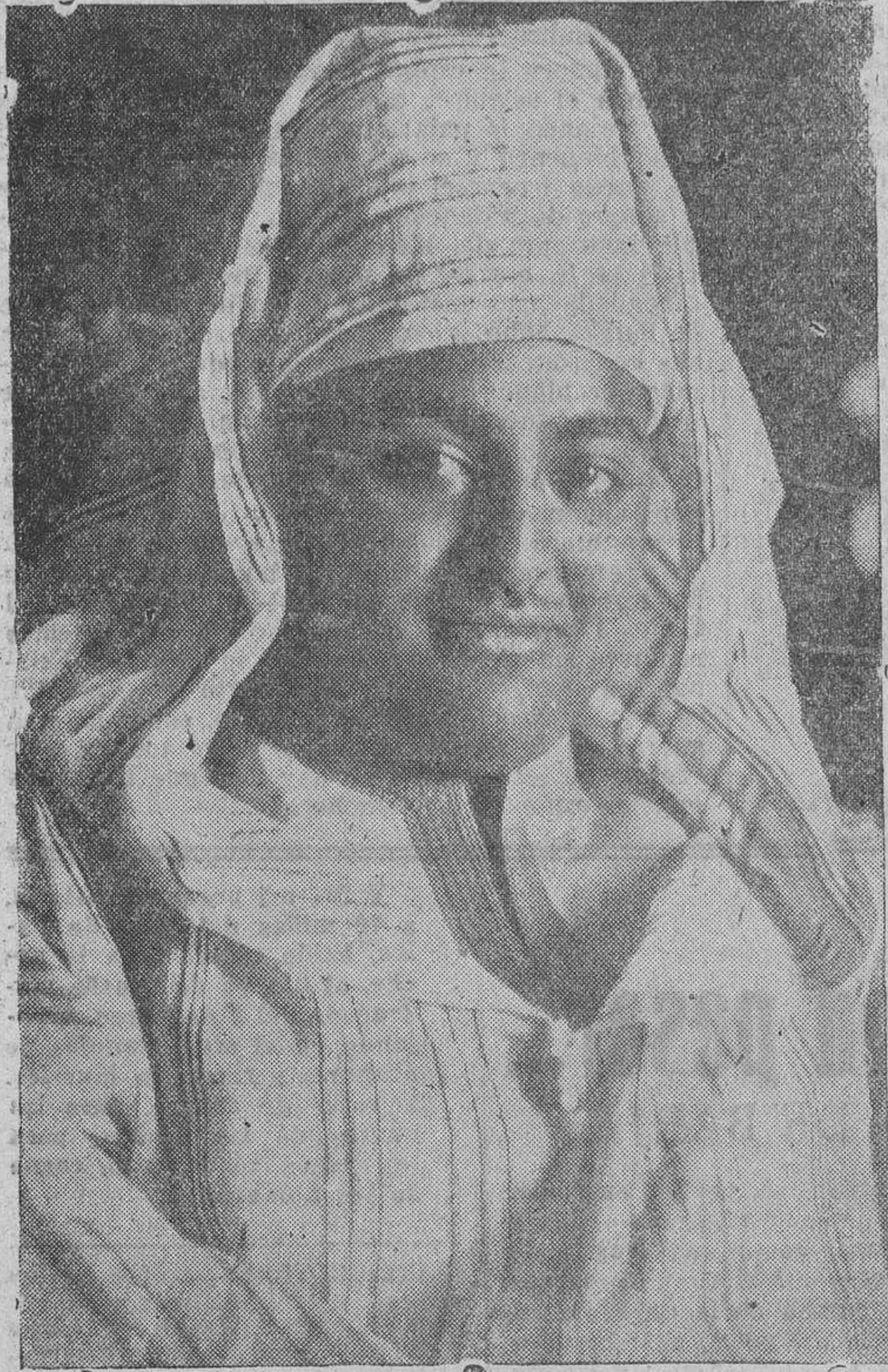
Su Alteza Imperial Hasan El Mehdi, Jalifa de Marruecos, el hombre que supo comprender desde los primeros momentos el gesto viril y heroico que hizo despertar a España...