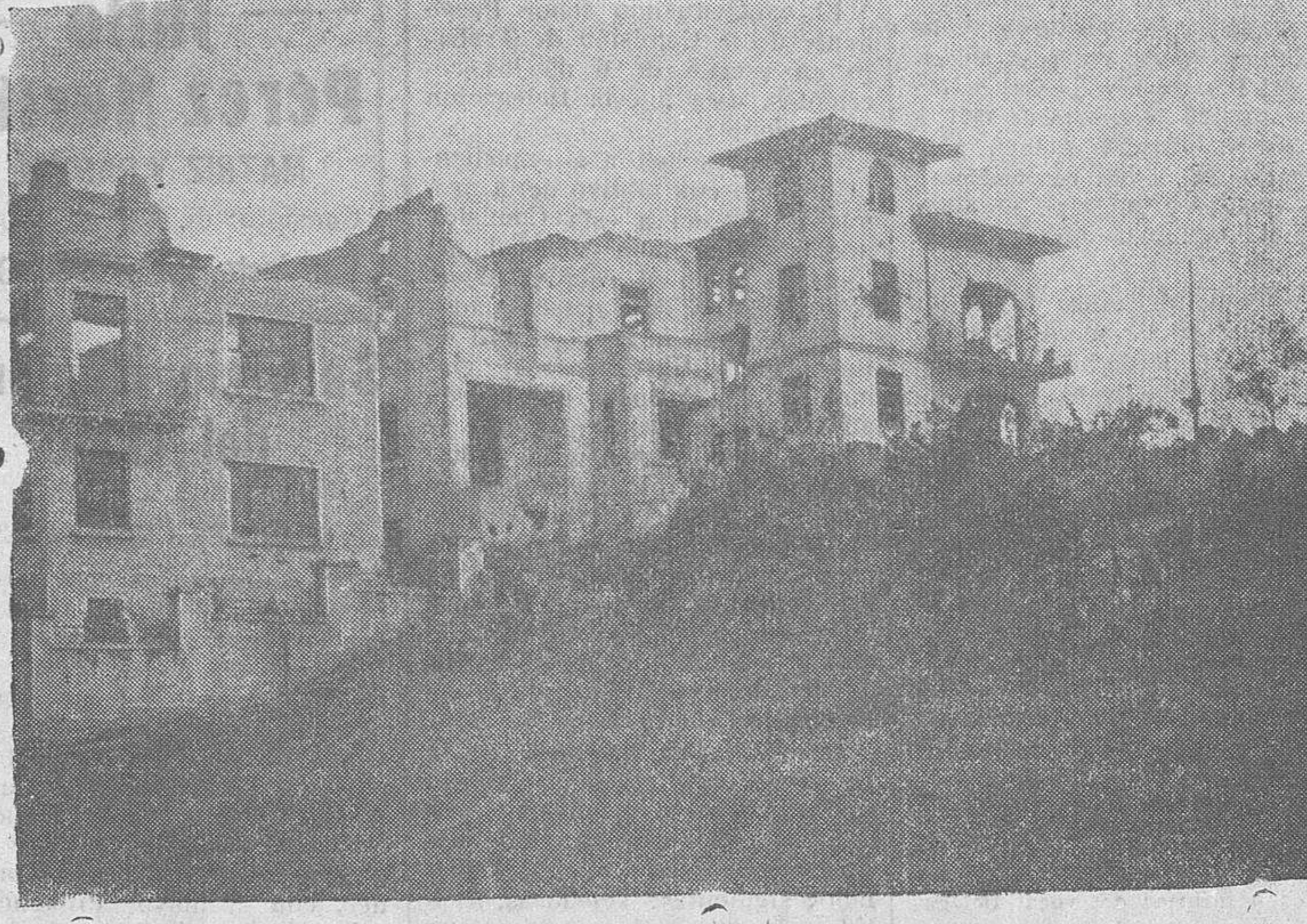
La horda ha hecho víctima de su furor a Oviedo. La metralla dejó sus señales de destrucción en estas caas del barrio de las Adoratrices